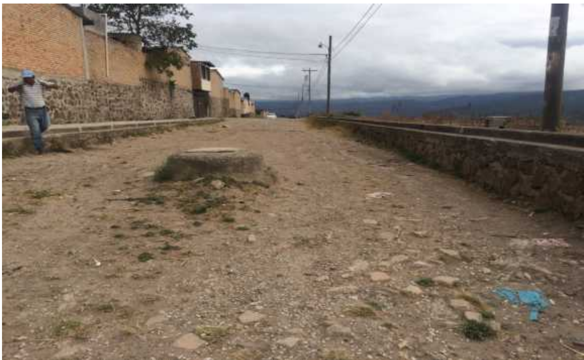
Vista de la calle