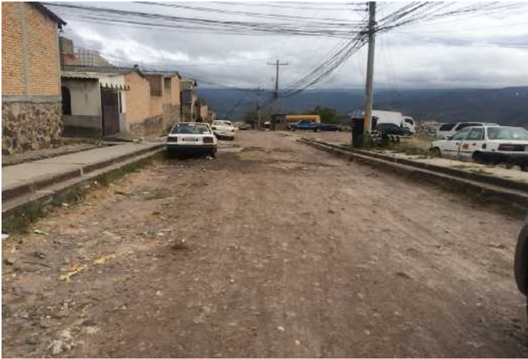
Inicio de calle a pavimentar