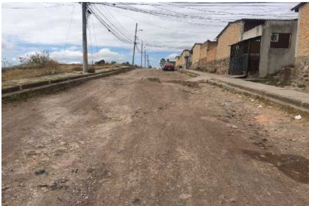
Vista de calle a pavimentar