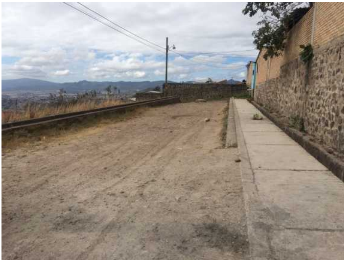
Fin de la calle a pavimentar