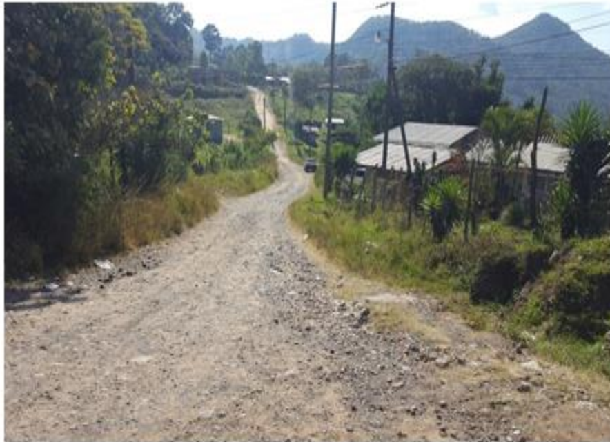
INICIO DE CALLE A REPARAR