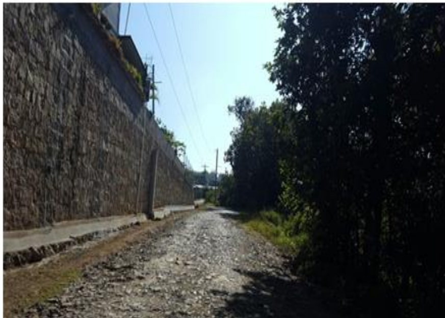
VISTA ACTUAL DE CALLE A REPARAR