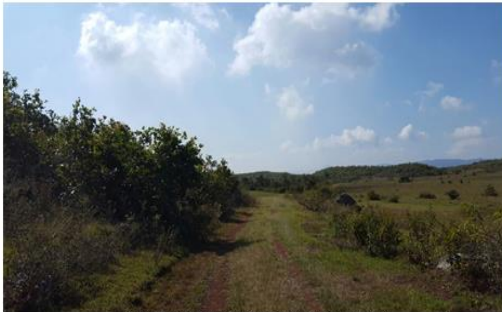
VISTA DE CALLE QUE REQUIERE BALASTADO