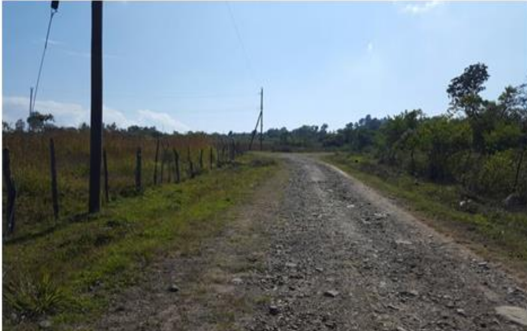
VISTA PANORÁMICA DE CALLE A REPARAR