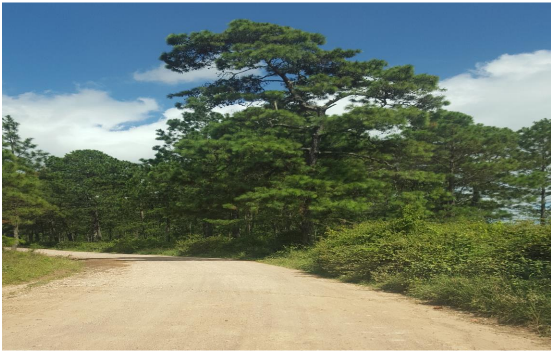
VISTA ACTUAL DE CALLE A REPARAR EN ALDEA SAN MATIAS