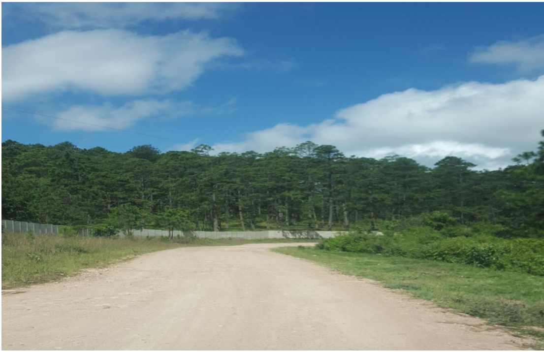
INICIO DE CALLE A REPARAR EN ALDEA SAN MATIAS