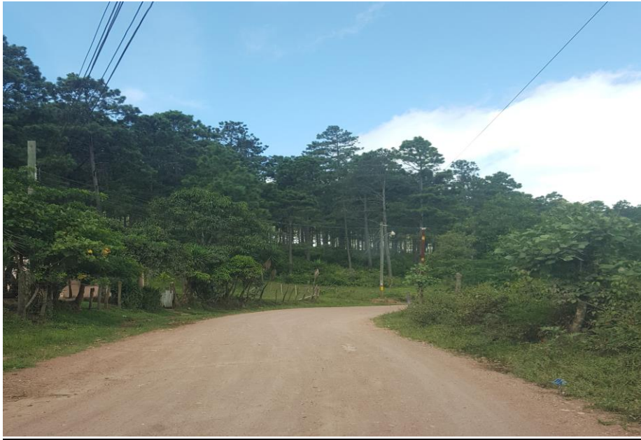
PANORÁMICA DE CALLE A BALASTAR EN ALDEA SAN MATIAS