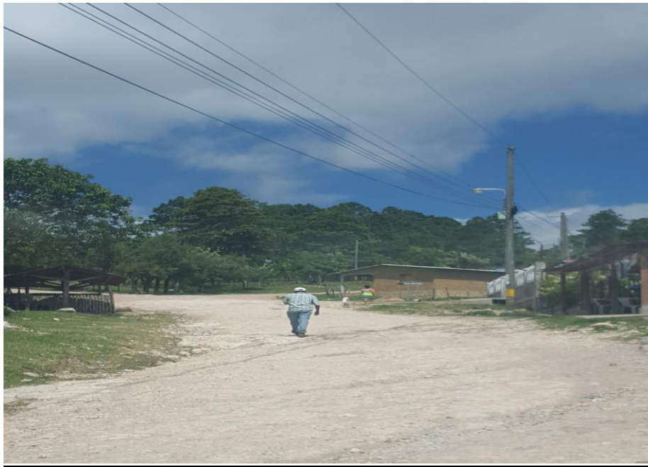
VISTA DE FINAL DE CALLE A BALASTAR