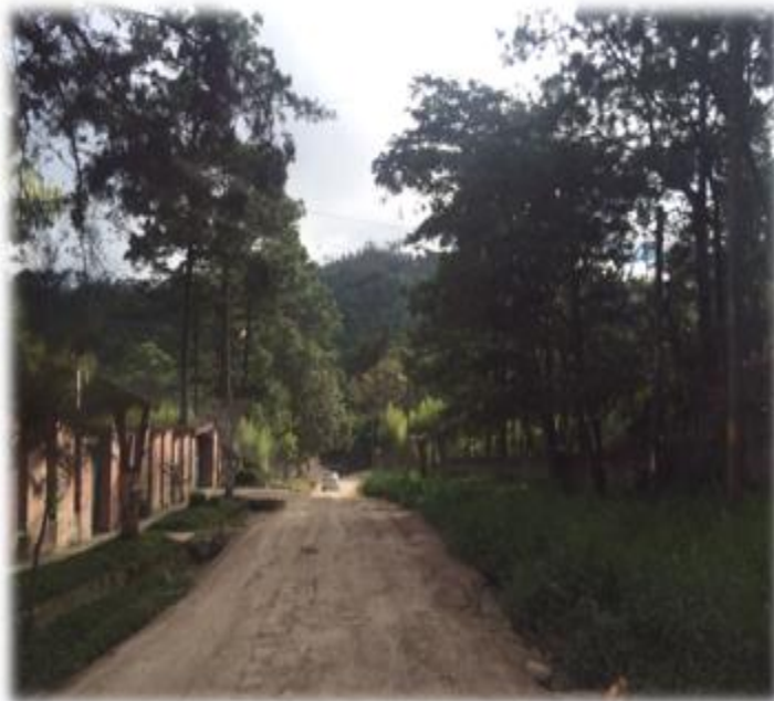
VISTA DEL ESTADO DONDE SE CONSTRUIRAN LAS CUNETAS