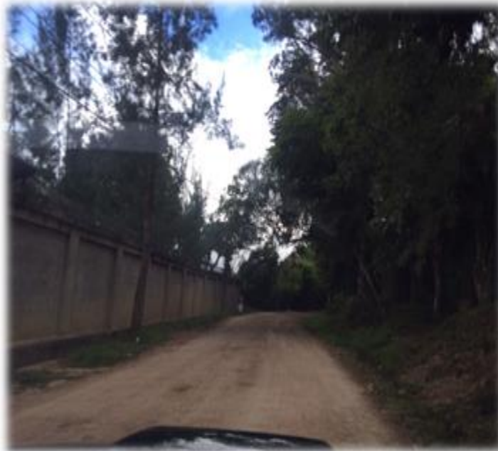
INICIO DE CUNETAS A CONSTRUIR.