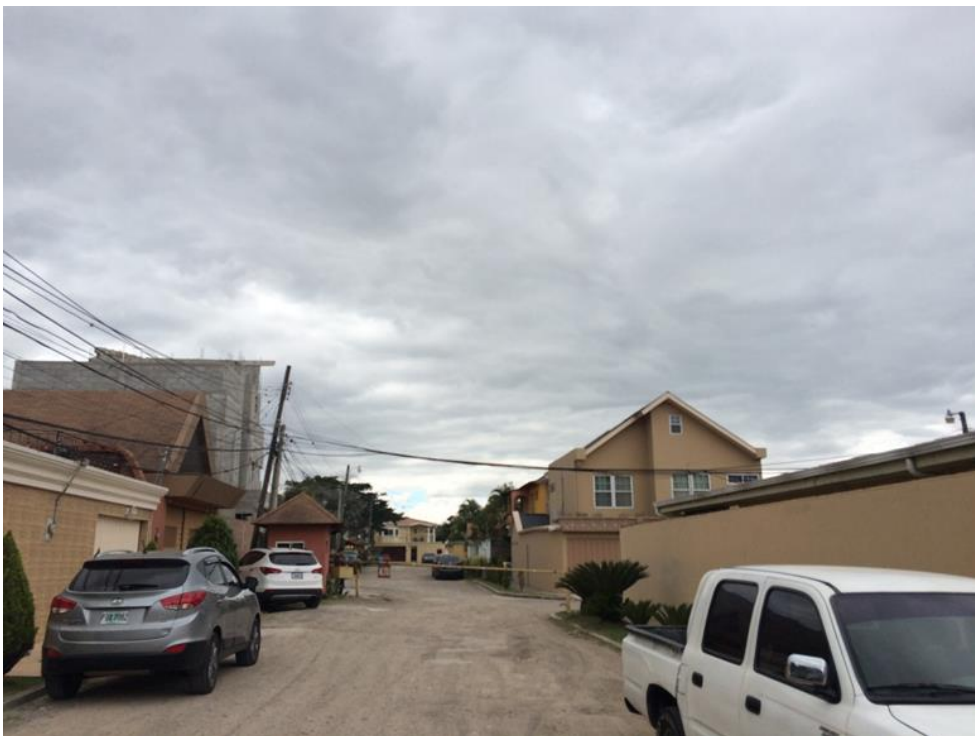
Panorámica de calle a pavimentar con concreto hidráulico