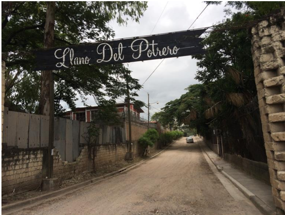
Inicio de calle "A" a pavimentar con concreto hidráulico