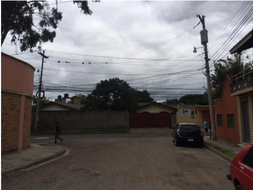
Inicio de calle "B" a pavimentar con concreto hidráulico

Proyecto: Pavimentación de calle con concreto hidráulico, col. América, sector 2 Código: 1460