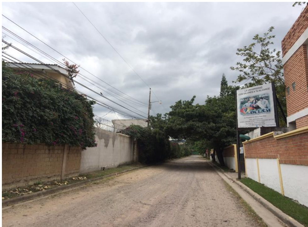
Panorama de calle a pavimentar con concreto hidráulico