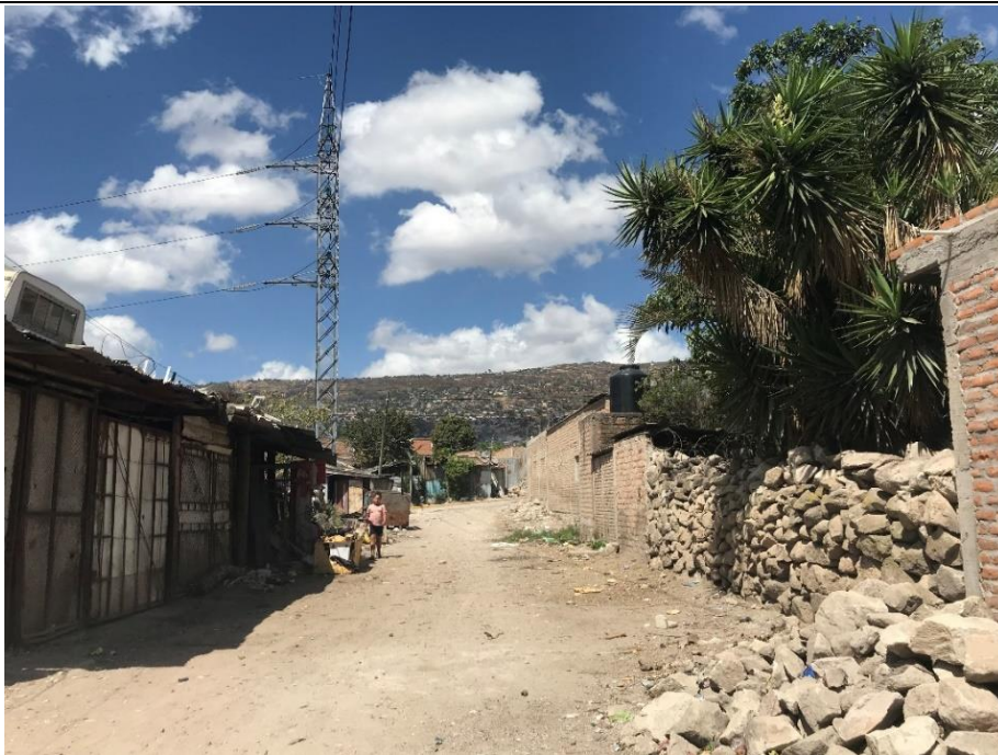
VISTA DEL FINAL 3