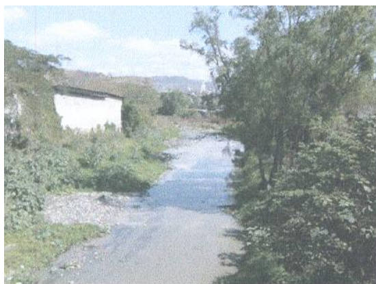
PUENTE SAN JOSE DE LA VEGA