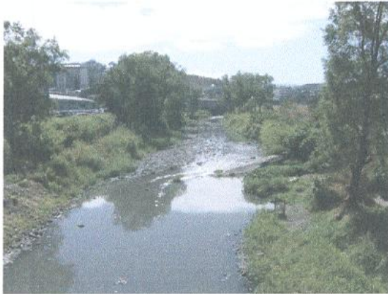
PUENTE EL PRADO

Condición actual de río Choluteca tramo II, puente San José de la Vega-puente El Prado