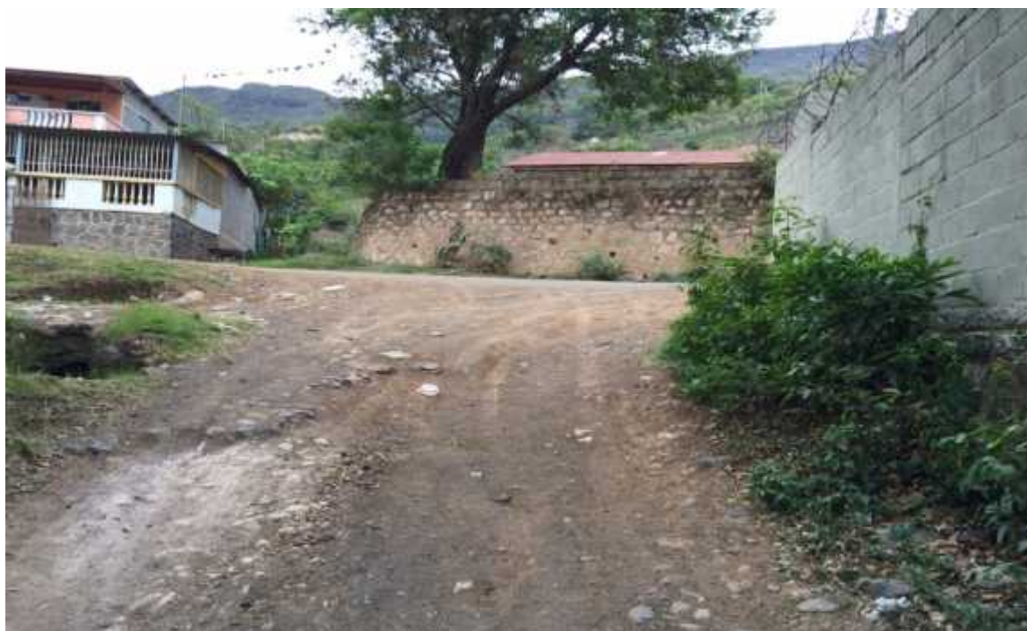
FINAL DEL PROYECTO