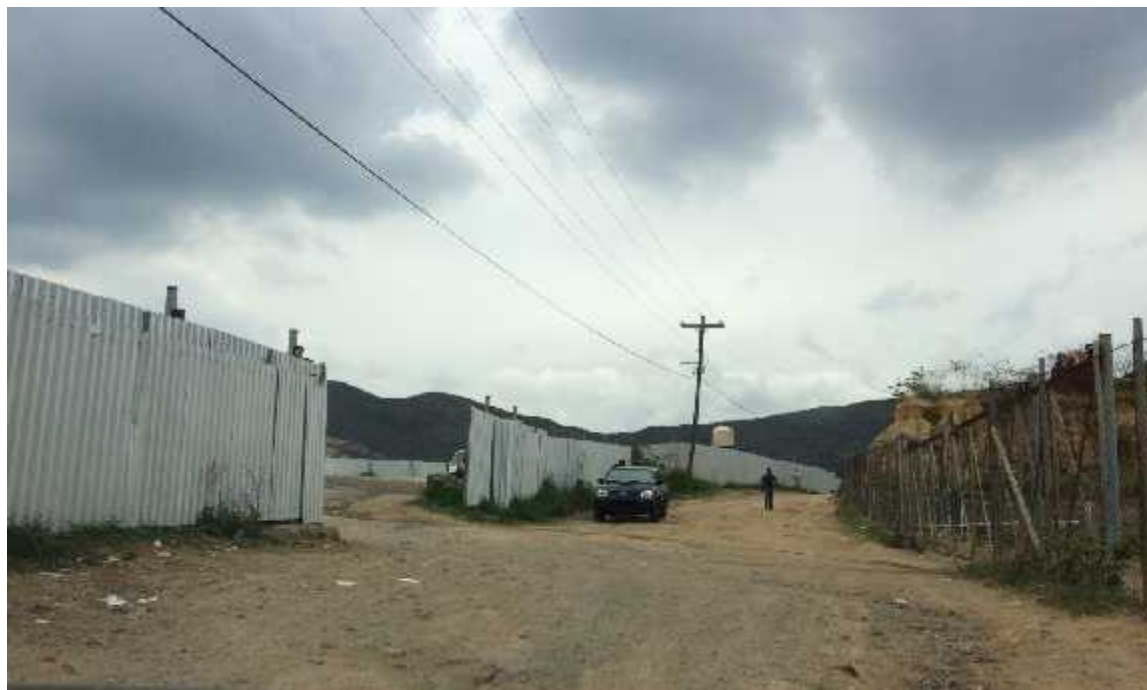
INICIO DEL PROYECTO