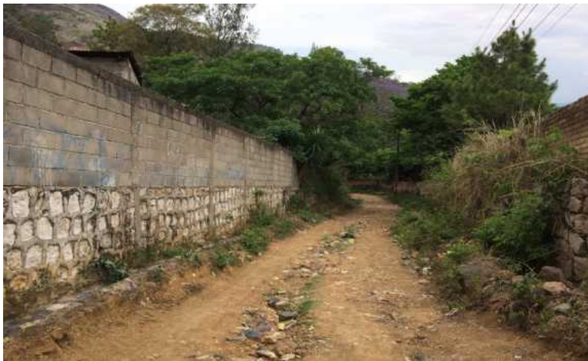
VISTA PANORAMICA DE CALLE DE PROYECTO