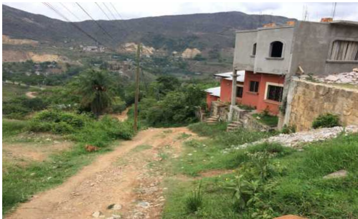
TRAMO A REPARAR CON HUELLAS VEHICULARES