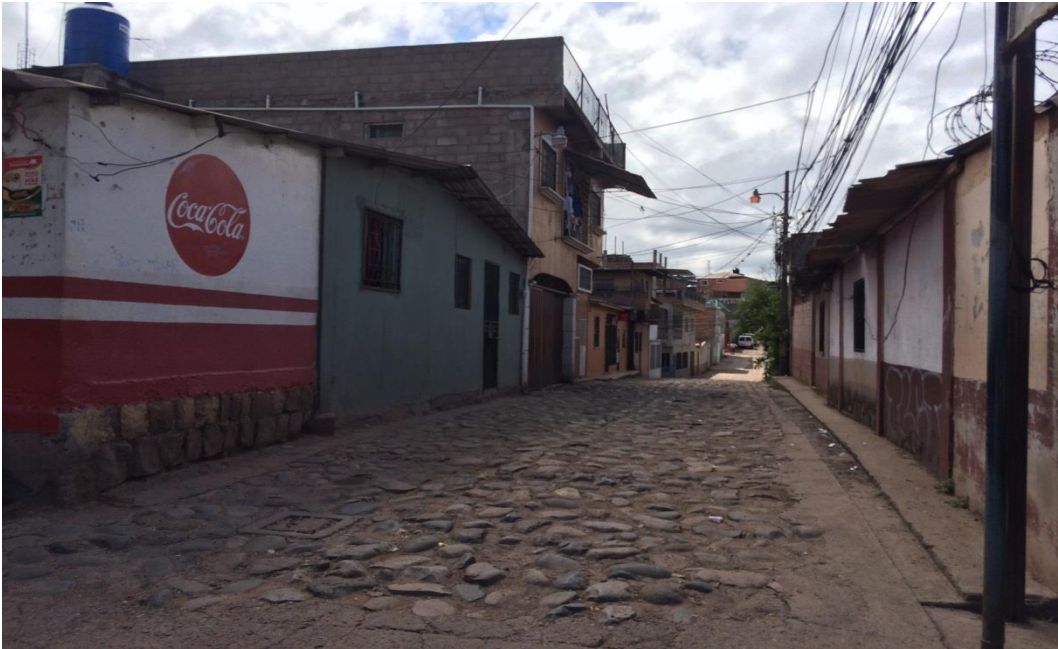
Inicio de calle a pavimentar con White Topping