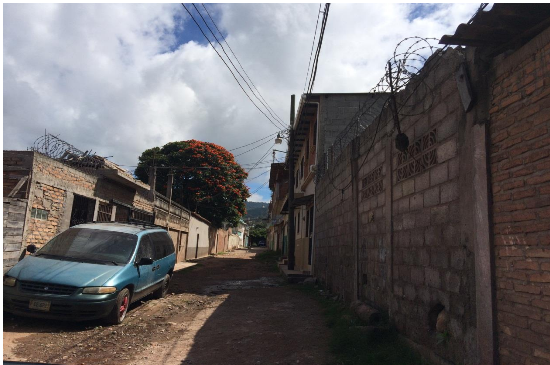
Final de calle a pavimentar con concreto hidráulico