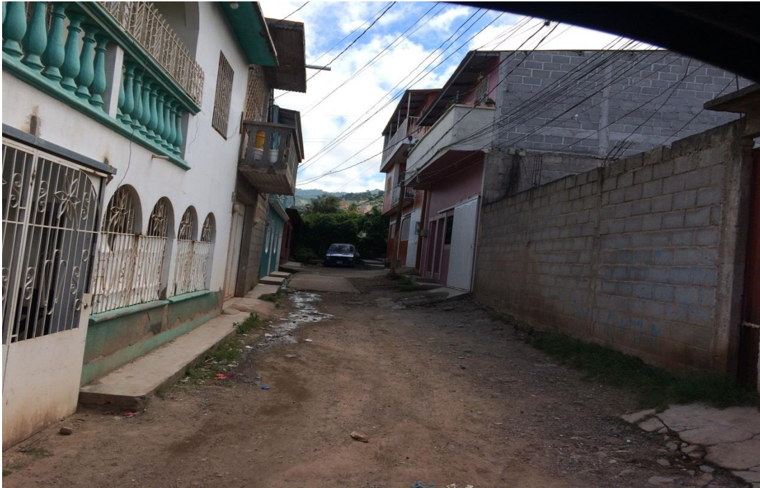
Vista de calle a pavimentar con concreto hidráulico