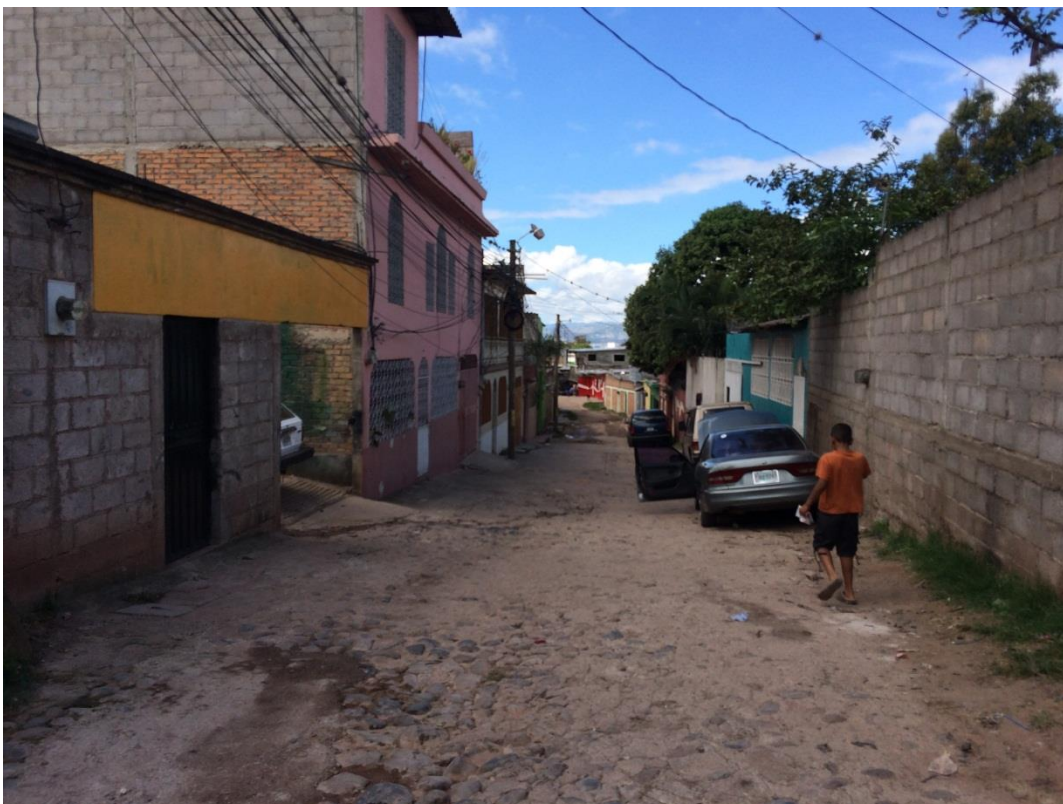
Panorama de calle a pavimentar con white topping