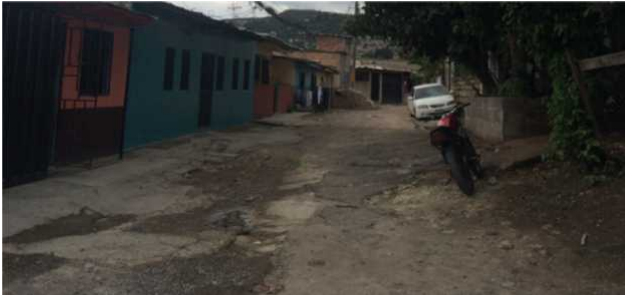
PANORAMICA DE CALLE A PAVIMENTAR