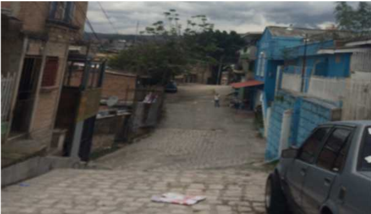
COLOCACION DE WHITE TOPPING