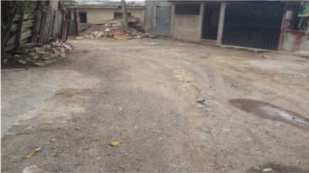
EXTREMOS FINALES DE CALLE A PAVIMENTAR