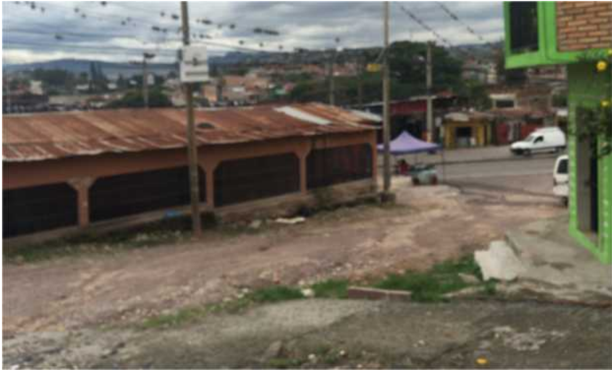
INICIO DE CALLE A PAVIMENTAR