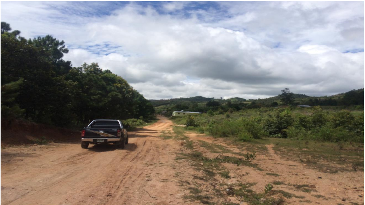
VISTA DE CALLE QUE REQUIERE BALASTADO