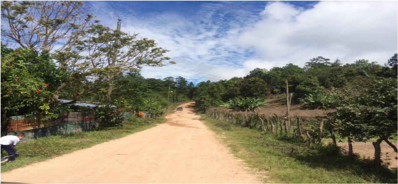
VISTA PANORÁMICA DE CALLE A REPARAR