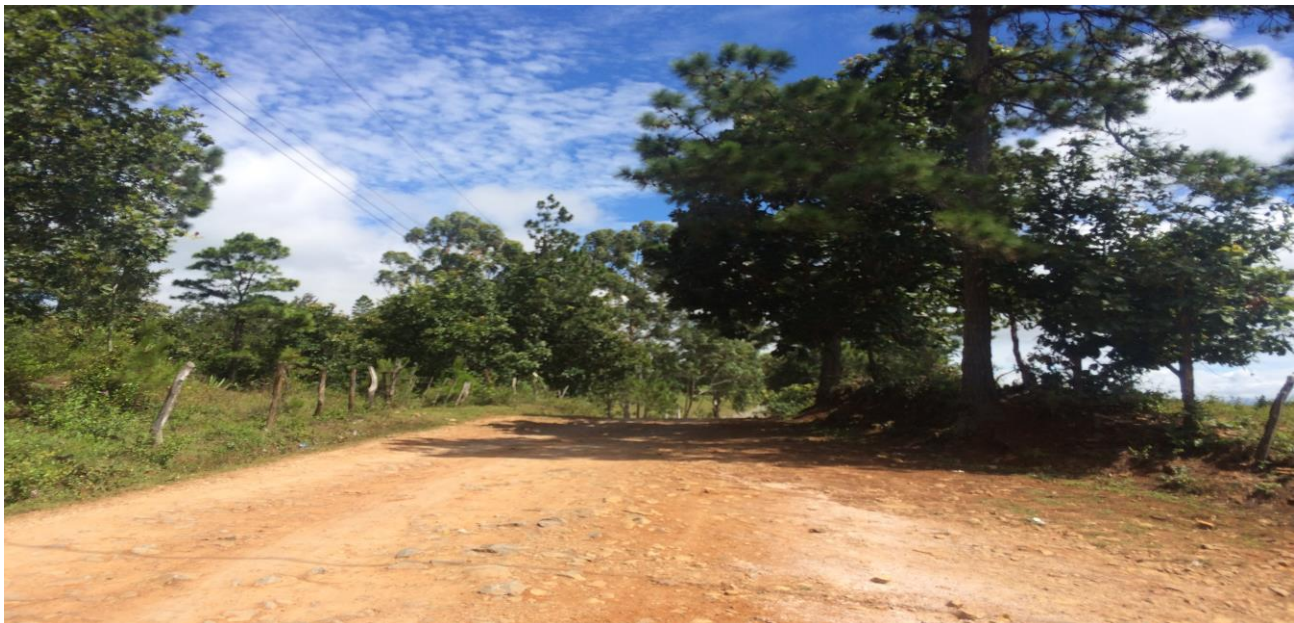
VISTA ACTUAL DE CALLE A REPARAR