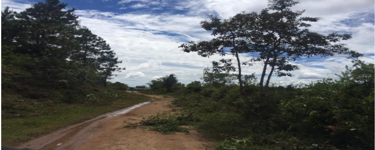
VISTA DE CALLE A REPARAR