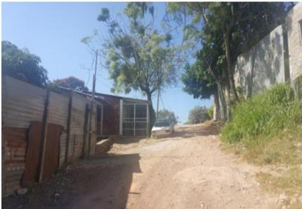
Panorama de calle a pavimentar con concreto hidráulico