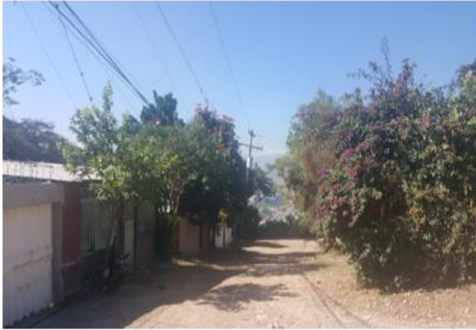
Vista de calle a pavimentar con concreto hidráulico