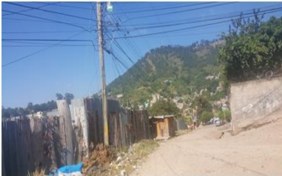
Final de calle a pavimentar con concreto hidráulico