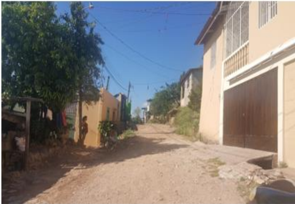
Inicio de calle a pavimentar con concreto hidráulico

Proyecto: Pavimentación de calle con concreto hidráulico, col. Suazo Cordova Código: 1444