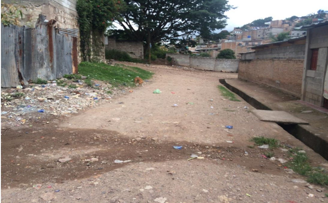
Vista de calle