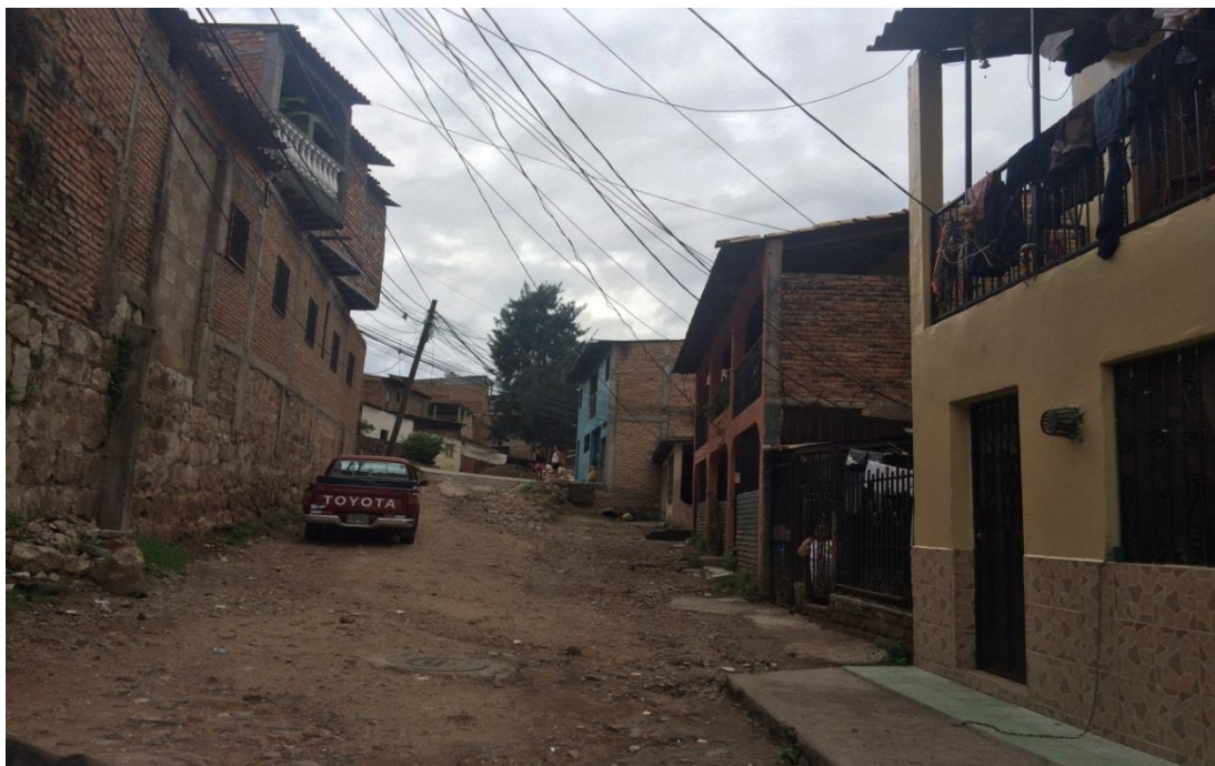
FINAL DE CALLE A PAVIMENTAR