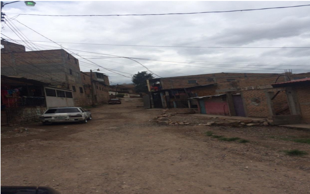
VISTA PANORAMICA DE CALLE A PAVIMENTAR