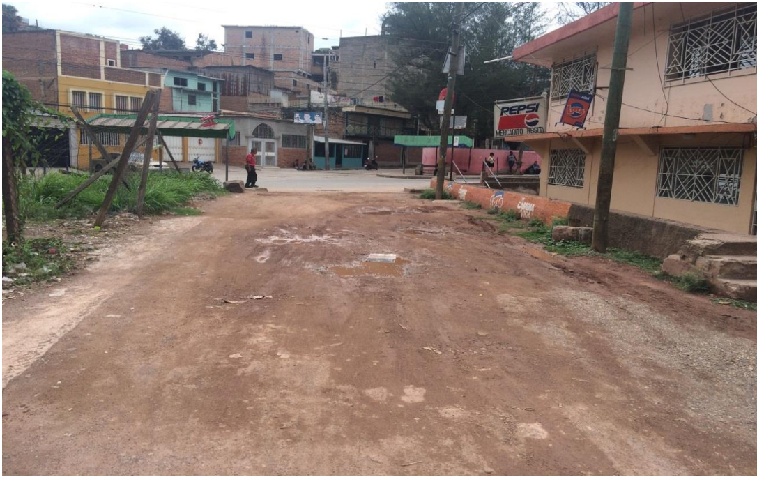
INICIO DE PAVIMENTACION DE CALLE