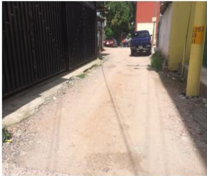
PANORÁMA DE CALLE EN QUE SE PAVIMENTARÁ CON CONCRETO HIDRÁULICO EN COL. HATO DE ENMEDIO.

Proyecto: Pavimentación de calle con concreto hidráulico, col. Hato de Enmedio - col. Villanueva Código: 1442