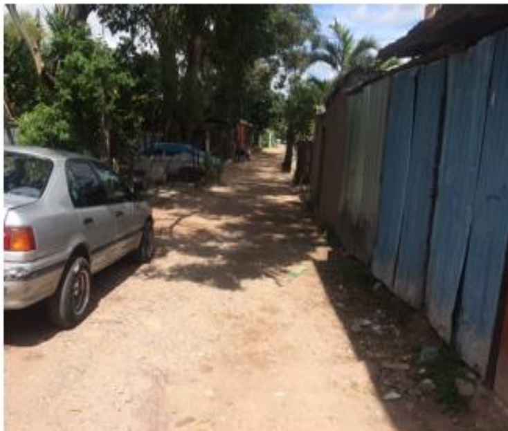
VISTA DE CALLE EN QUE SE PAVIMENTARÁ CON CONCRETO HIDRAULICO EN COL HATO DE ENMEDIO.