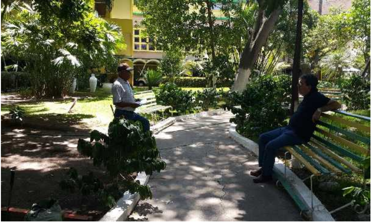
PARTE DE LOS BORDILLOS Y CONCRETO QUE SE DEMOLERA