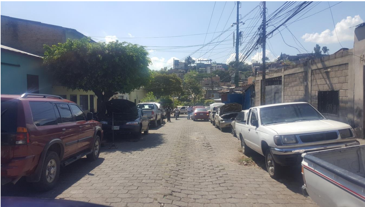
Inicio de calle a pavimentar