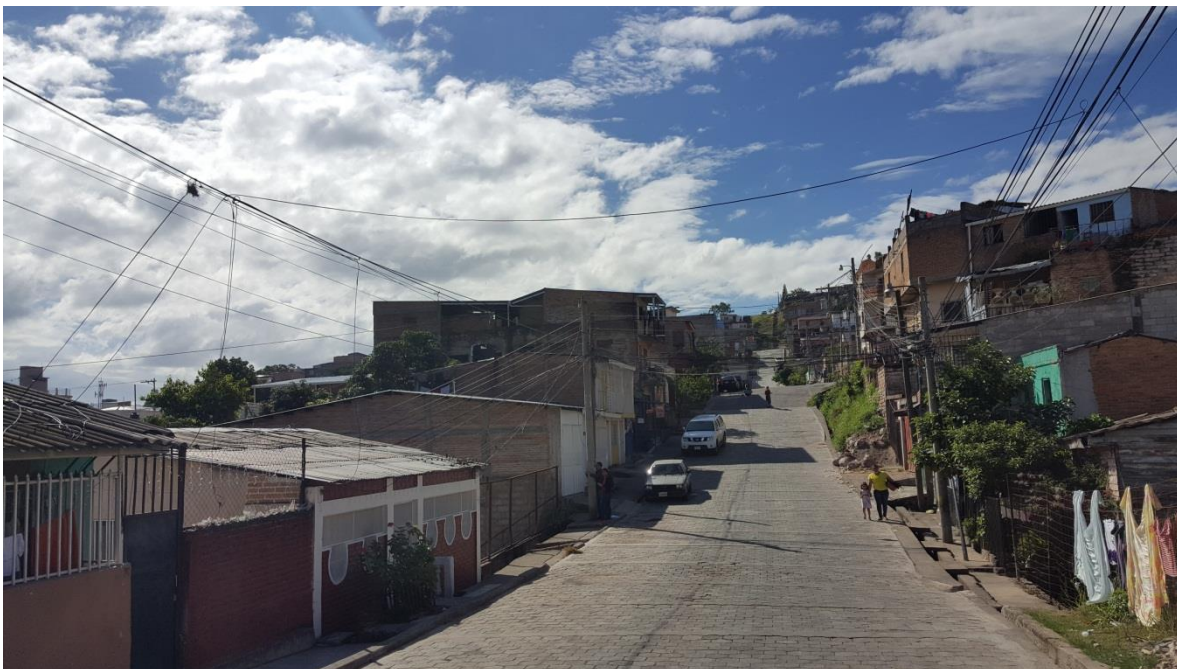
Vista donde se hará el desmontaje de adoquin