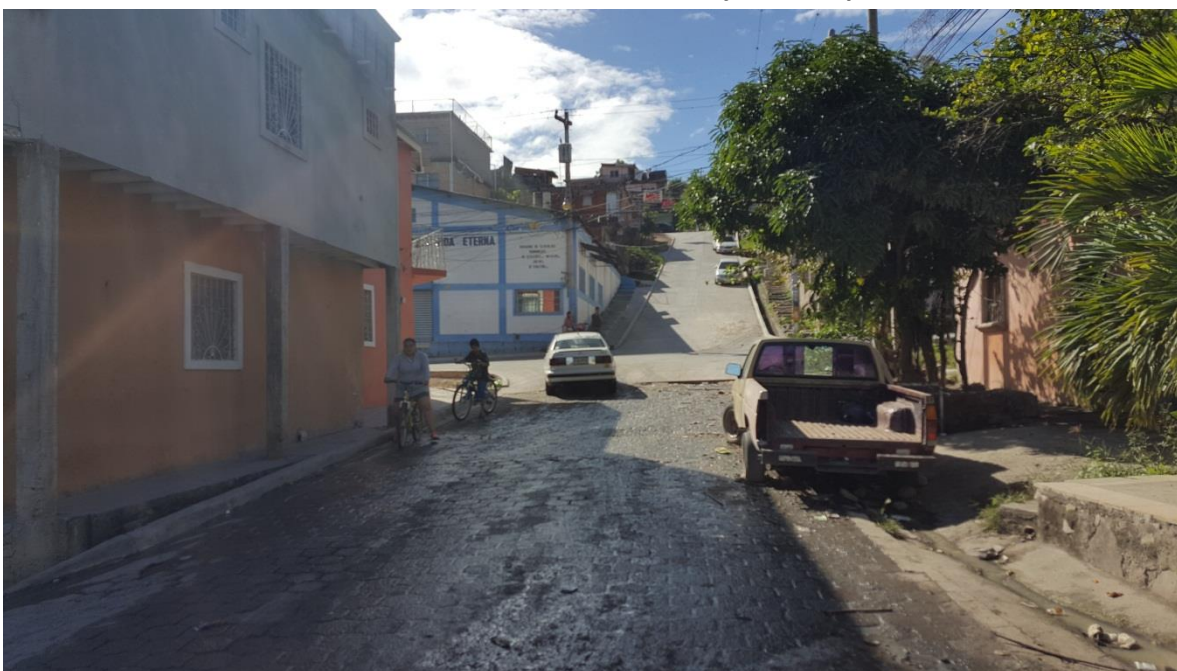
Final de calle a pavimentar