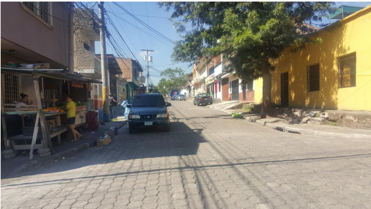
Panorama de calle a pavimentar