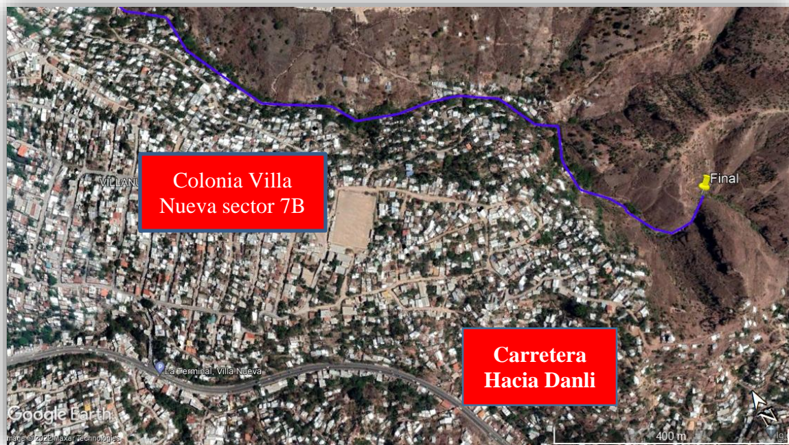
Imagen satelital del tramo final del cauce a la altura de la colonia Villa Nueva Sector 7B

Imagen satelital del cauce a la altura de la colonia Hato de En medio Sector 10