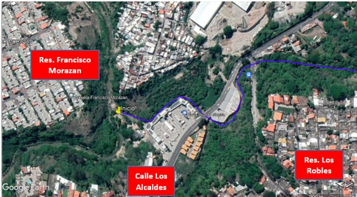
Imagen satelital del Inicio del Proyecto a la Altura de la residencial Francisco Morazán