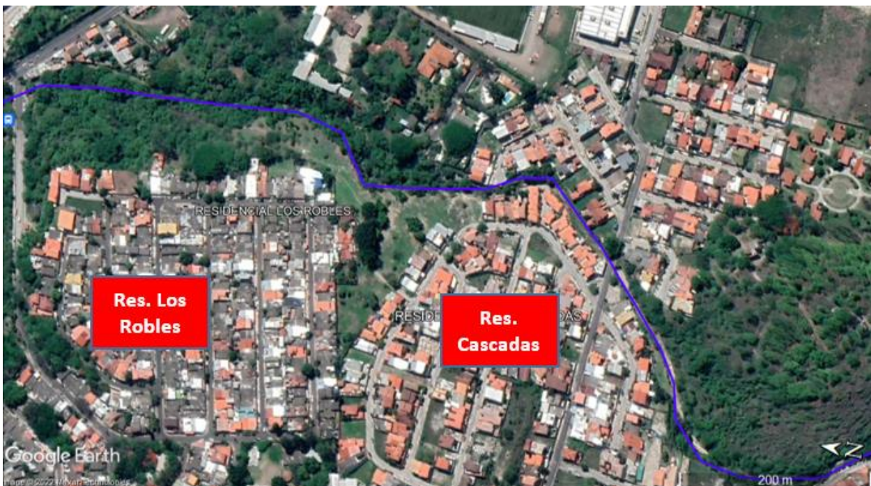
Imagen satelital del cauce a la altura de la residencial Los Robles y Cascadas