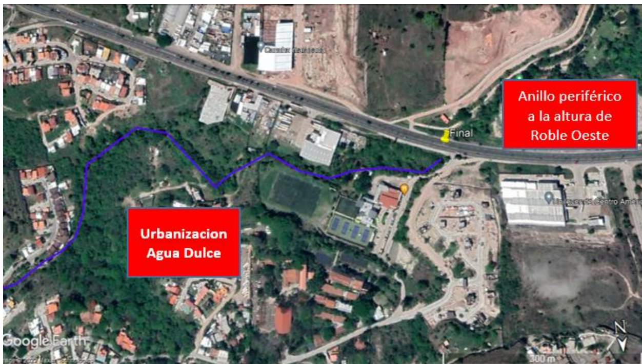
Imagen satelital del tramo final a la altura de la urbanización Agua Dulce y Anillo Periférico