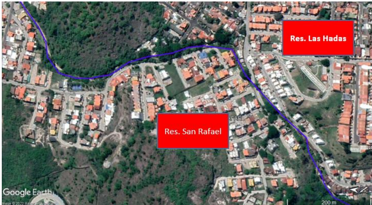
Imagen satelital del cauce a la altura de las residenciales San Rafael y Las Hadas