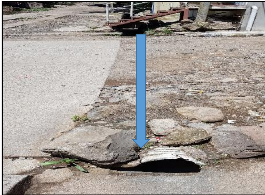
Ilustración 10. Tramo 2 – F; Ubicación de Quiebrapatas propuesta.