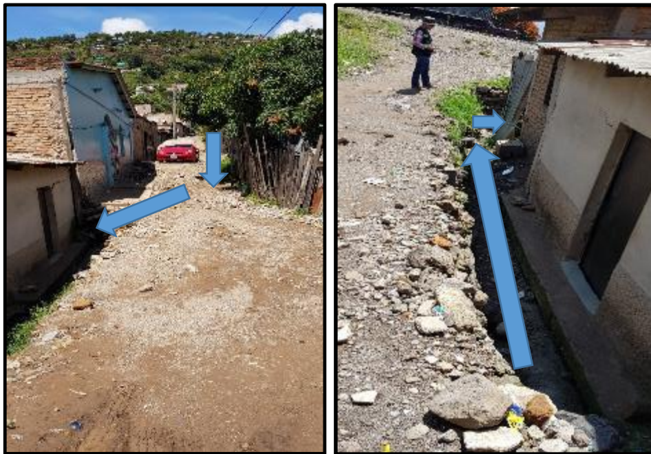
Ilustración 1. Tramo J – K; Ubicación de Cuneta a Construir (Sección 0.30m x 0.30m).