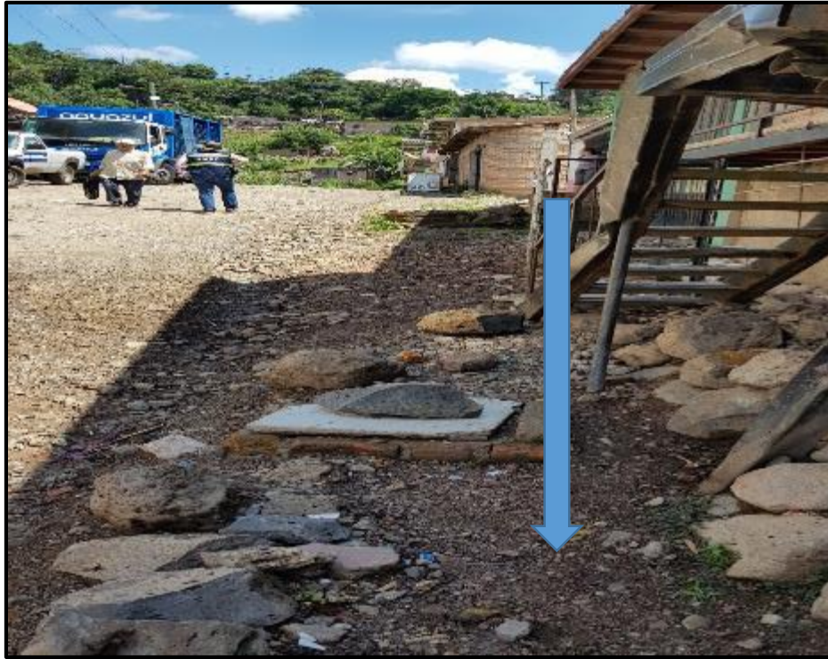
Ilustración 9. Tramo E – G, Ubicación de Cuneta a Construir (Sección 0.30m x 0.40m)