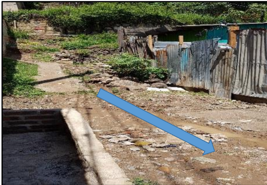
Ilustración 4. Tramo C-D, Ubicación de Cuneta de mampostería de 0.30m x 0.40m y losa de acceso.