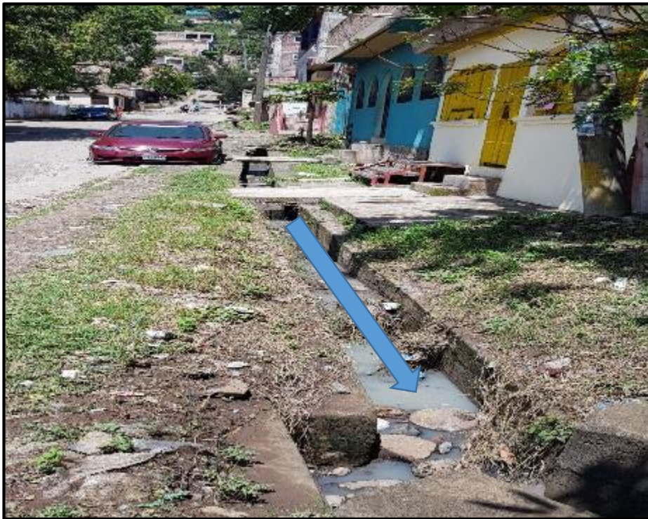
Ilustración 7. Tramo 2 - 3 Ubicación de Cuneta existente y losa de concreto a construir.