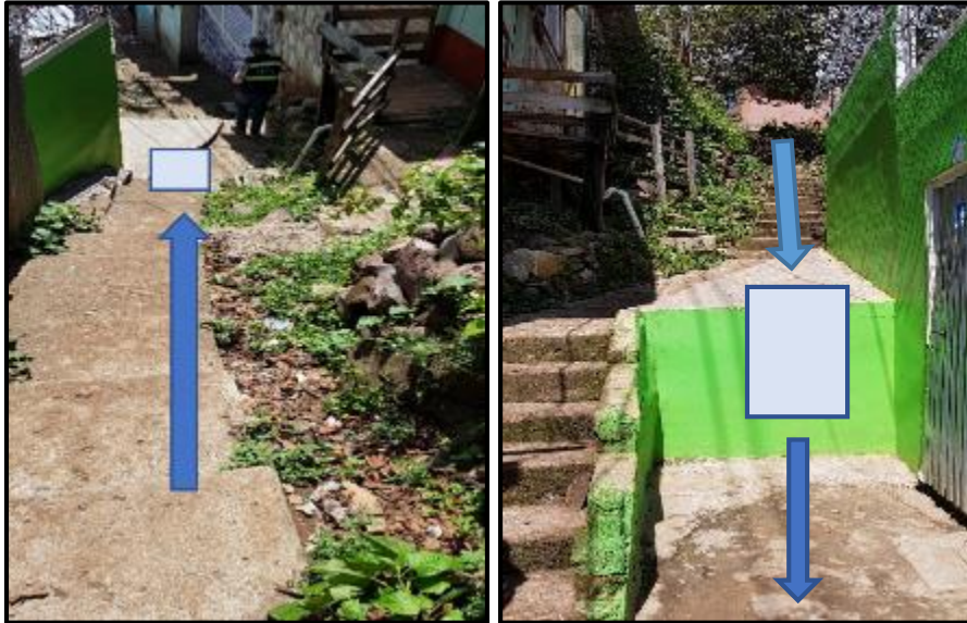
Ilustración 3. Tramo A'- A' Ubicación de Cuneta de Concreto Reforzado de 0.30m x 0.30m y caja recolectora y losa de concreto.