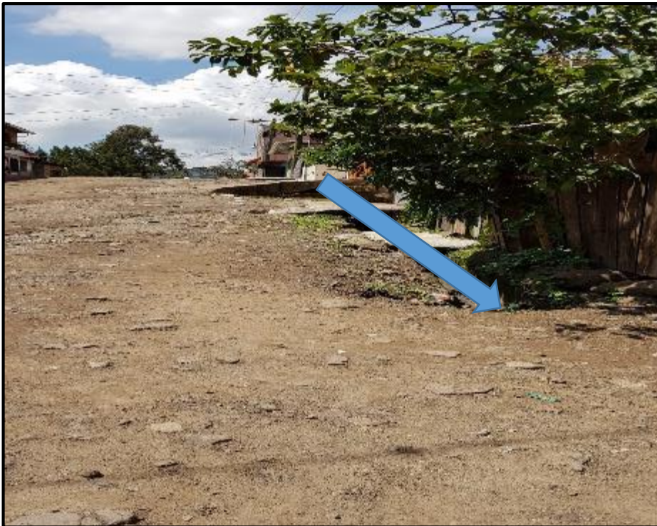
Ilustración 6. Tramo 2 - 4 Ubicación de Cuneta existente y losa de concreto a construir.