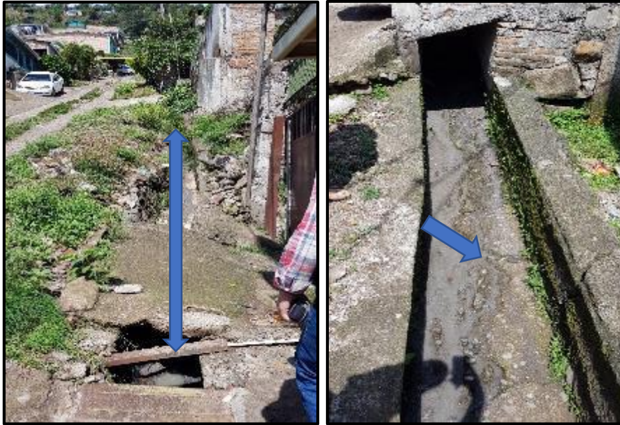
Ilustración 1. Tramo 1-2. Cuneta y losas de acceso de acceso a las viviendas existentes.

A continuación, se presentan imágenes de los sitios, donde se construirán las medidas de mitigación en el Sector 4 de la Colonia Jose Angel Ulloa, en estas pretenden además de mostrar el lugar, referenciar el tipo de medida con el que se pretende intervenir.