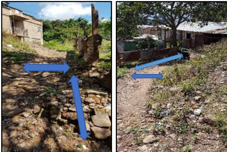
Ilustración 2. Tramo de Cuneta A - A', ubicación de cuneta de concreto reforzado de 0.30m x 0.30m de propuesta.