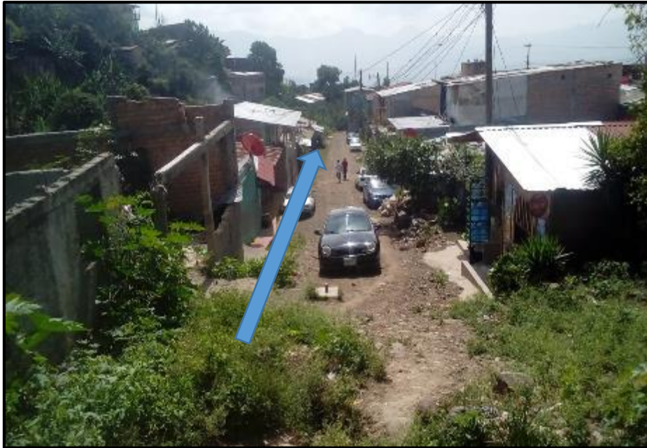
Ilustración 5. Tramo 4-5 Ubicación de Cuneta existente y losa de concreto a construir.