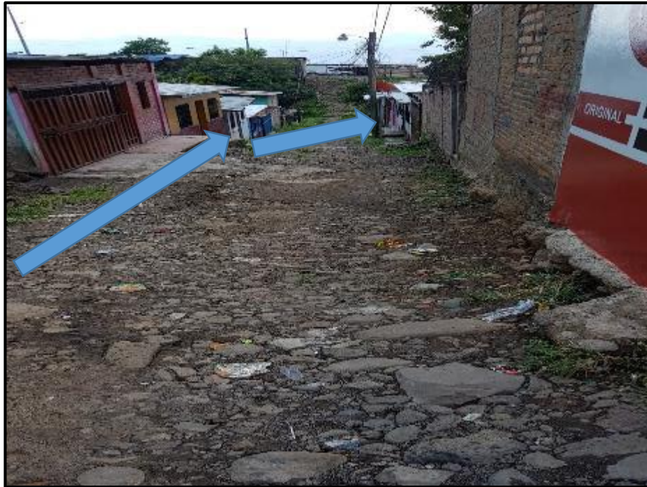
Ilustración 11. Tramo H – I; Ubicación de Cuneta a Construir (Sección 0.30m x 0.30m).