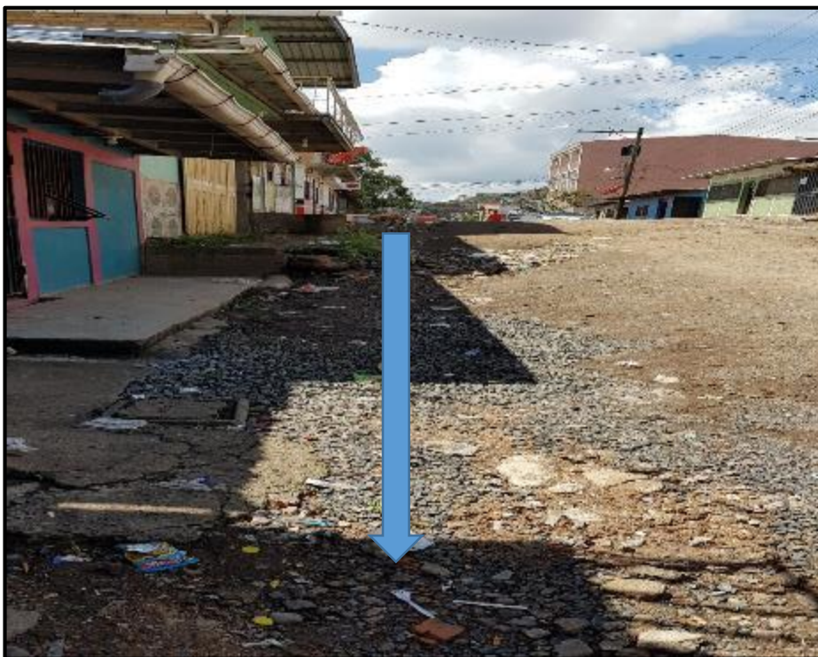
Ilustración 8 Tramo E - G Ubicación de Cuneta a Construir