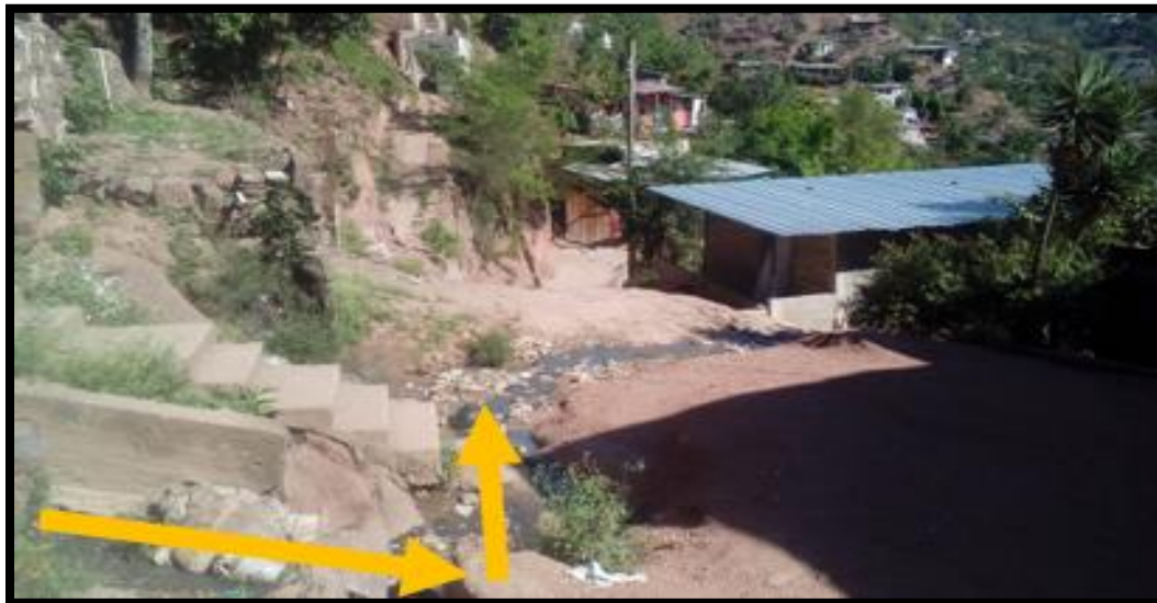
Ilustración 2 Sentido de la circulación del agua por las calles, tramo de cuneta a construir nodo A-C y C-E (ver plano planta-conjunto)