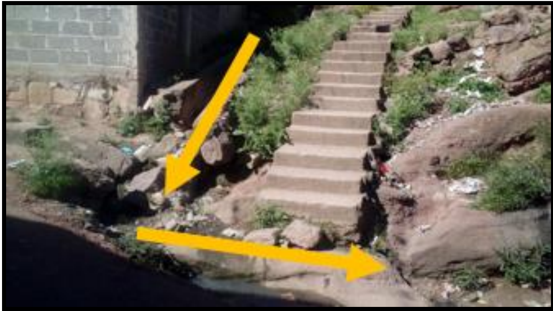
Ilustración 3 Cunetas existentes en mal estado, tramo a reconstruir nodo A-C (ver plano planta-conjunto)