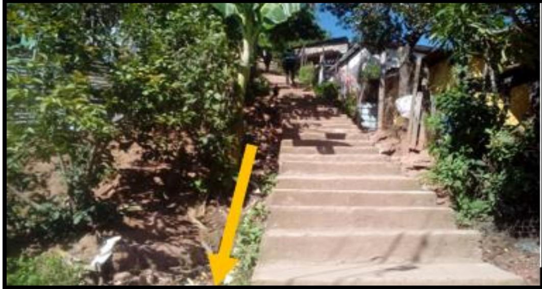
Ilustración 1 Callejón de gradas cercanas al sitio del proyecto, que no poseen drenajes laterales de tal manera que el agua corre sin control en época lluviosa, tramo de cuneta nodo B-E (ver plano planta-conjunto)

KFW-002: Obras para el Control integrado de Flujos y Escorrentías Superficiales, en el Sector 7B de Colonia Villa Nueva, Tegucigalpa, M.D.C.