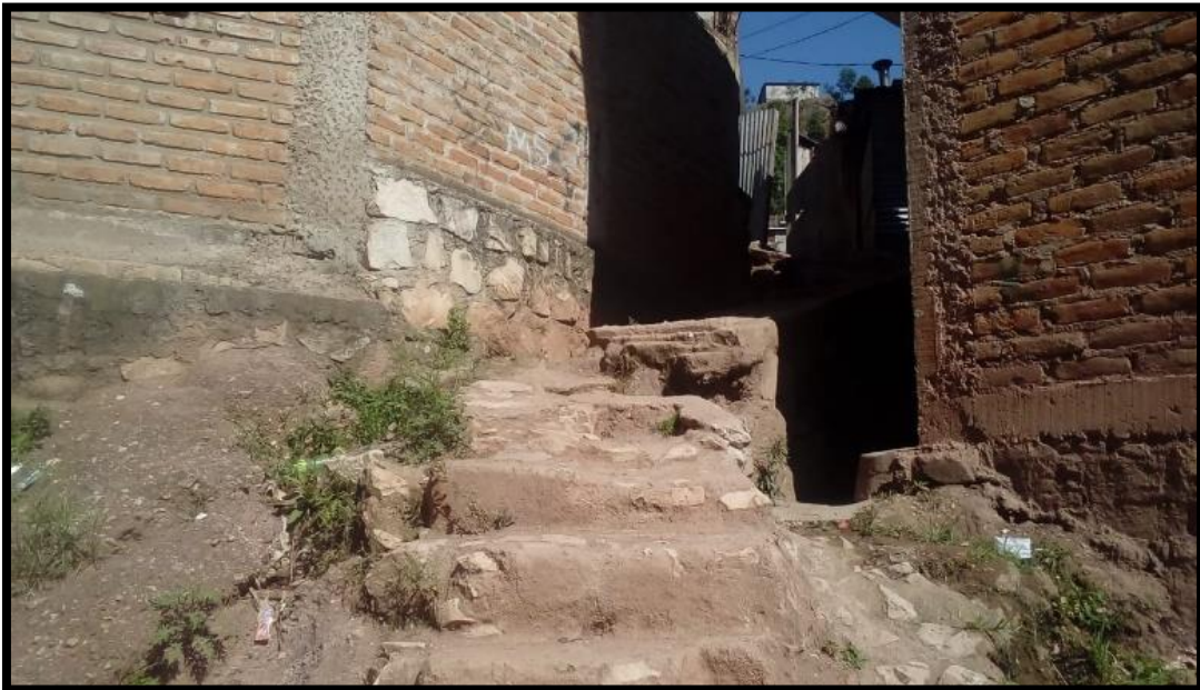
Ilustración 4 Fotografía que muestra el mal estado de los accesos a las viviendas. Estas áreas de paso y tránsito peatonal pueden rehabilitarse para que funcionen además como rutas de evacuación.