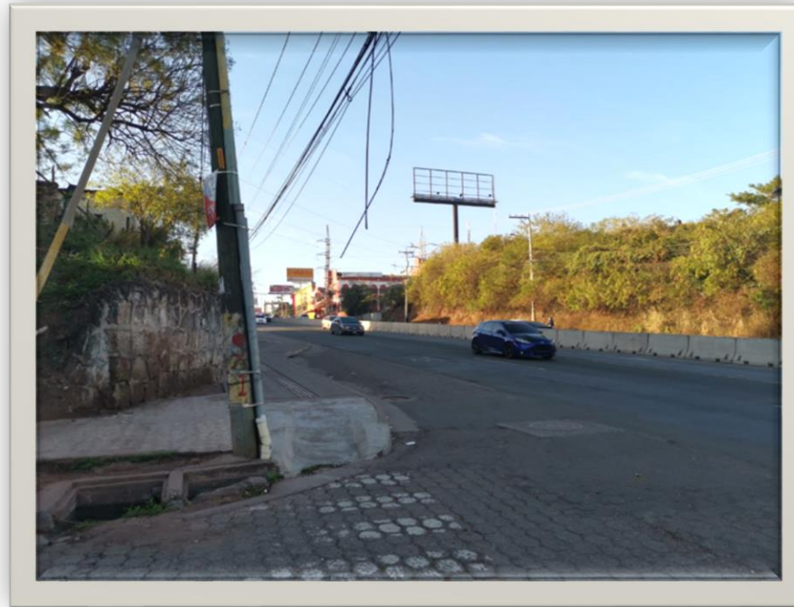
Vista Bulevar Centroamérica desde la entrada de la San Ángel