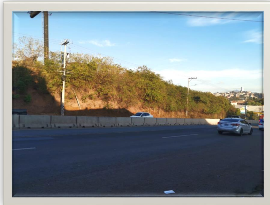
Vista Bulevar Centroamérica desde la entrada de la San Ángel