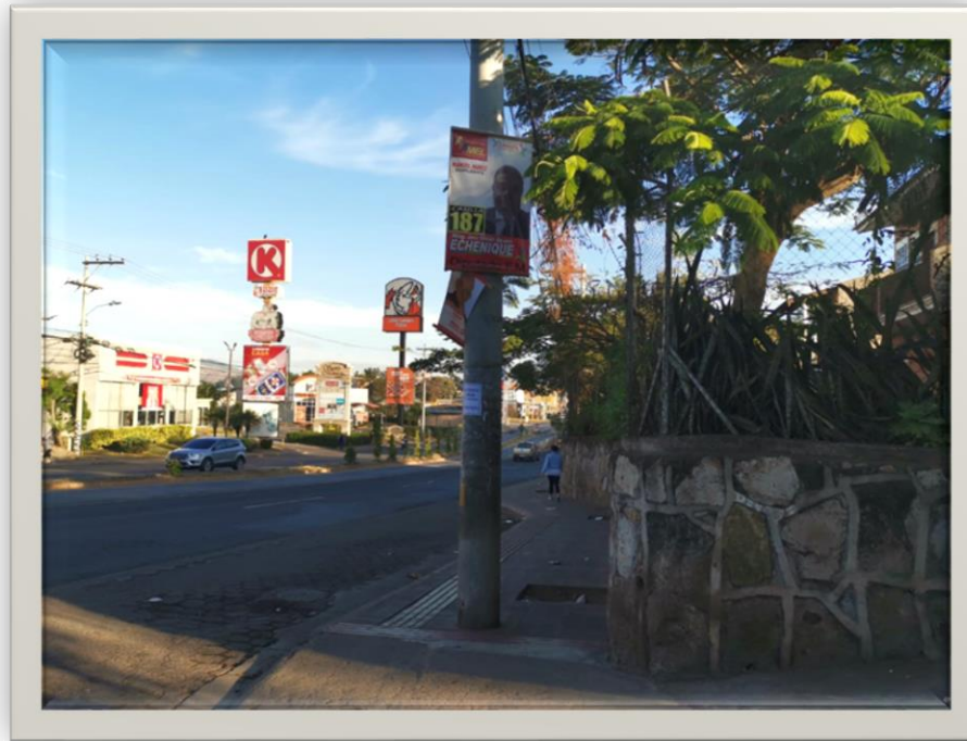
Vista Bulevar Centroamérica desde la entrada de la San Ángel