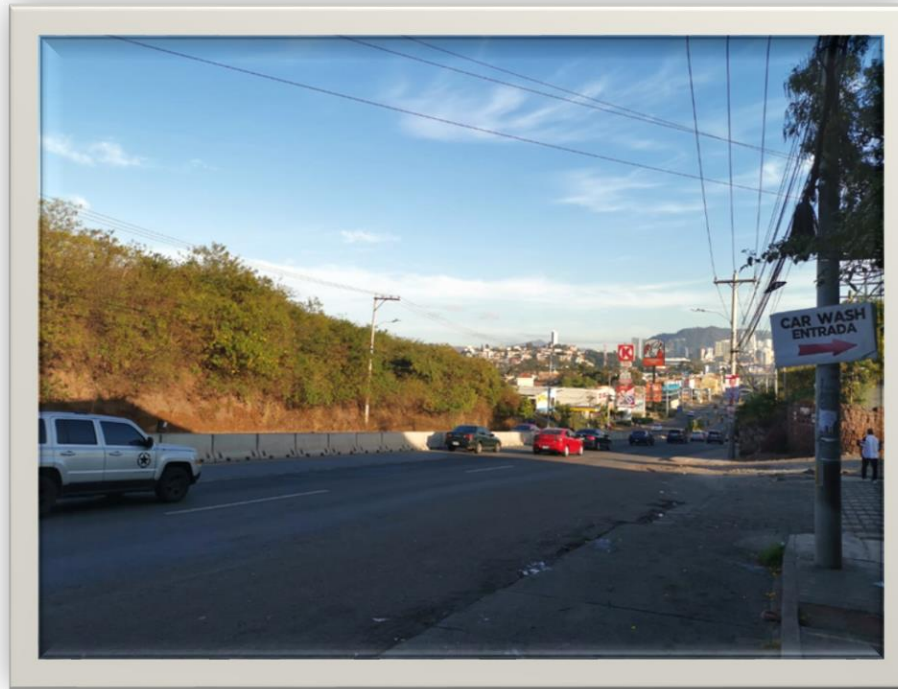
Vista Bulevar Centroamérica desde Mercado Jacaleapa