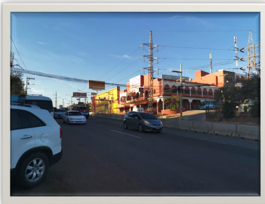
Vista Bulevar Centroamérica desde Mercado Jacaleapa