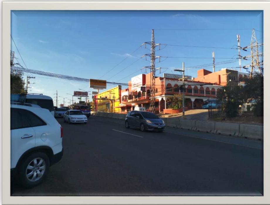
Vista Bulevar Centroamérica desde Mercado Jacaleapa