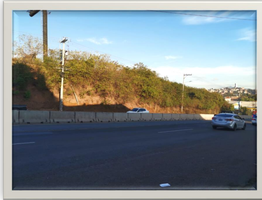
Vista Bulevar Centroamérica desde la entrada de la San Ángel