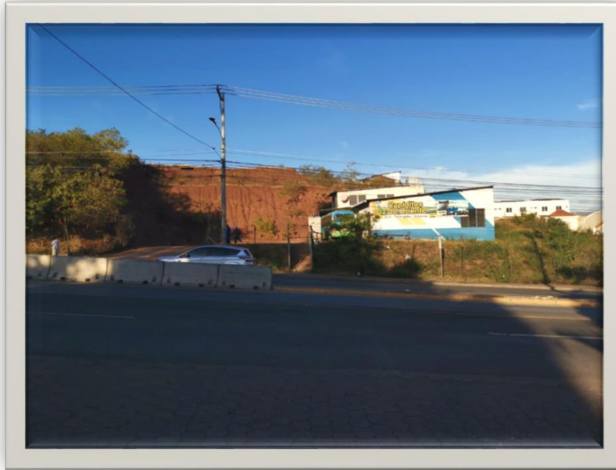
Vista Bulevar Centroamérica frente a la entrada de la San Ángel