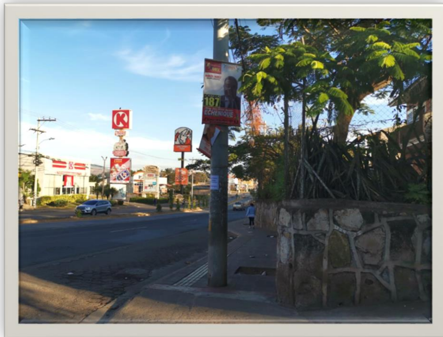
Vista Bulevar Centroamérica desde la entrada de la San Ángel