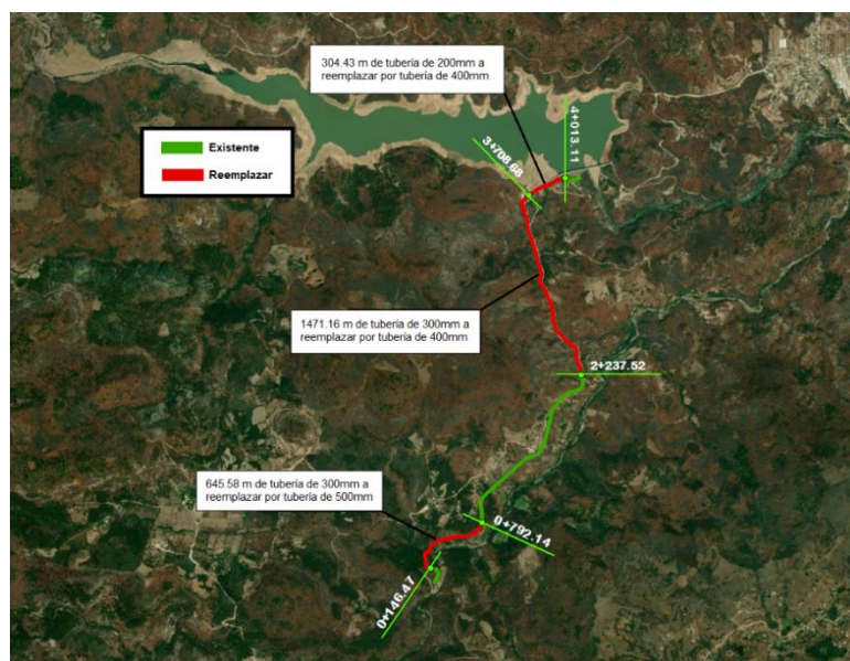
Esquema de Reemplazo de tubería

Adicionalmente para el sistema de conducción se ha definido la instalación de distintos tipos de válvulas. La ubicación de estos elementos es esencial para el correcto funcionamiento del sistema. Las válvulas de aire irán ubicadas en los puntos altos donde ocurran cambios bruscos de pendiente. Las válvulas de desagüe irán ubicadas en los puntos bajos de la línea de conducción y servirán para eliminar de la tubería el agua en caso de ser necesario su vaciado.