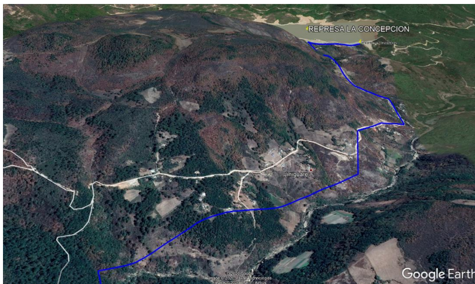
En la imagen se muestra el esquema de la línea de conducción existente de Jiniguaré al Embalse La Concepción