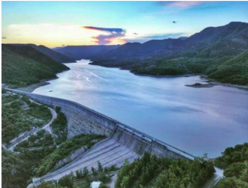
En la imagen se muestra el Embalse ing. Rigoberto Cerna David “La Concepción”