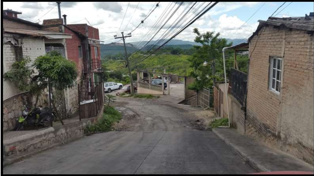
Tramo Lomas del Sur – Colonia Reynel Fúnez, Zona #1.