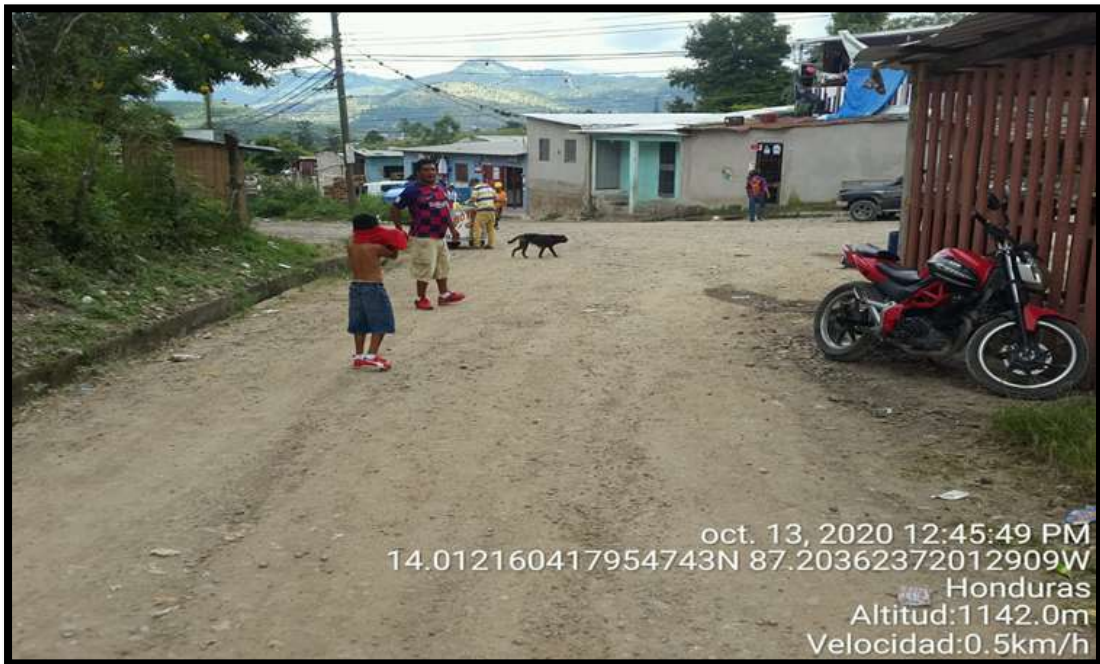
Tramo de zona #2 y #3 Colonia Reynel Fúnez