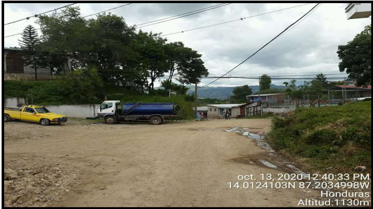
Tramo de zona #2 y #3 Colonia Reynel Fúnez