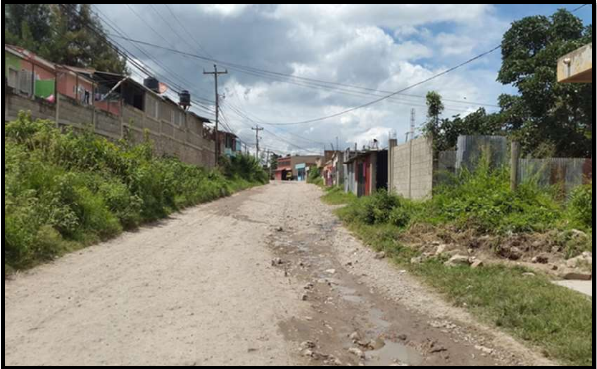
Tramo Lomas del Sur – Colonia Reynel Fúnez, Zona #1.