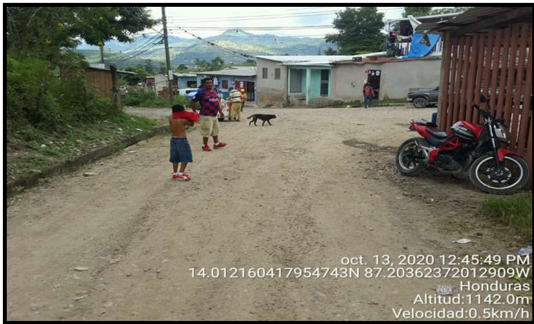
Tramo de zona #2 y #3 Colonia Reynel Fúnez