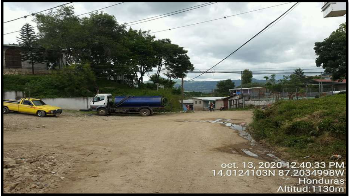
Tramo de zona #2 y #3 Colonia Reynel Fúnez