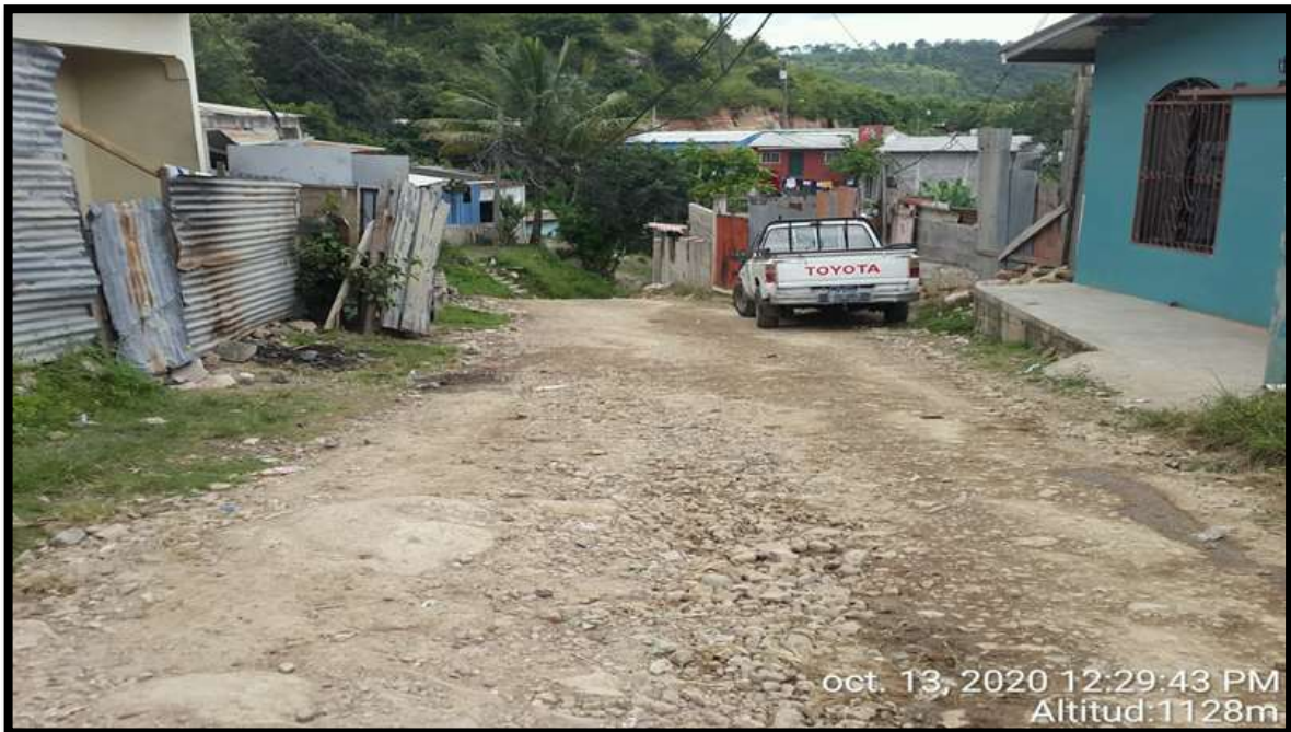
Tramo de zona #2 y #3 Colonia Reynel Fúnez