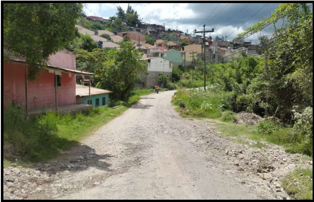
Tramo Lomas del Sur – Colonia Reynel Fúnez, Zona #1.