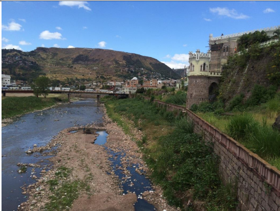
Vista panorámica de Puente Soberanía y Antigua Casa Presidencial