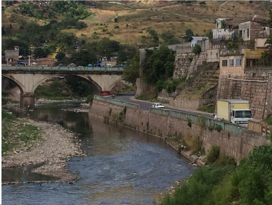
Vista de Puente Carías y Paseo Marco Aurelio Soto