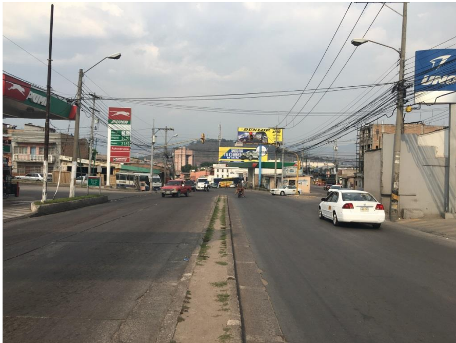
Vista Bulevar del Norte hacia 13 calle de Comayagüela