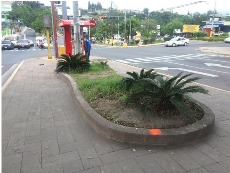
Vista actual de intersección Col. 21 de Octubre – Col. San Miguel