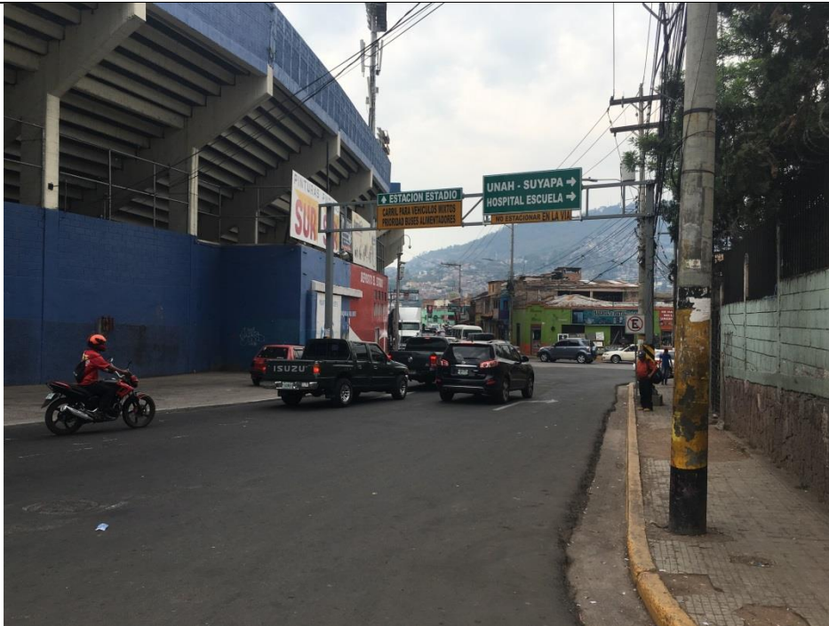
Vista de calle entre Estadio Nacional y bar La Huaca