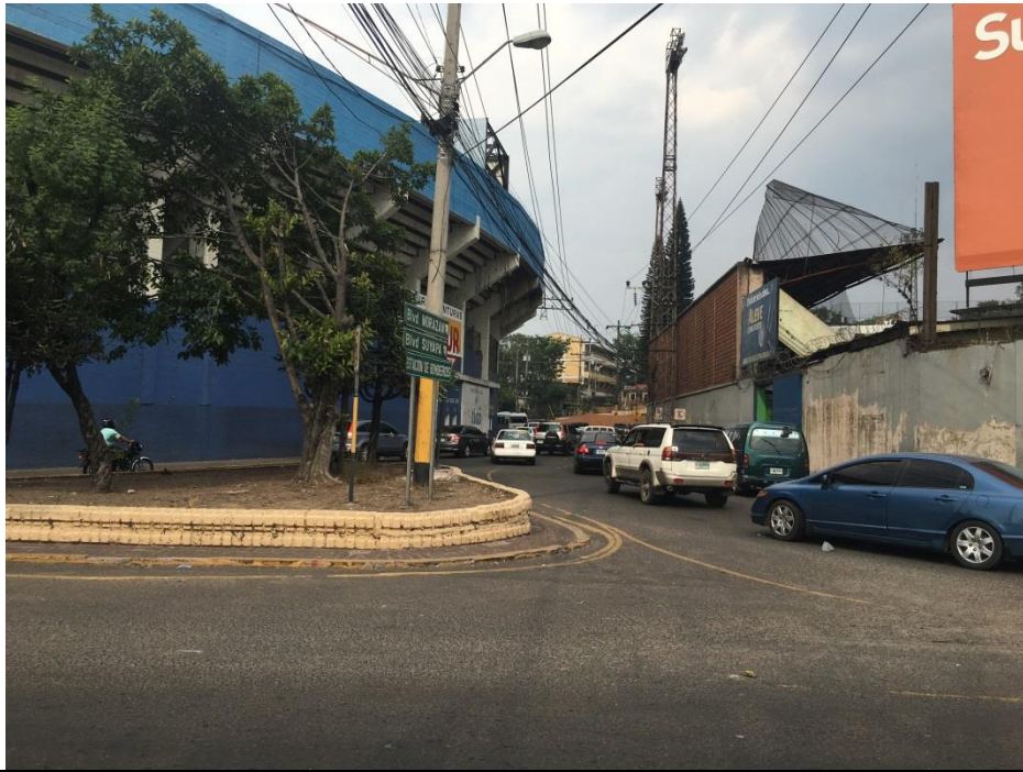
Vista de calle entre Estadio Nacional y Parque de Pelota Lempira Reina