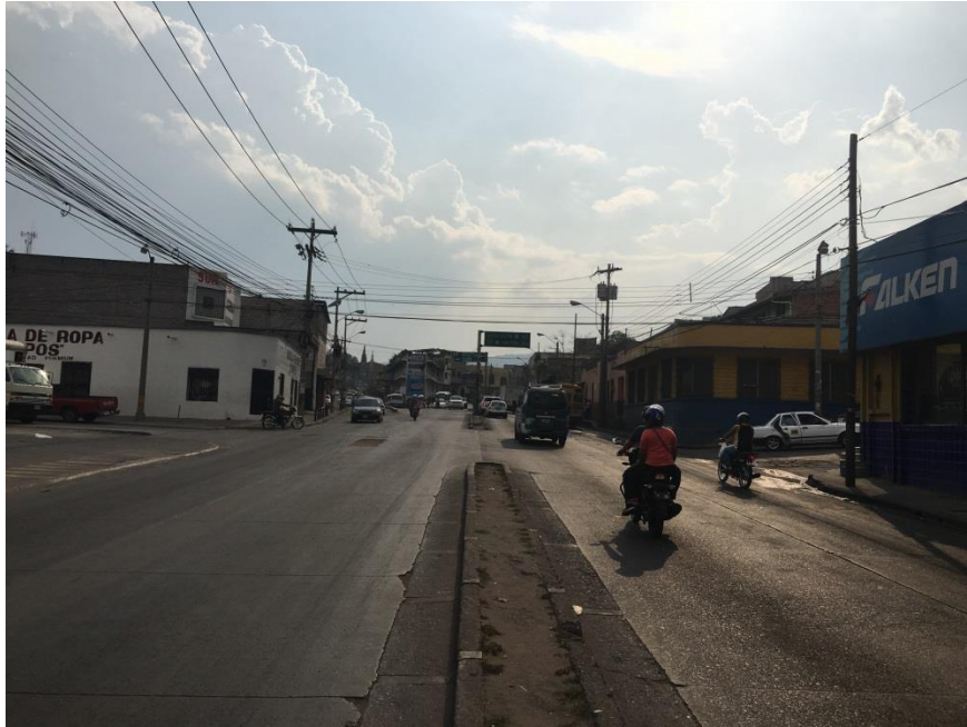
Vista actual del Bulevar del Norte hacia Calle Nixon