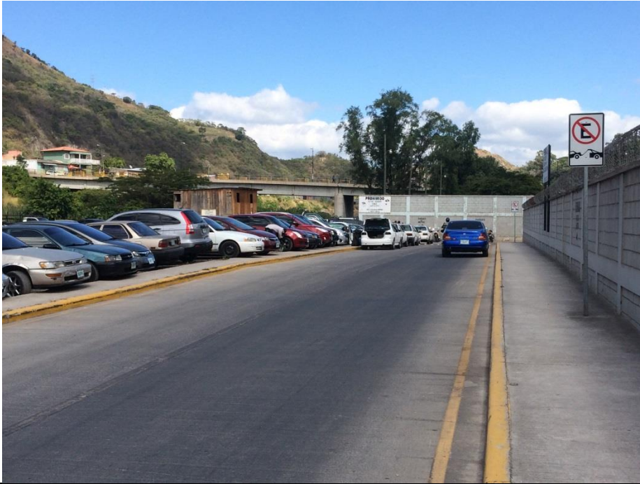
Vista de zona de intercambio de Puente El Chile