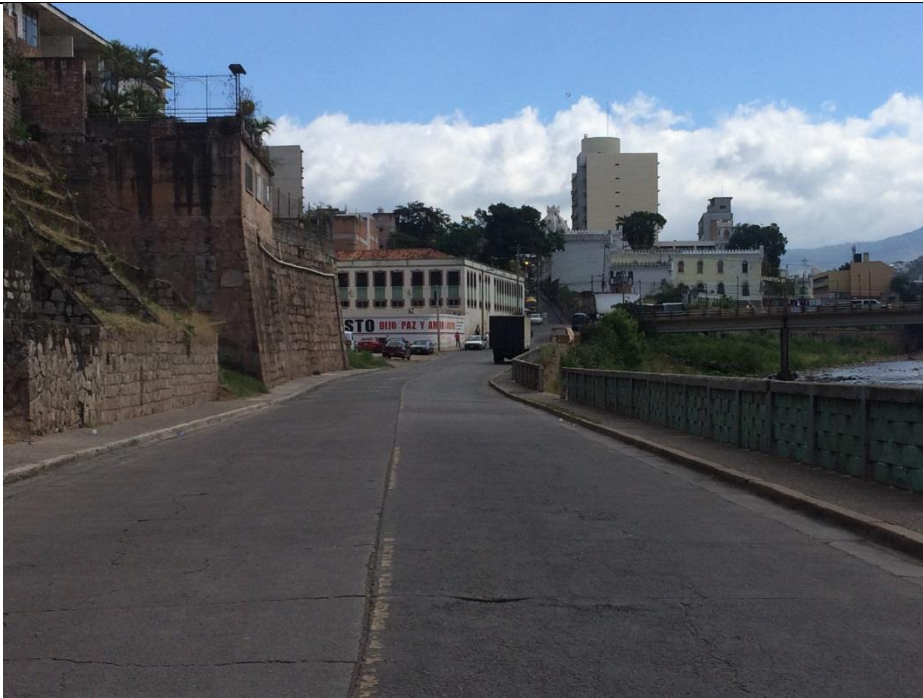
Vista actual de Paseo Marco Aurelio Soto