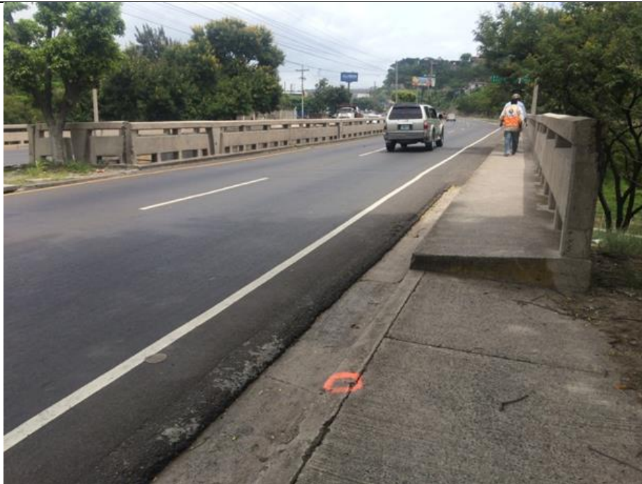
Vista de puente sobre Río Chiquito