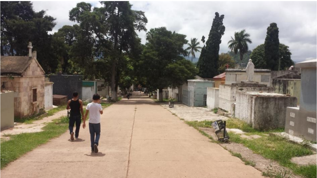
Vista Interior de Sepulcros, Cementerio General