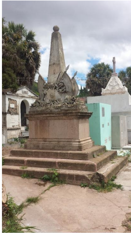
Vista de Acceso y Sepulcros existentes, Cementerio General