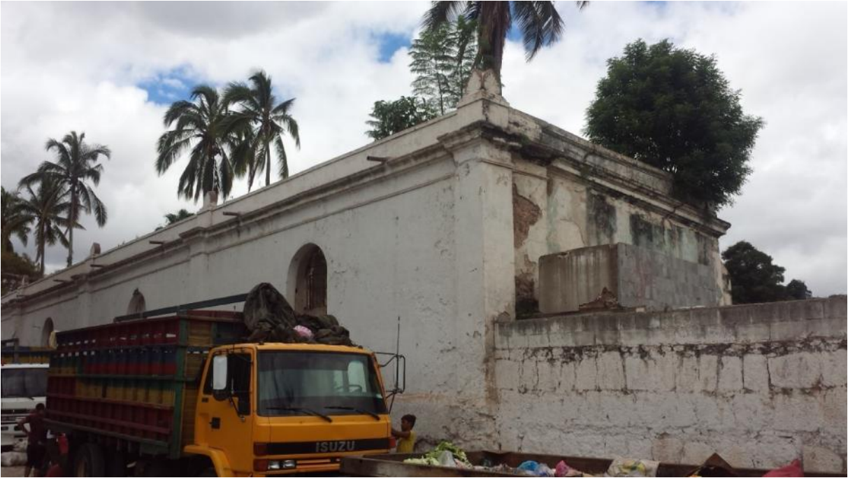
Vista Exterior del Cementerio General y Capilla