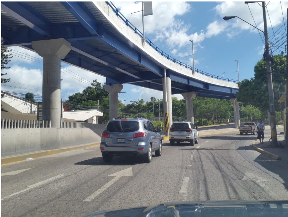
Bulevar Comunidad Económica Europea en dirección hacia Aeropuerto Toncontín