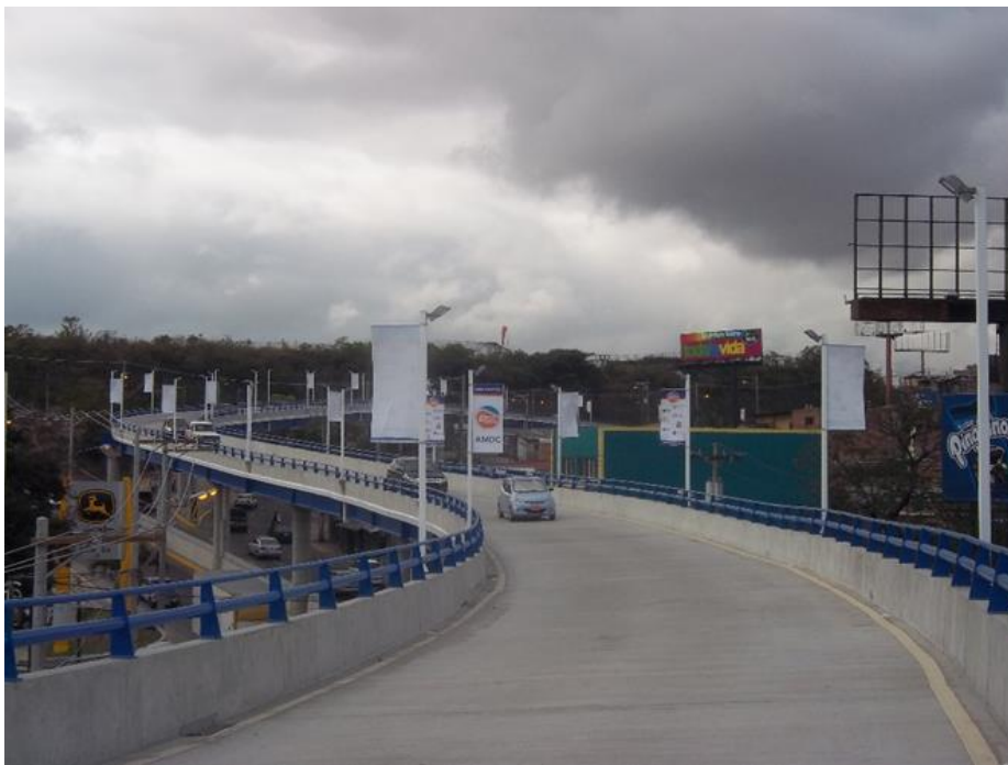
Vista actual de vía rápida aeropuerto a ser ampliada en lado derecho