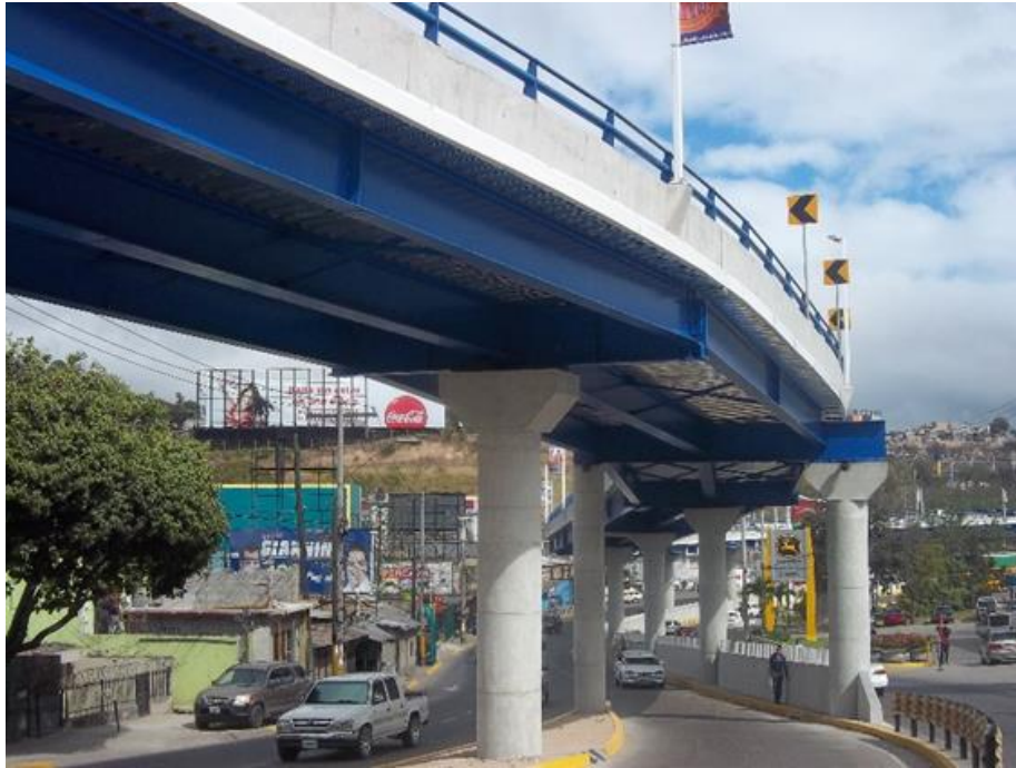
Vista actual de vía rápida aeropuerto a ser ampliada