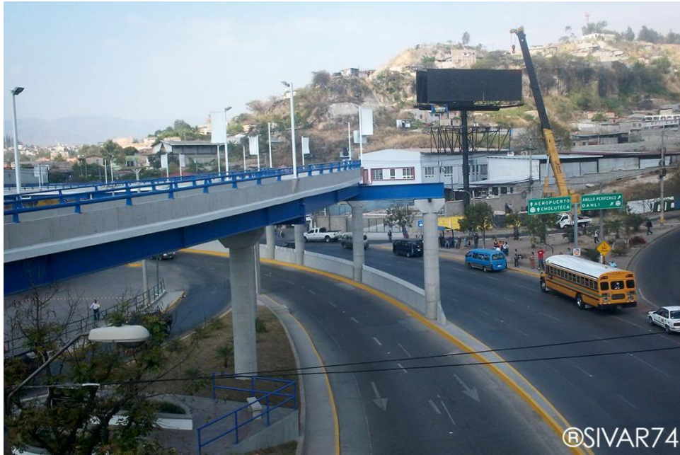
Vista de vía rápida y Bulevar Comunidad Económica Europea