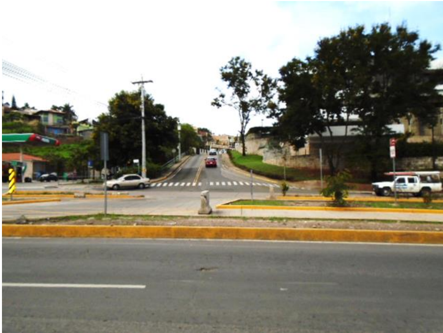
Vista de la intersección donde se construirá puente elevado