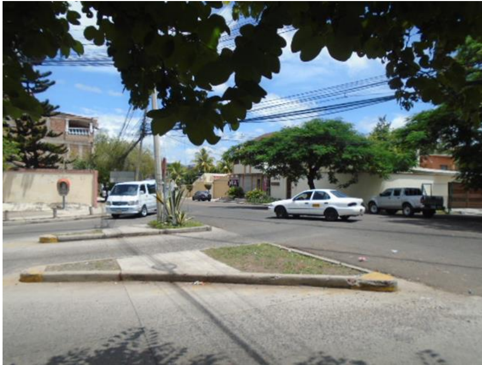
Intersección calle Col. El Dorado – Bulevar FFAA (Punto No.5)