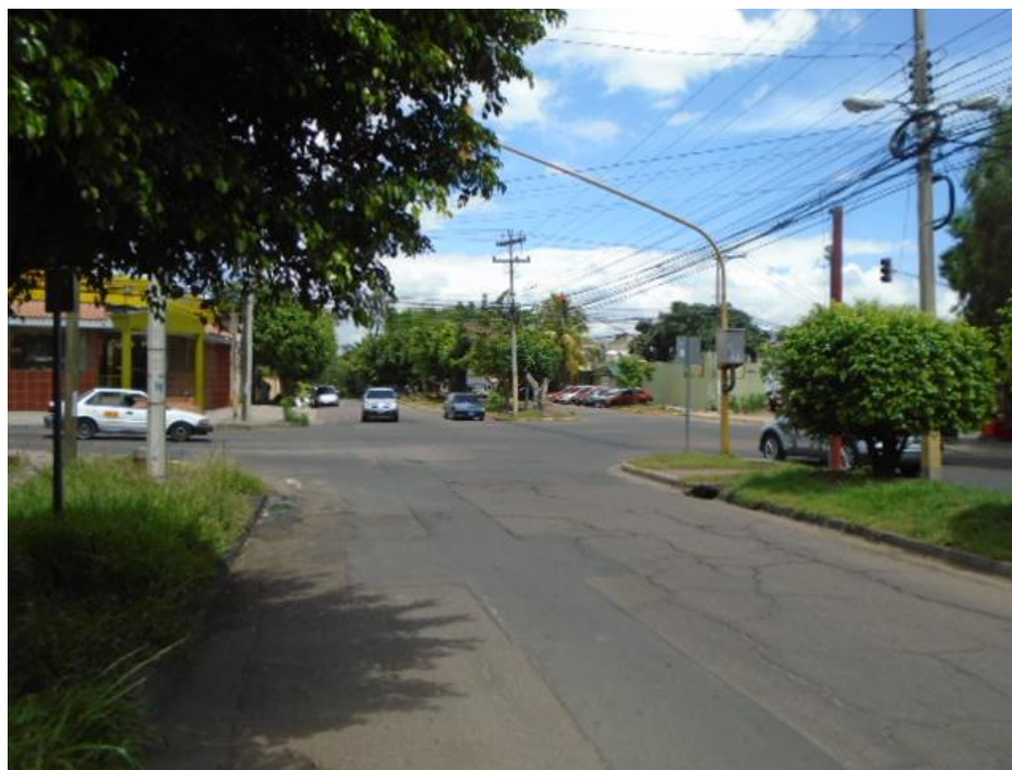
Intersección Bulevar Francia (Punto No.4)