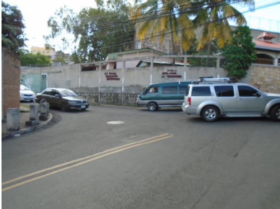
Intersección Col. Loma Linda – Col. Miramontes (Punto No.2)