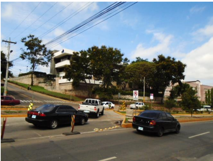
Giro a la izquierda sobre Bulevar Suyapa hacia col. Loma Linda Norte