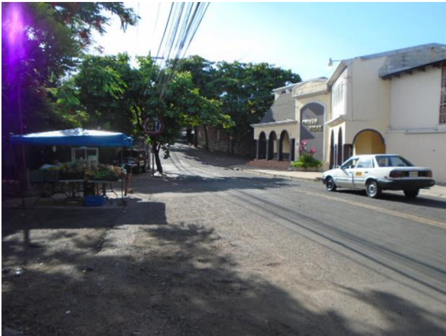
Intersección de calles Col. Loma Linda – Col. El Hogar (Punto No.3)