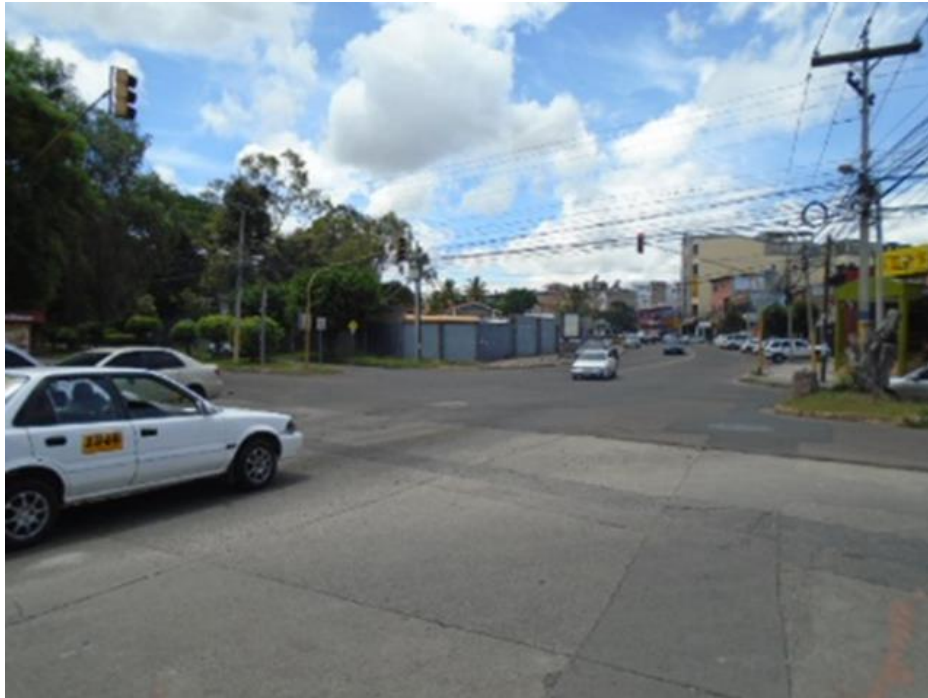
Intersección Bulevar Francia (Punto No.4)