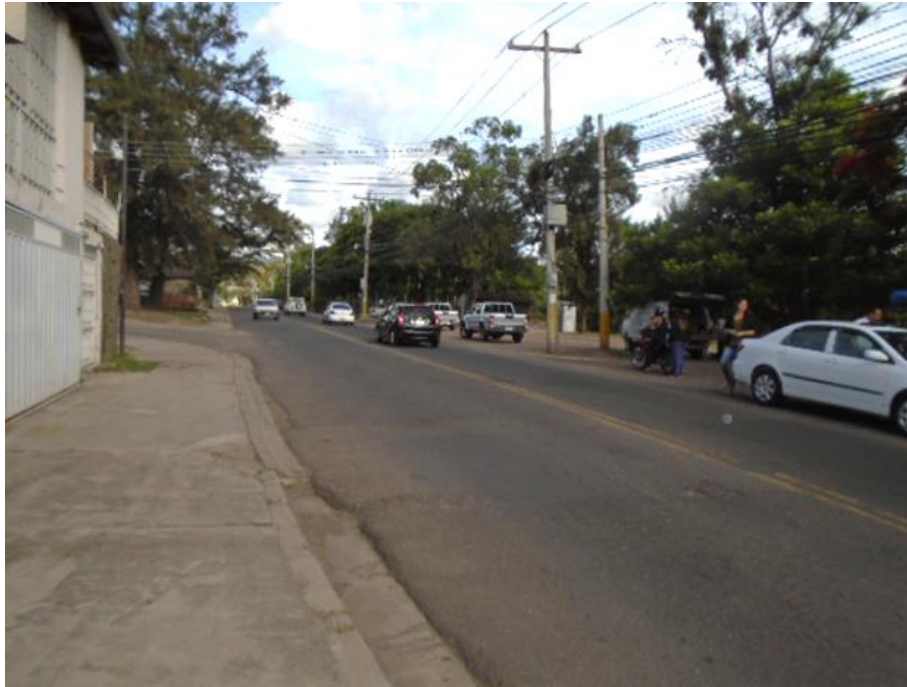
Calle principal Col. El Hogar (Punto No.3)