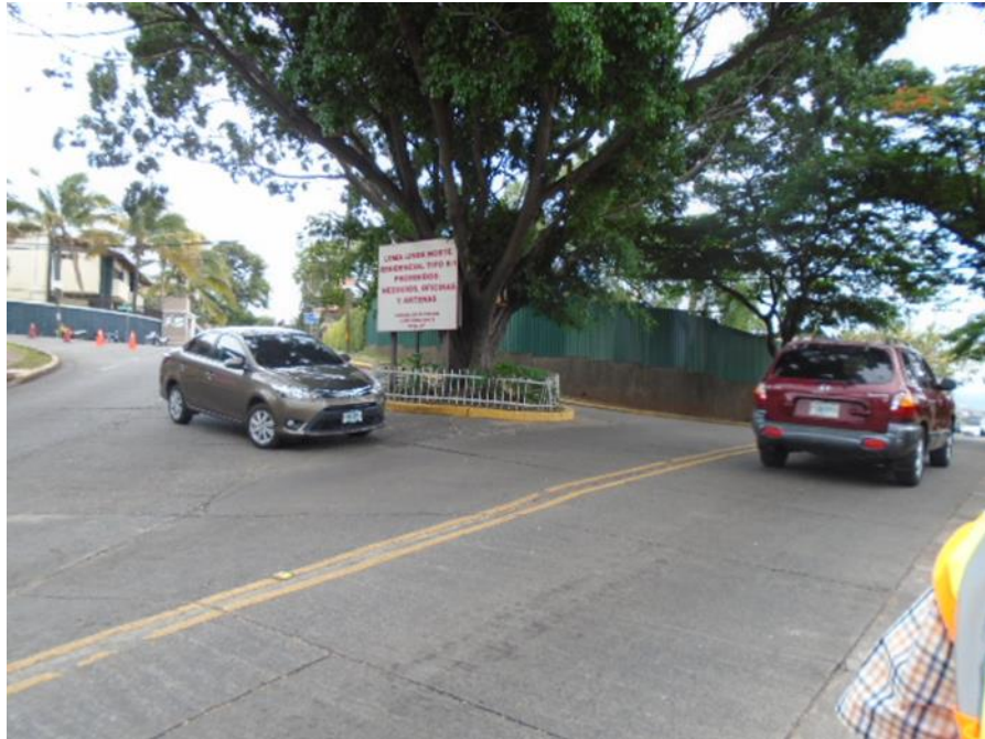
Rotonda existente Col. Loma Linda Norte (Punto No.1)