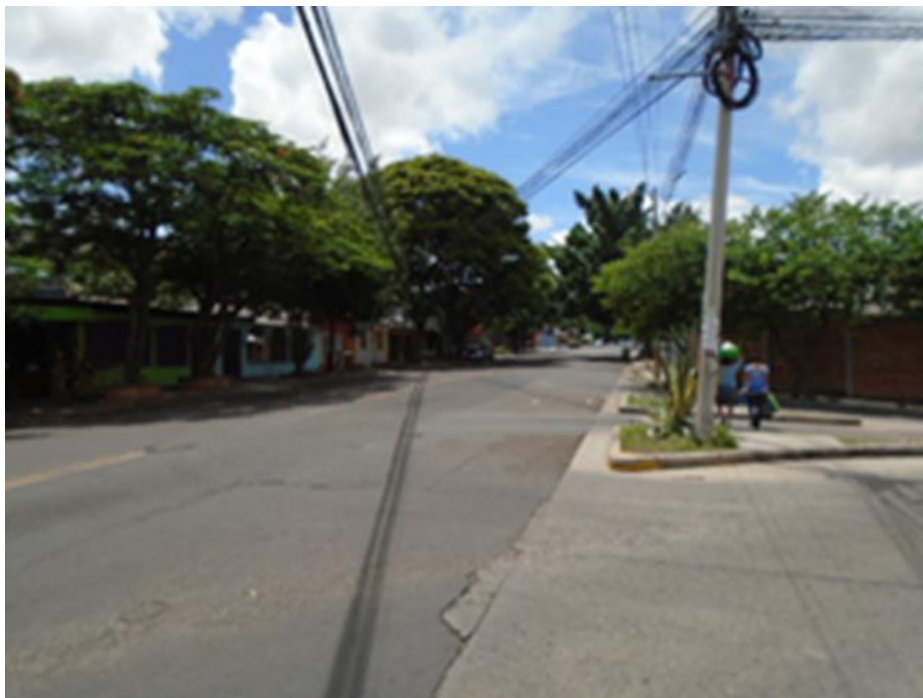
Intersección calle Col. El Dorado – Bulevar FFAA (Punto No.5)