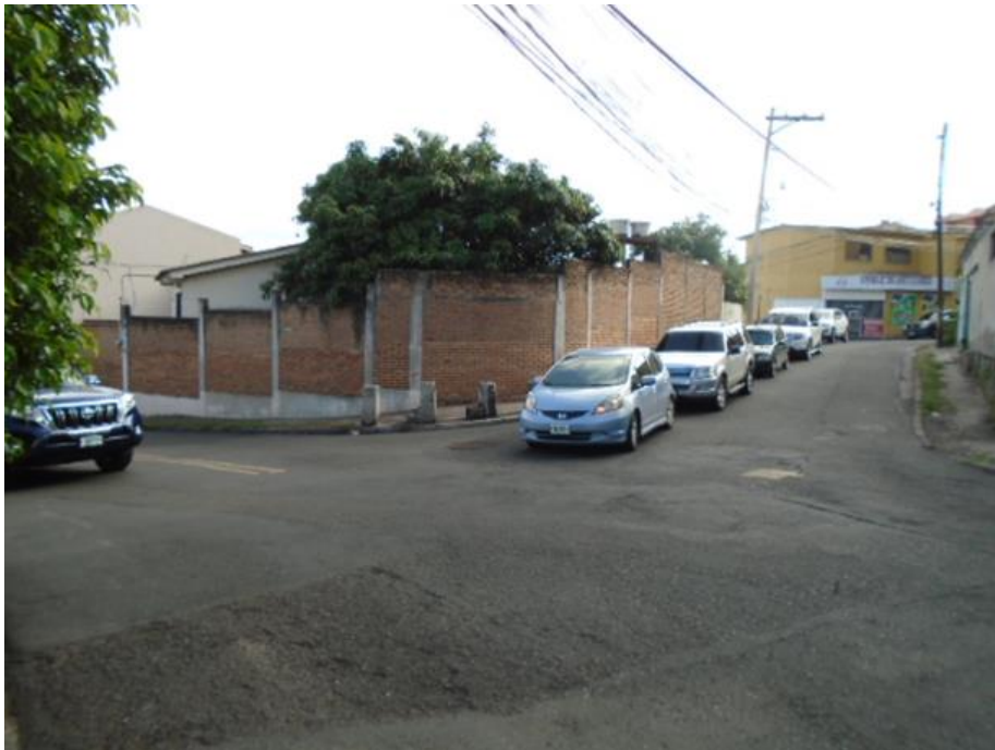
Intersección Col. Loma Linda – Col. Miramontes (Punto No.2)