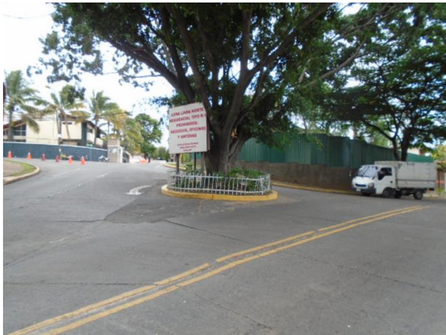
Rotonda calle principal Col. Loma Linda (Punto No.1)