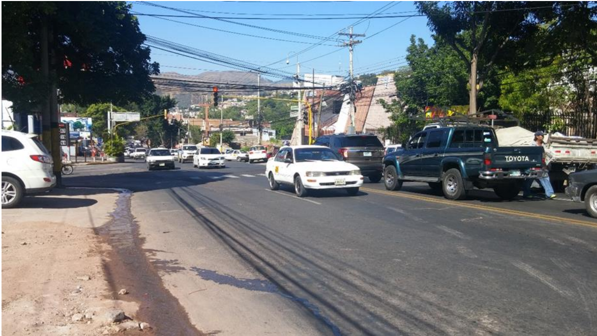
Trafico en intersección donde se construirá el Paso Elevado.