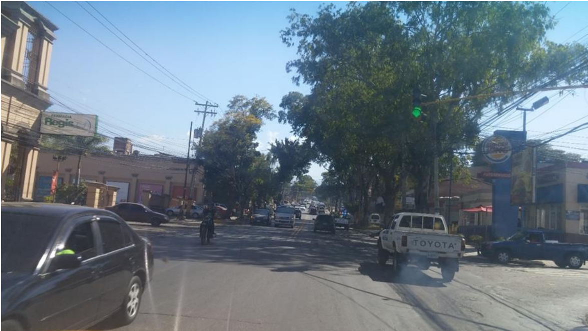
Prolongación de la Avenida La Paz, donde se ampliará la calzada de la vía.