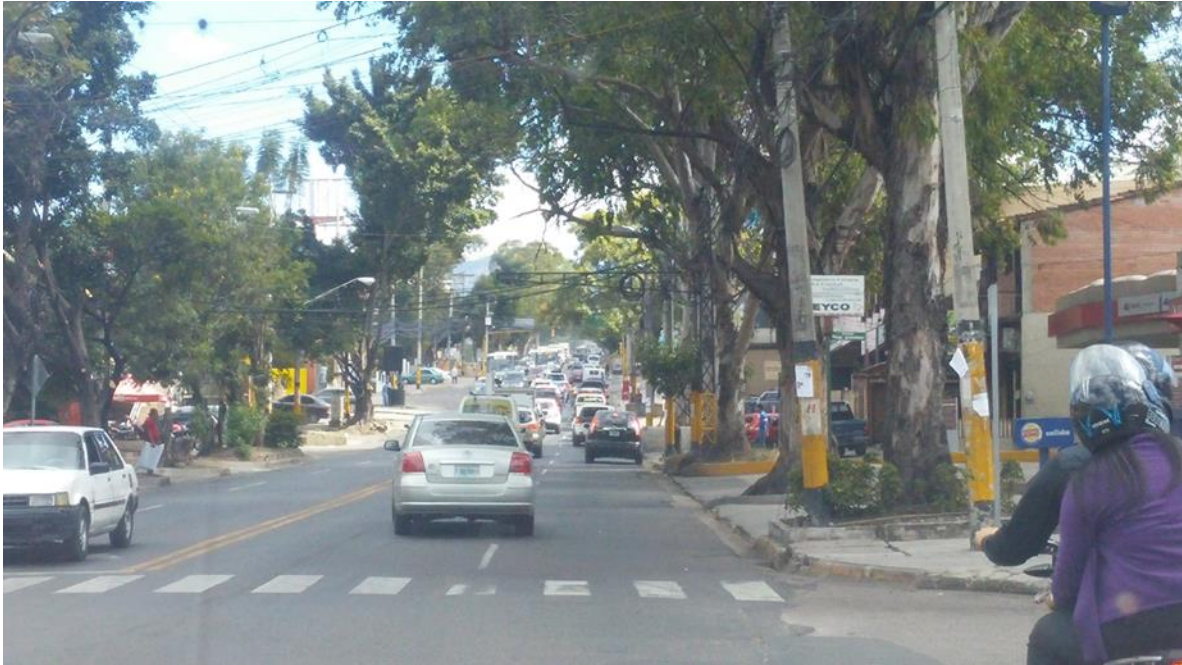
Trafico existente en Avenida La Paz.