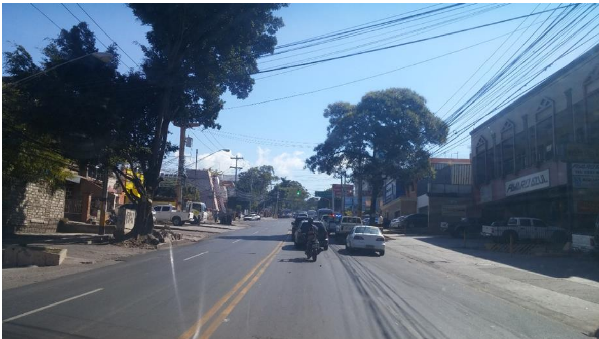
Tiempos de espera en el semáforo existente en la intersección.