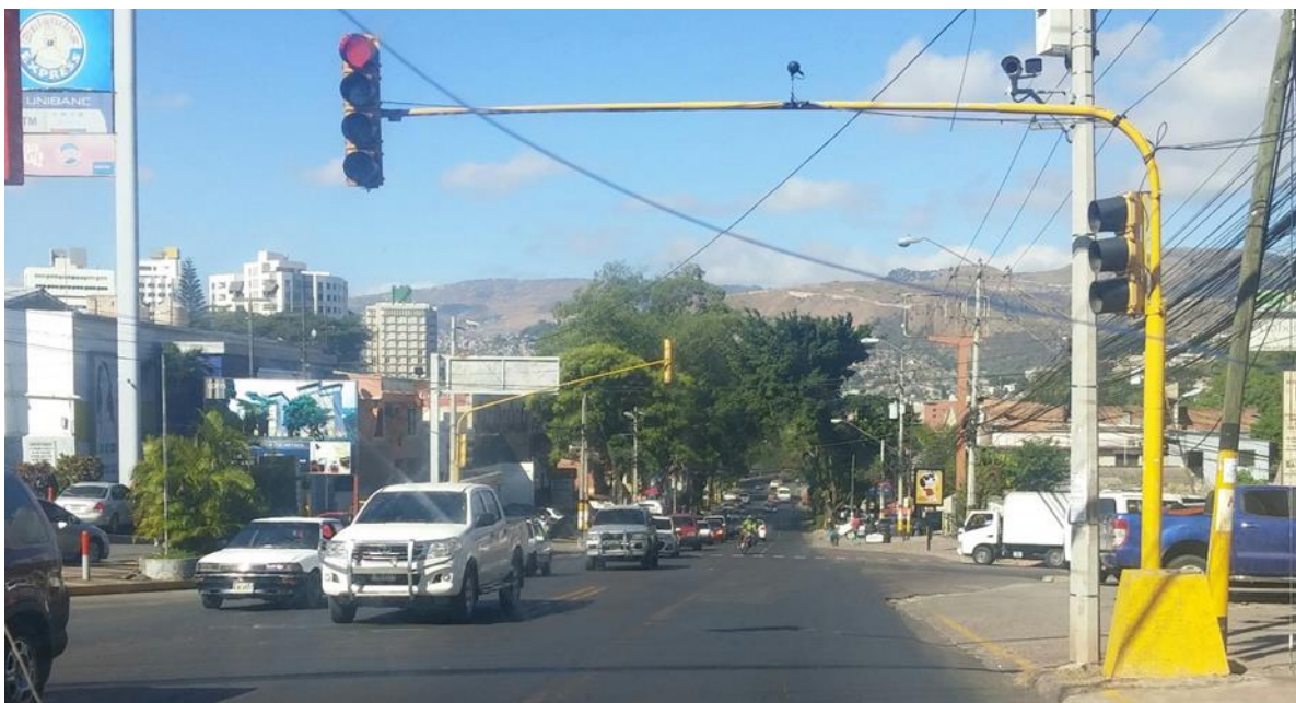
Intersección Ave. La Paz – Paseo La Reforma.