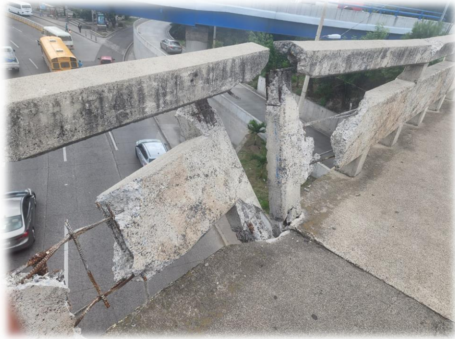
Imagen representativa de las reparaciones a realizar en distintos pretilos de concreto