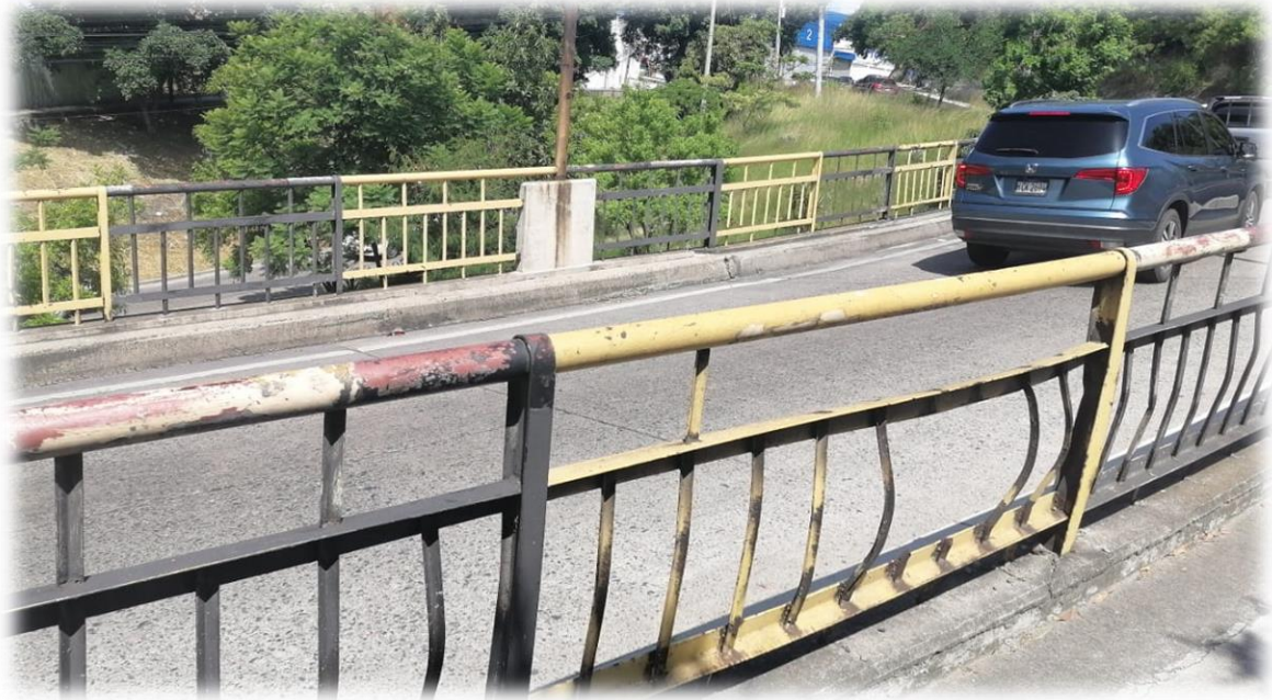
En la imagen se muestra la necesidad de reparaciones puntuales y pintura en barandales metálicos