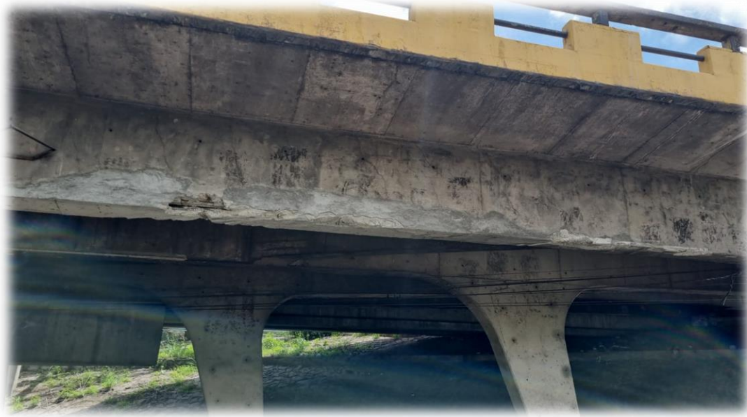
Imagen representativa de la necesidad de resanes en vigas de algunos pasos a desnivel