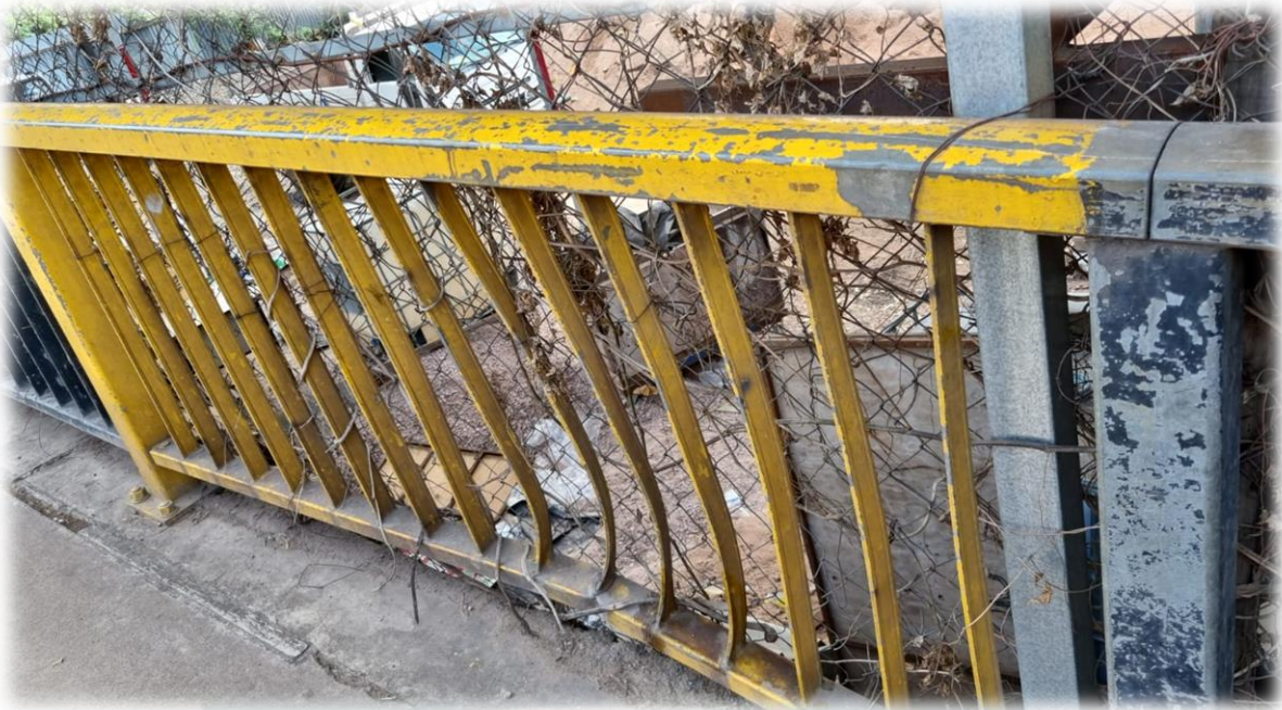
En la imagen se muestra las condiciones de distintos barandales metálicos