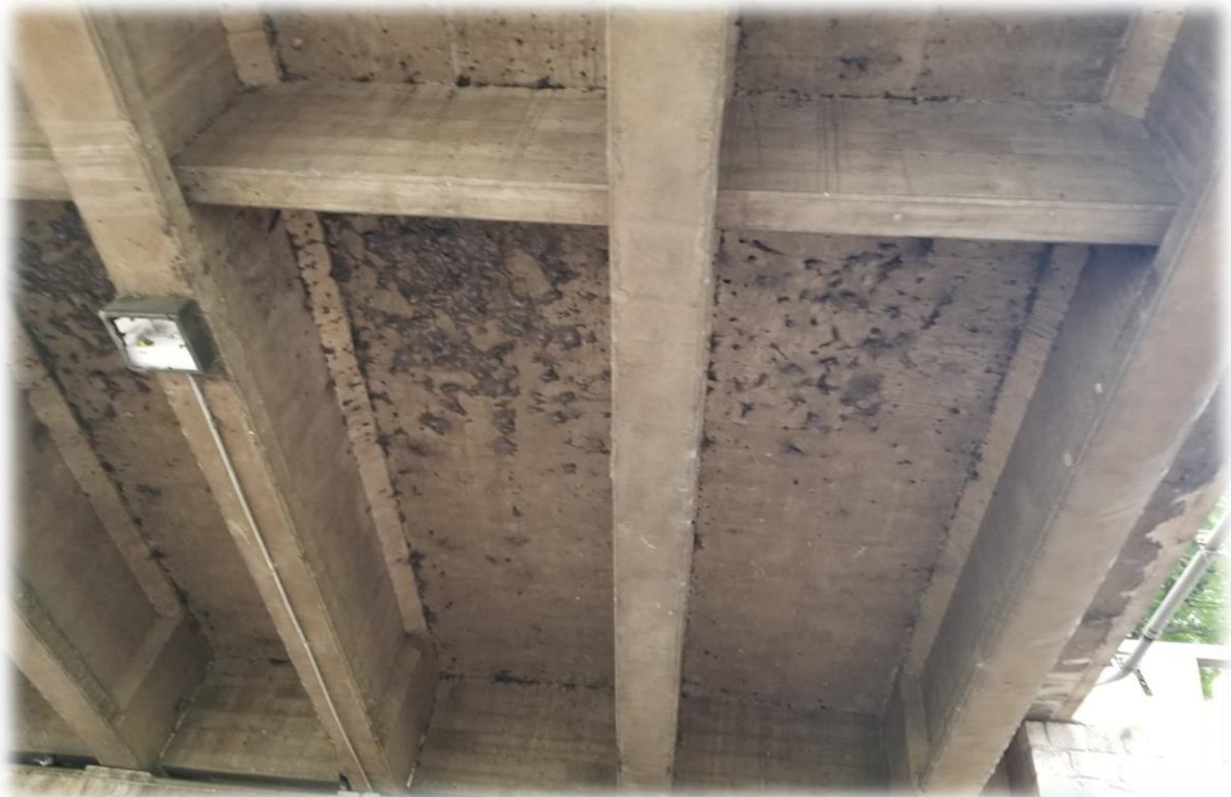
Imagen general de las condiciones de las losas en los pasos a desnivel