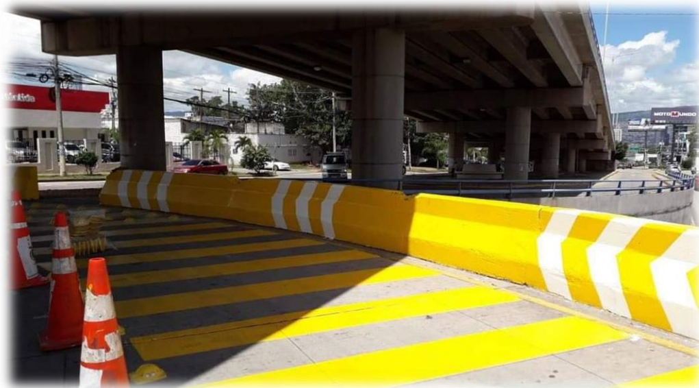
Se proporciona como referencia imagen de trabajos de pintura en barreras realizados por la AMDC