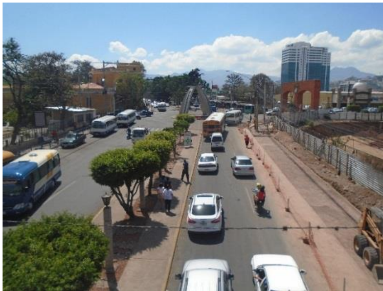
Movimiento vehicular del transporte urbano de la zona.