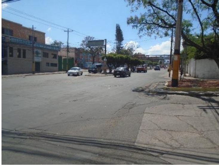
Inicio del Proyecto.