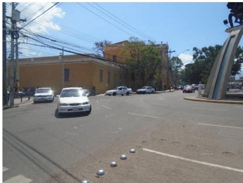
Ubicación del Hospital San Felipe.