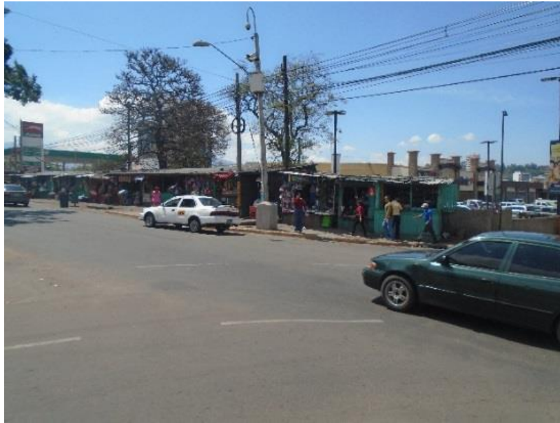
Comercio informal frente a centro comercial Próceres próximo a reubicar.