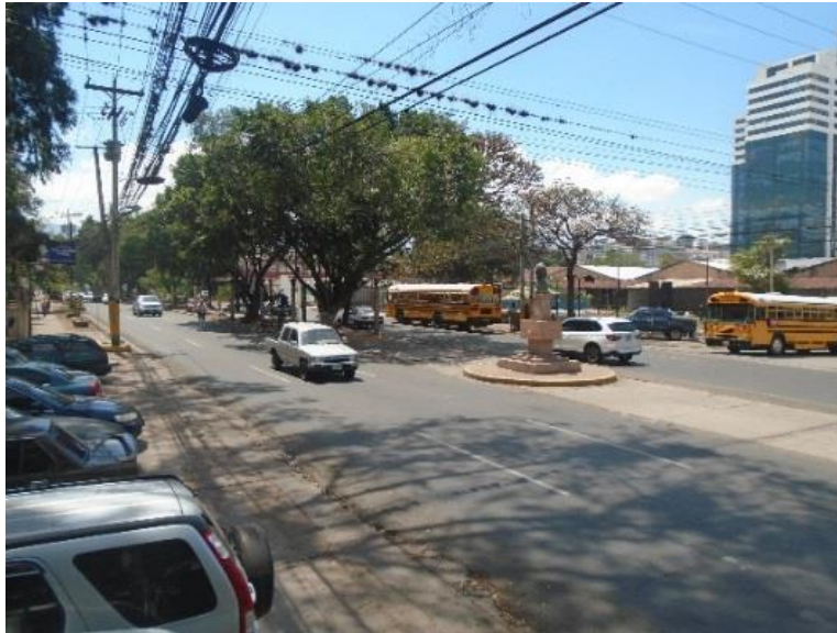
Vista del tráfico en sentido desde Anillo Periférico hacia el Bulevar Los Próceres. Intersección hacia Barrio San Felipe lado derecho - busto "George Washington" en el cual se eliminará el giro hacia la izquierda, dando paso únicamente a vehículos que giren en sentido Anillo Periférico hacia Barrio San Felipe.