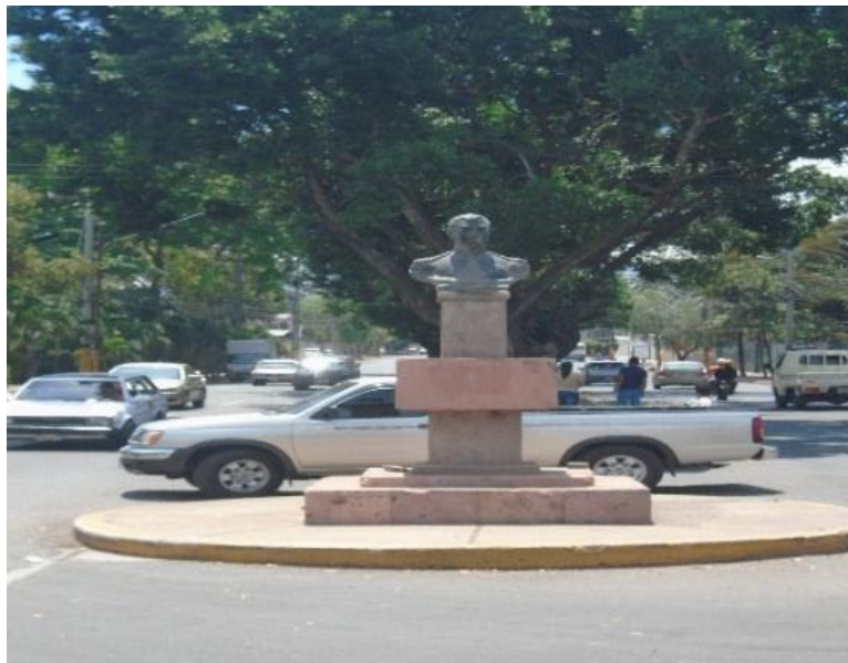
Vista del tráfico en ambos sentidos intersección hacia Barrio Colonia Lara lado izquierdo donde se encuentra el busto "José de San Martí" en el cual se eliminará el giro hacia la izquierda dando paso solamente a vehículos que giren en sentido Avenida La Paz hacia Colonia Lara.