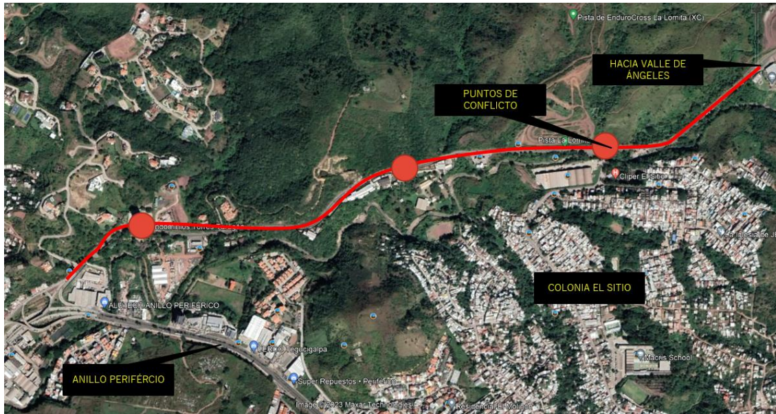
Ilustración 2: área de intervención del proyecto