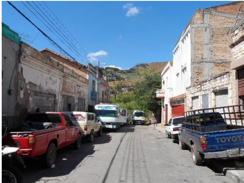
En la imagen se muestra el tramo final de la Avenida Cervantes, conexión mediante gradas con Paseo Marco Aurelio Soto.