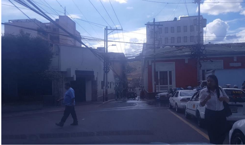
En la imagen se muestra la intersección de la Ave Cervantes con la calle Salvador Mendieta