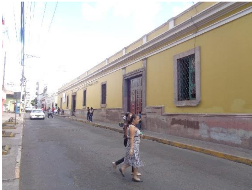
En la imagen se muestra una vista de la vía frente a la biblioteca Nacional