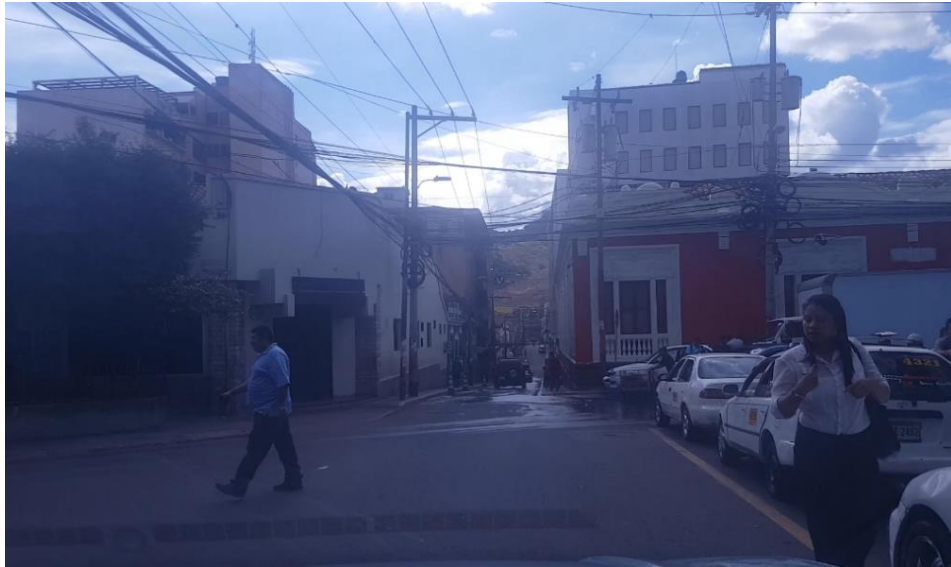
En la imagen se muestra la intersección de la Ave Cervantes con la calle Salvador Mendieta