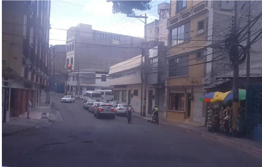
En la imagen se muestra el inicio del proyecto frente al Hotel Excelsior en el Barrio San Rafael