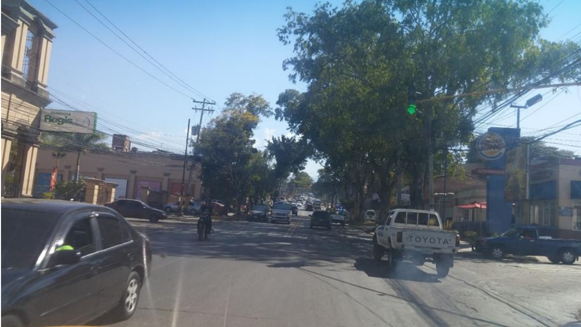
Prolongación de la Avenida La Paz, donde se ampliará la calzada de la vía.