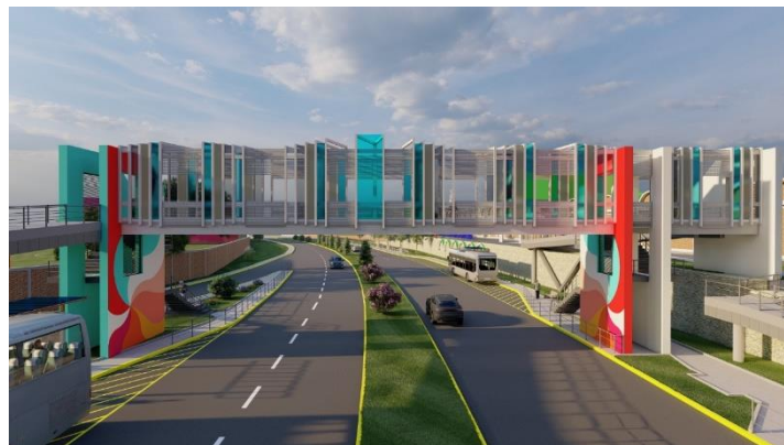
Imagen de la Propuesta de diseño Teletón

Se considera un cambio a las líneas de transmisión eléctrica primarias, secundarias y de telecomunicaciones que interfieren con el puente; se deberá realizar la devolución de materiales recuperados al almacén de la ENEE. Se considera la reubicación de tuberías hidrosanitarias existentes.