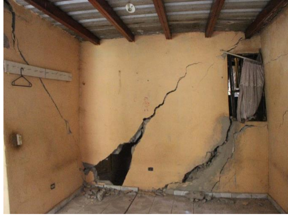
Aldea Nueva Suyapa