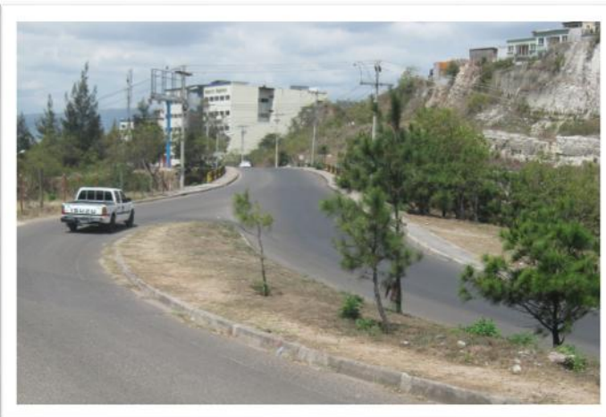
Ilustración 9. Panorámica del sitio en dirección al Trapiche.