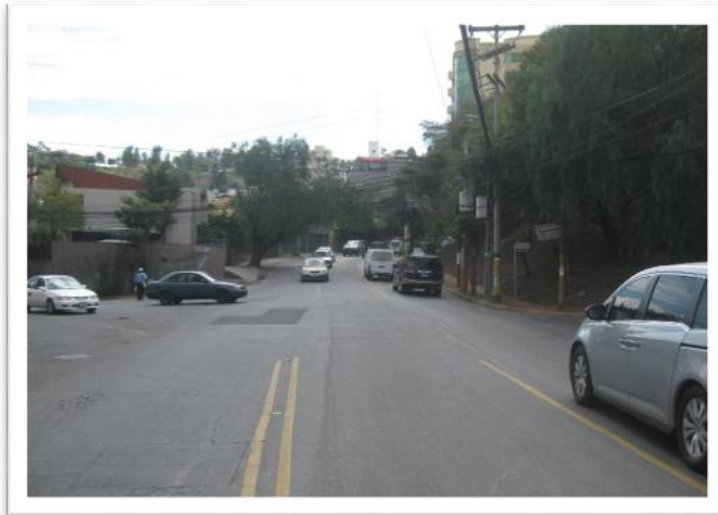
Ilustración 5. Avenida república Dominicana