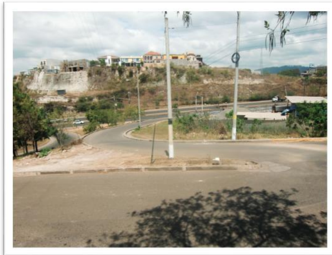
Ilustración 7. Zona de desarrollo de la rotonda.

Intersección rampa a Anillo Periférico con calle principal que proviene del Hospital María, Tegucigalpa M. D. C.