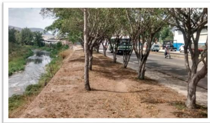
Ilustración 3. Fotografía de ampliación de calle en zona verde existente.