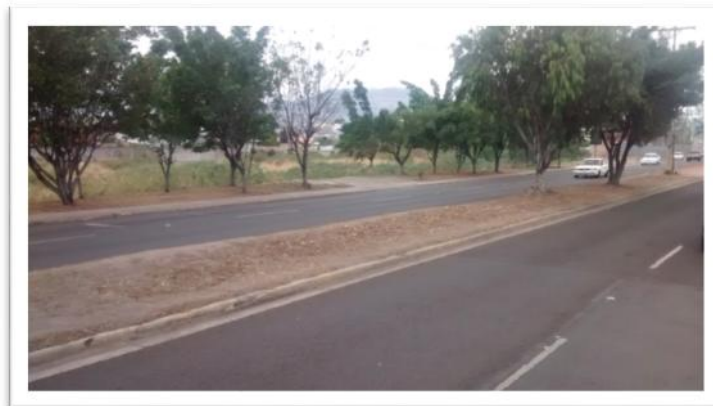
Ilustración 2. Fotografía en zona del bulevar Kuwait.