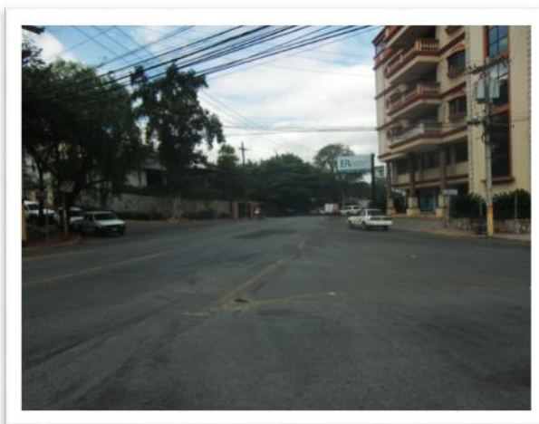
Ilustración 6. Fotografía en dirección al Ministerio Público.