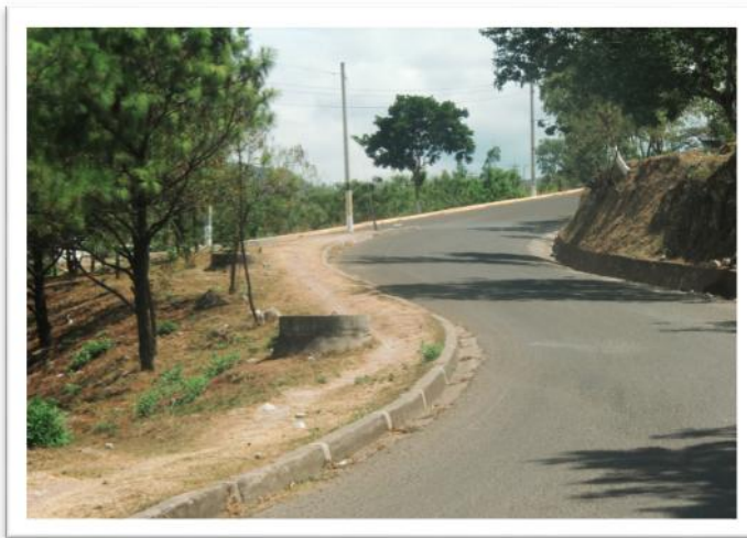
Ilustración 8. Panorámica del sitio en dirección al Hospital María.