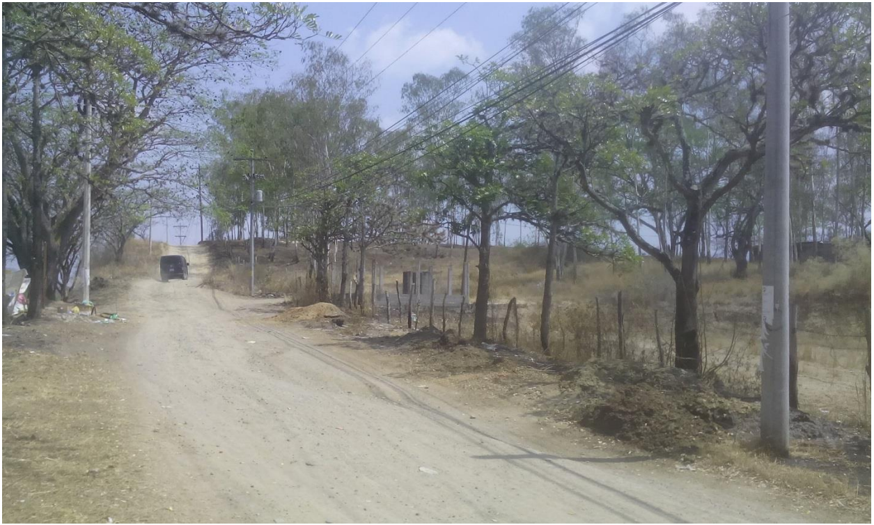
Calle de Acceso y vista frontal del predio.