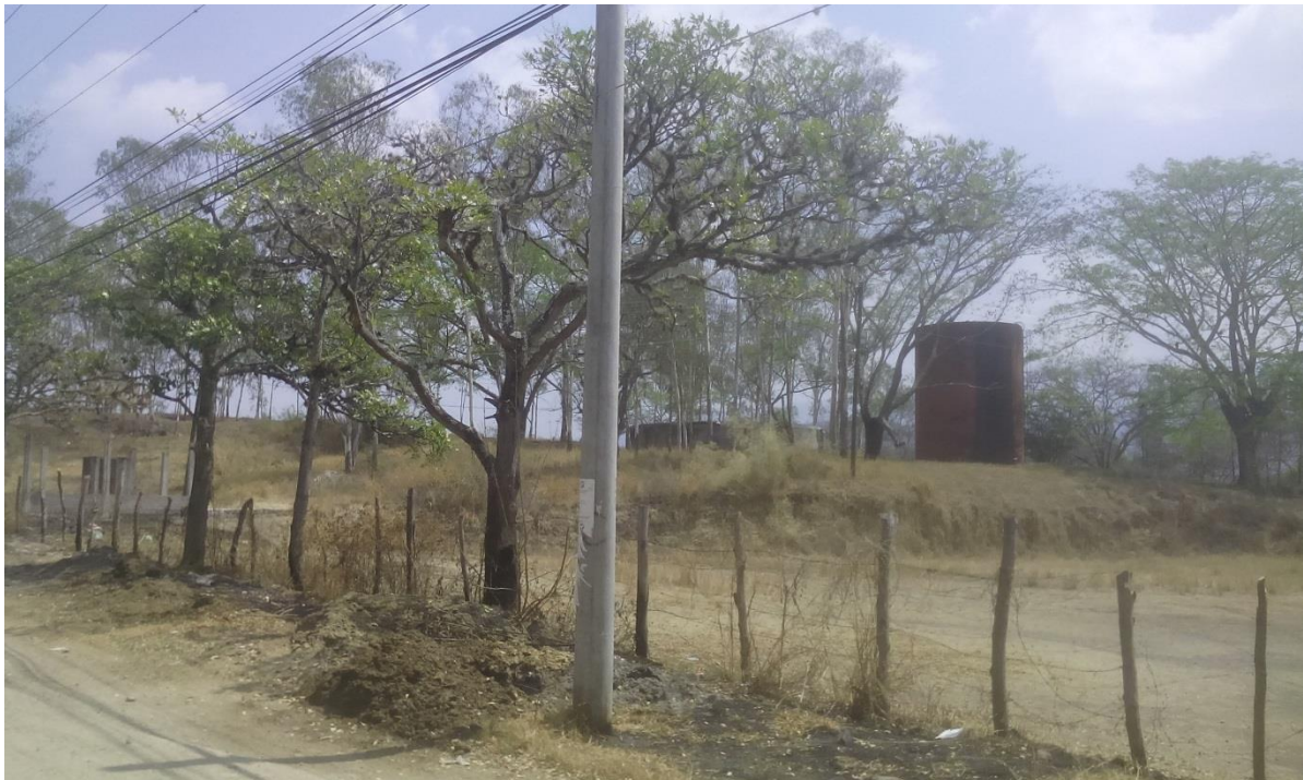
Vista Frontal del predio y tanques existentes a reubicar propiedad de PROMDECA