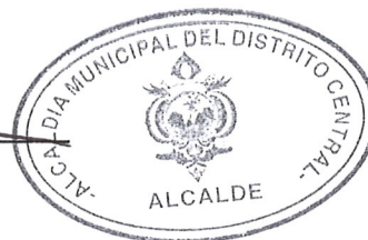
Nasry Juan Asfura Zablah Alcalde Municipal