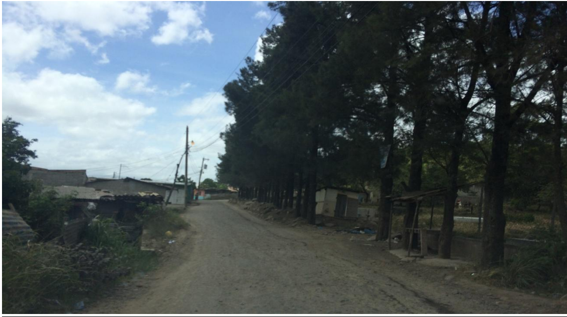
INICIO DE CONFORMADO Y BALASTADO DE CALLE, COLONIA EL PARAISO