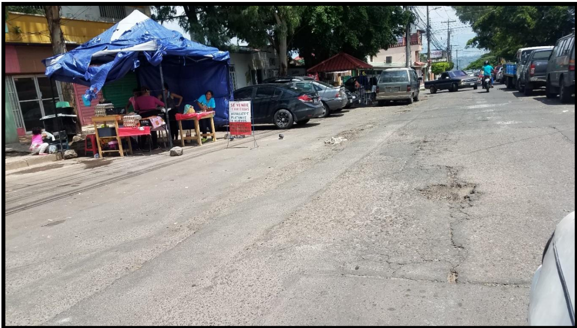
En la imagen se observa las condiciones de la estructura existente