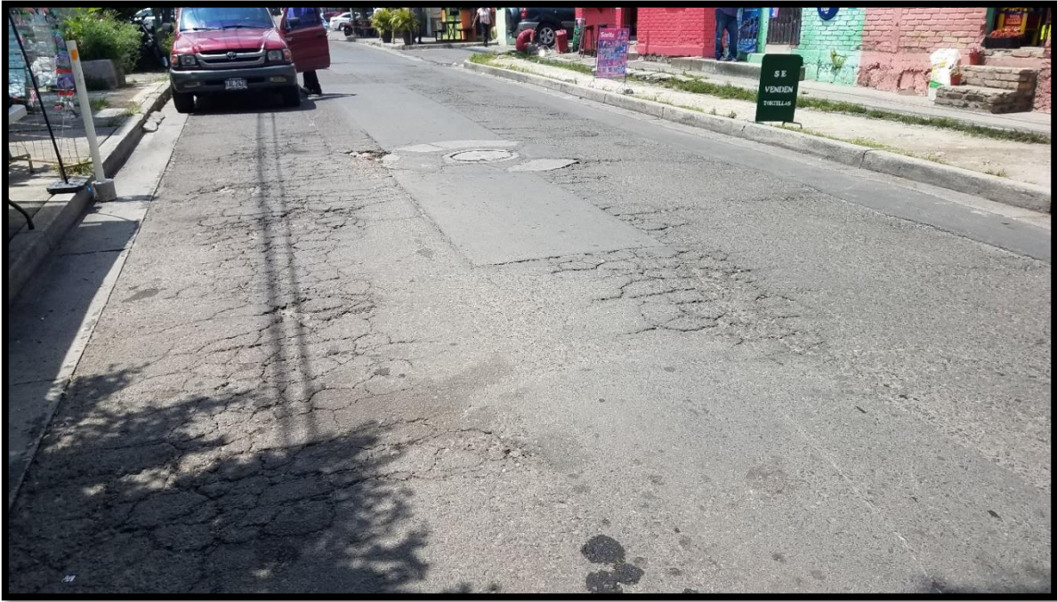
En la imagen se muestra el desgaste en la superficie producto del tráfico que circula por la zona y las escorrentías de invierno