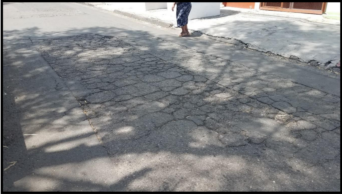
En la imagen se muestra parte del tramo de la calle a intervenir