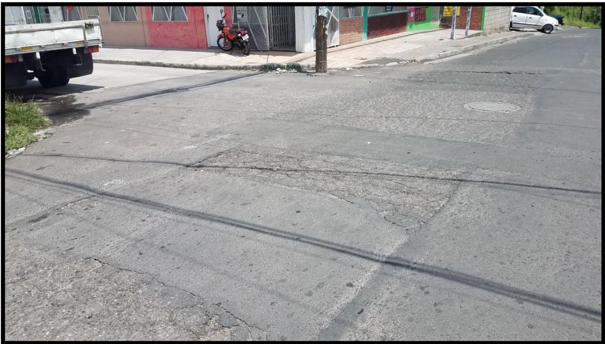
En la imagen se muestra el deterioro de la superficie de rodadura.