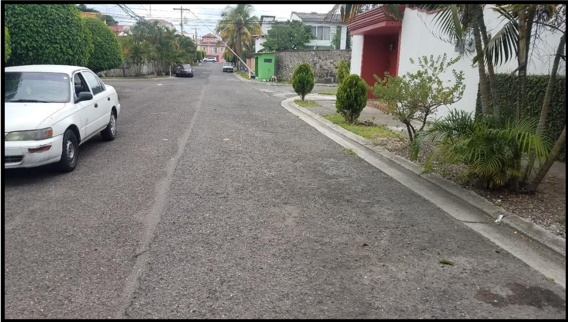
En la imagen se observa las condiciones de la estructura existente