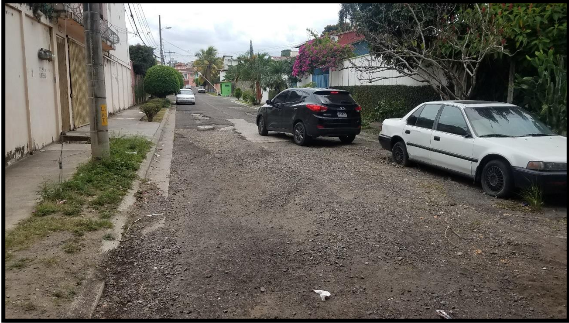
En la imagen se muestra el desgaste en la superficie producto del tráfico que circula por la zona y las escorrentías de invierno