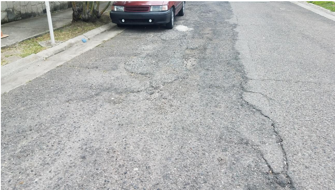
En la imagen se muestra el deterioro de la superficie de rodadura.