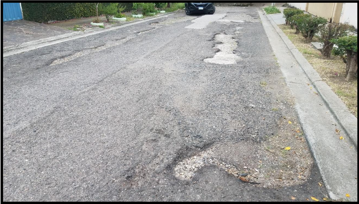
En la imagen se muestra el tramo inicial de una de las calles a intervenir