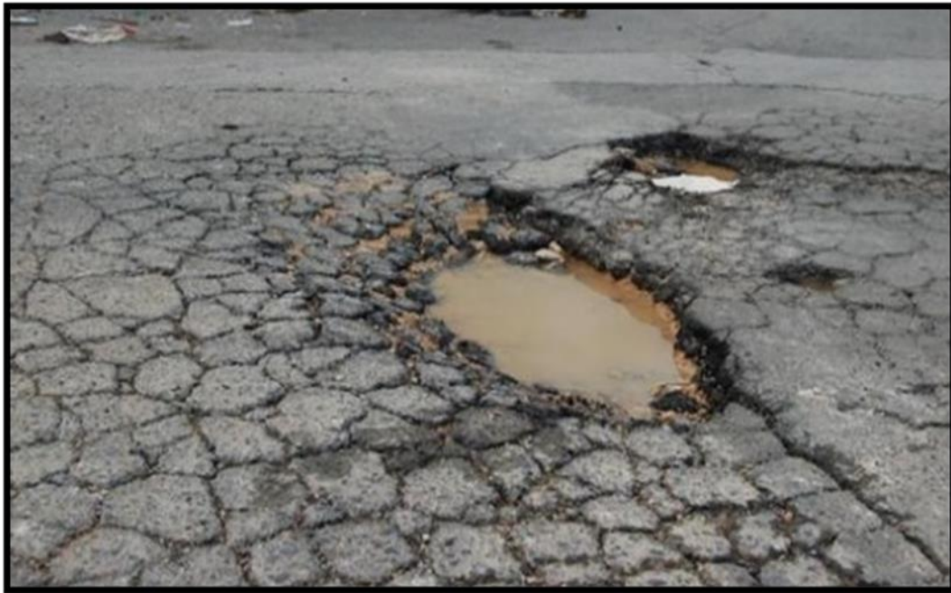
VISTA DEL TRAMO EN MAL ESTADO DE LAS CALLES