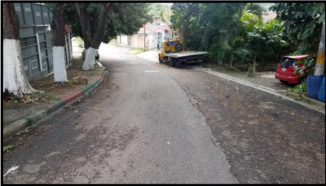
En la imagen se muestra el tramo deteriorado de una de las calles a intervenir