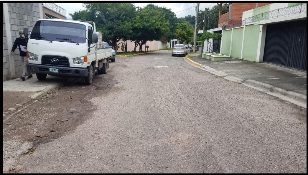
En la imagen se muestra el deterioro de la superficie de rodadura.