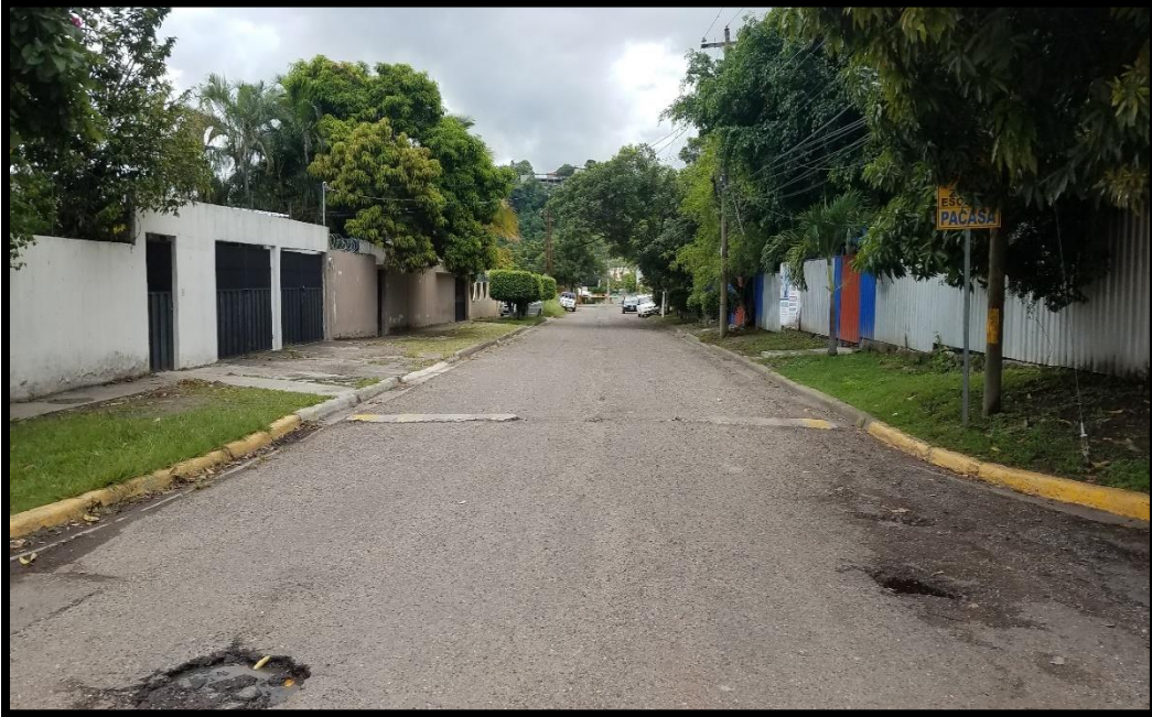
En la imagen se muestra el desgaste en la superficie producto del tráfico que circula por la zona y las escorrentías de invierno