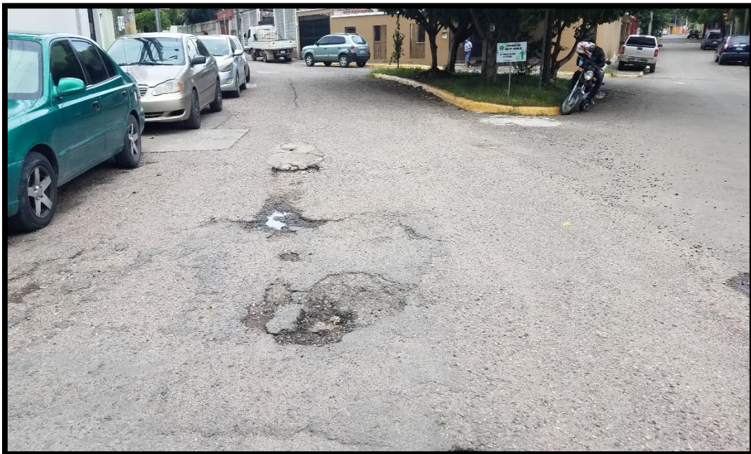
En la imagen se observa las condiciones de la estructura existente