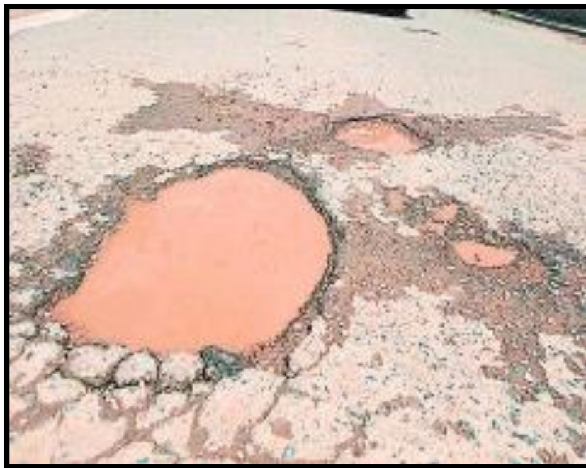
En la imagen se muestra las condiciones a lo largo de la avenida