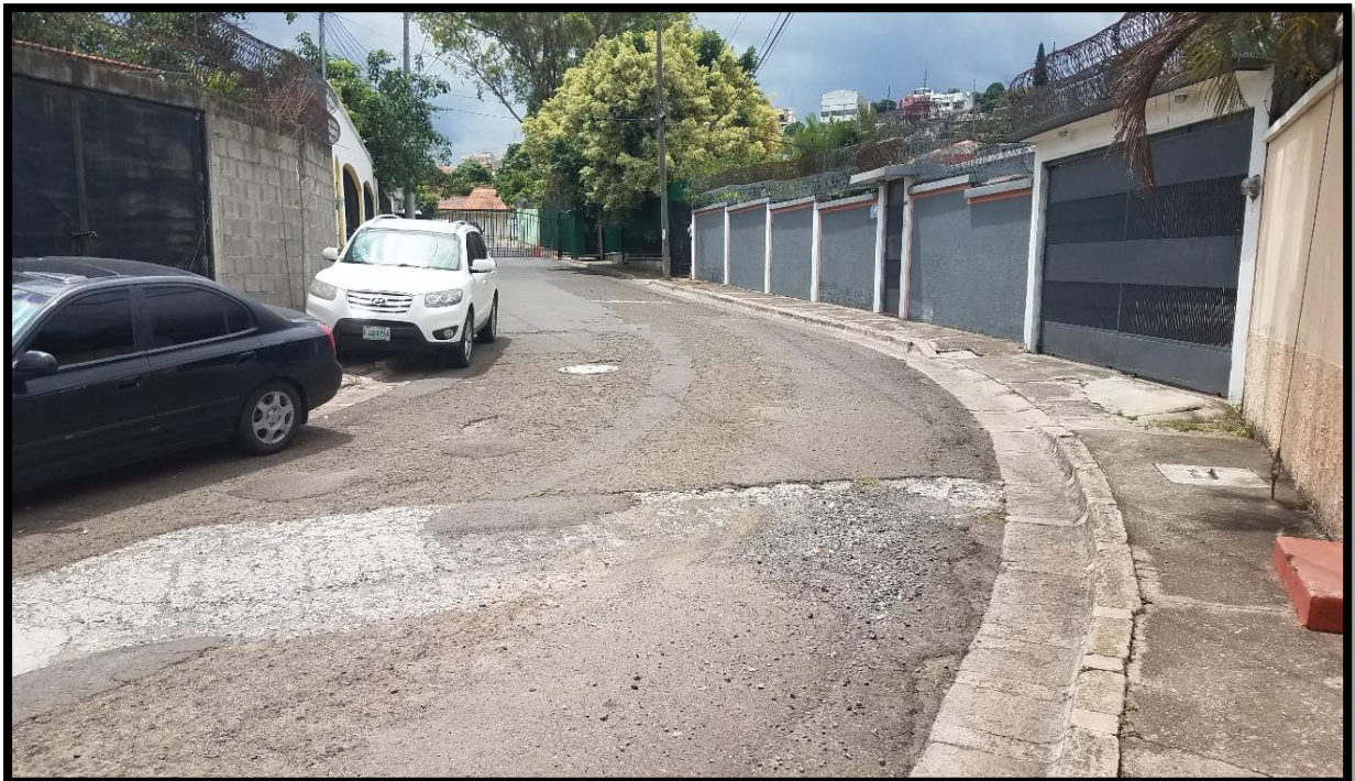
En la imagen se muestra el tramo final a intervenir