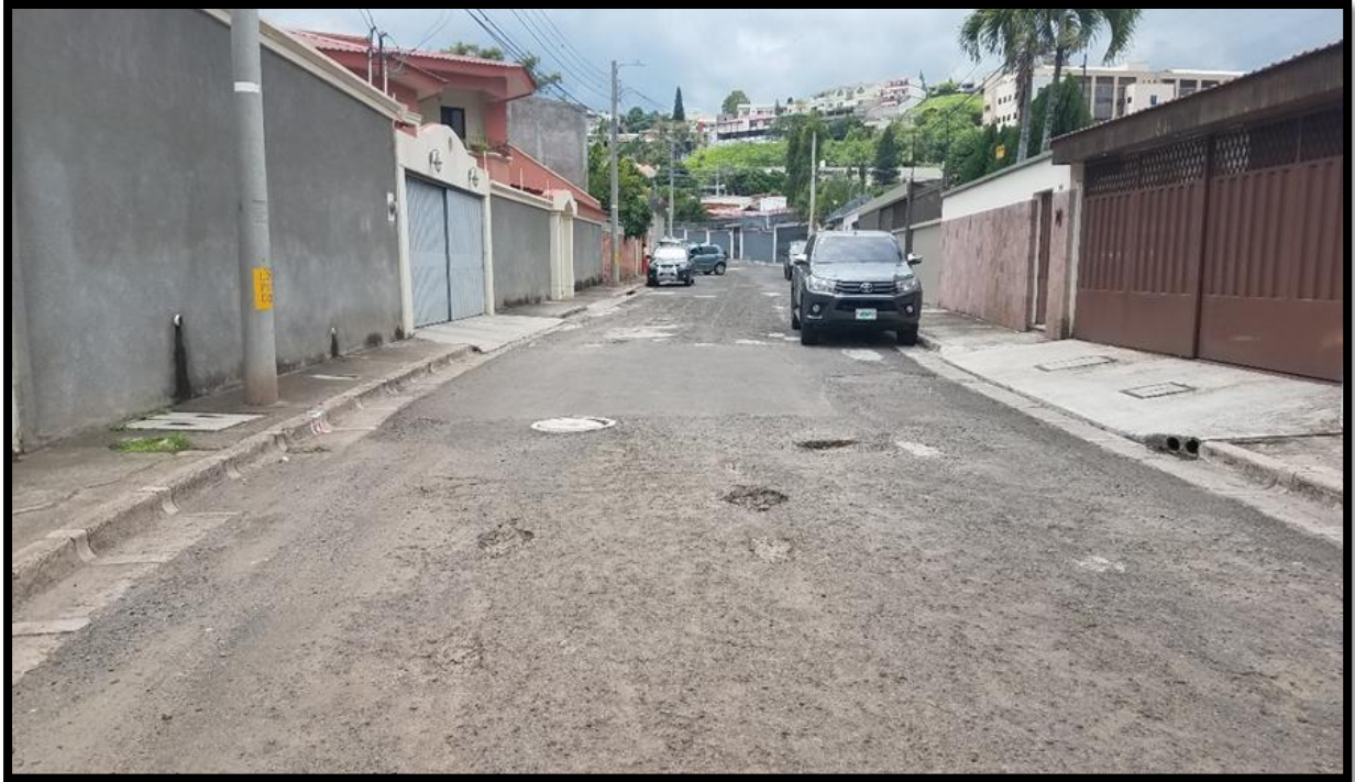
En la imagen se muestra un tramo intermedio del tramo a intervenir