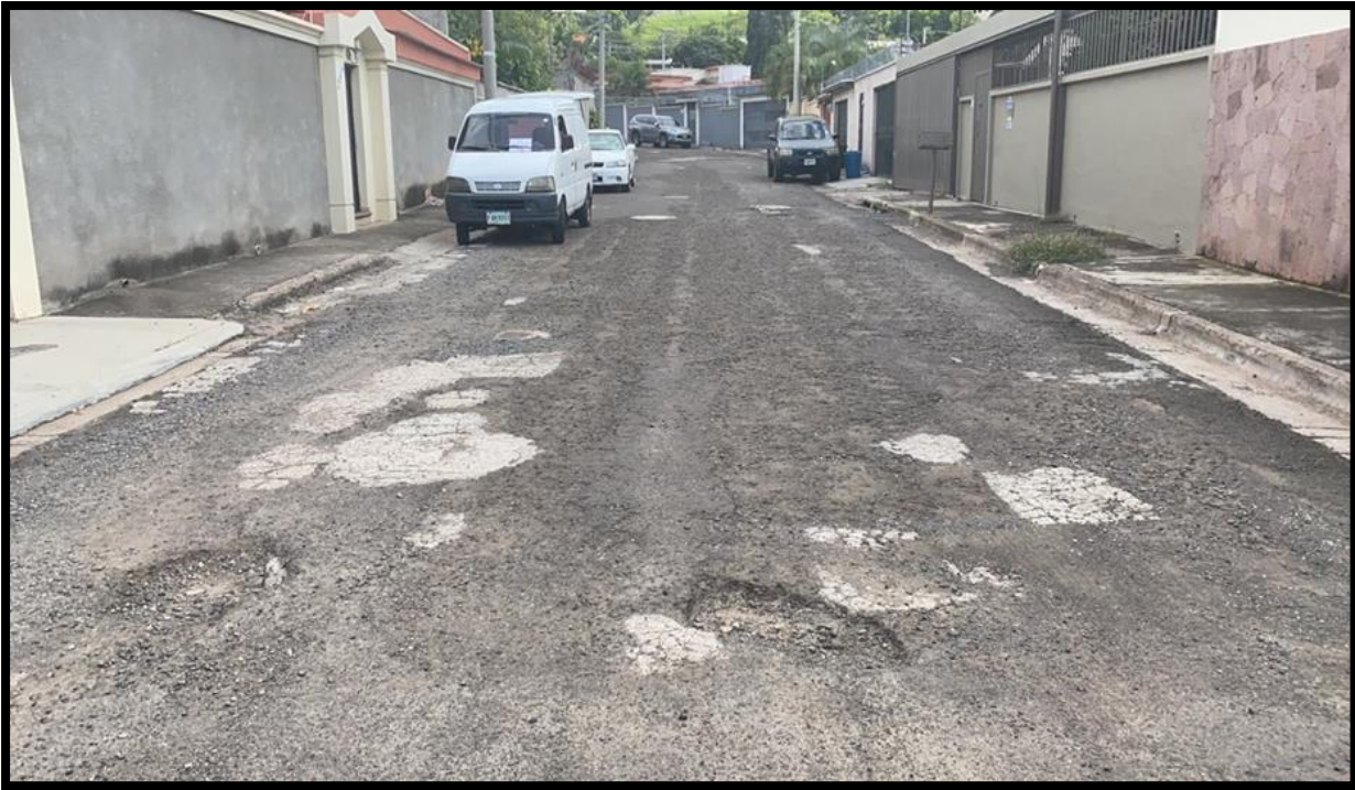
En la imagen se muestra el tramo inicial de una de las calles a intervenir