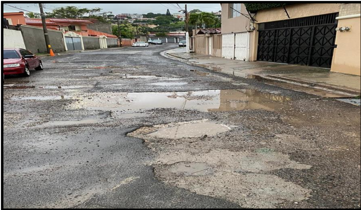
En la imagen se observa las condiciones de la estructura existente