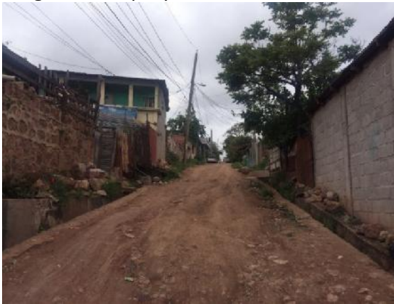
Inicio de calle a pavimentar con concreto hidráulico.