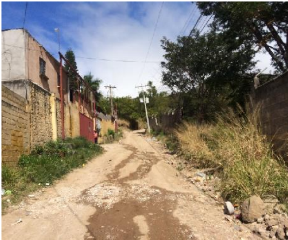
Vista de calle a pavimentar con concreto hidráulico.