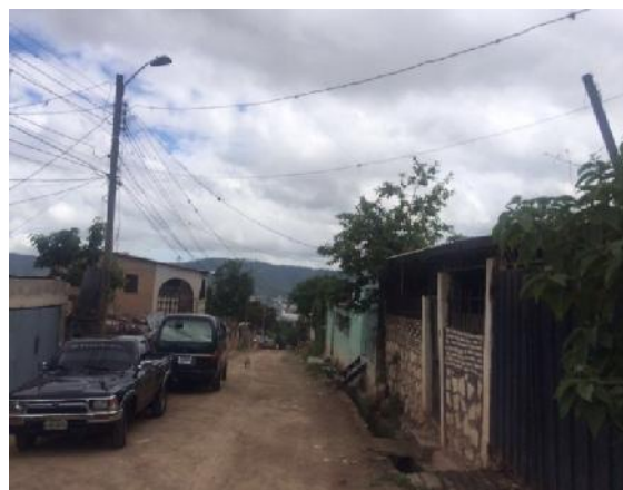
Vista de final de la calle a pavimentar.