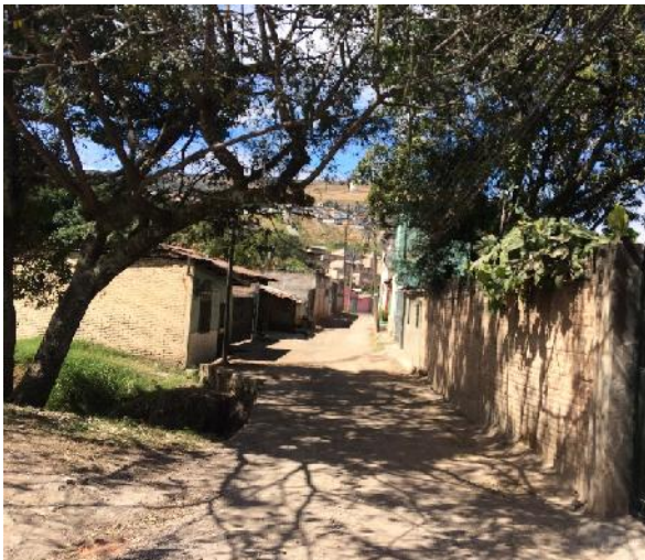
Vista de calle a reparar.