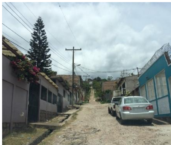
Se observa el estado actual y cunetas de drenaje de aguas lluvias en ambos lados de la calle.