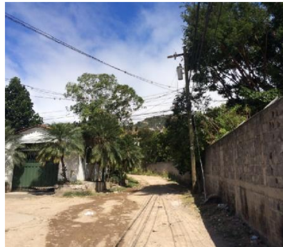
Vista panorámica de calle a pavimentar.