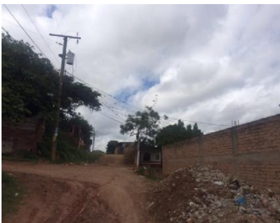
Vista de calle a pavimentar con concreto hidráulico.