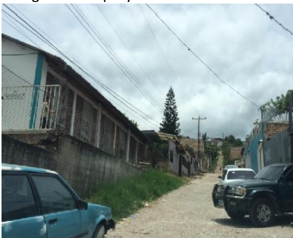
Se observa el estado actual de la calle, la pendiente del terreno natural y el ancho de la vía.