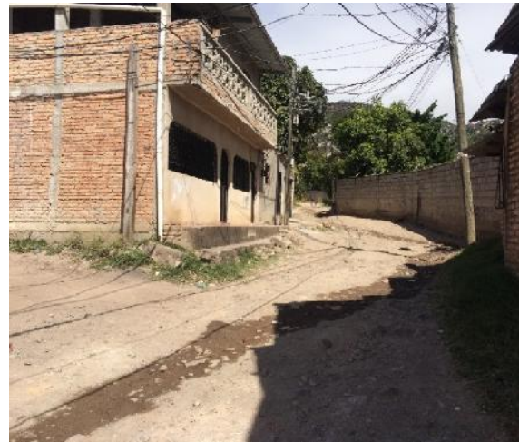
Vista del estado actual de la calle.