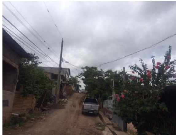
Estado actual de la calle a pavimentar.