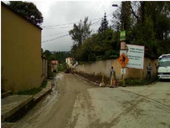
En la imagen se muestra el inicio de la calle a rehabilitar con doble tratamiento.