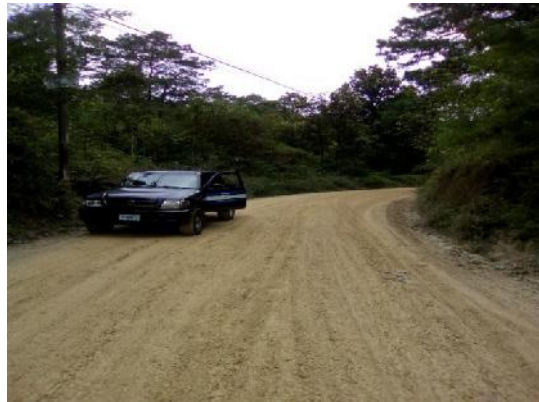
En la imagen se muestra un tramo intermedio de la calle a mejorar indicando el estado actual de la sub base existente.