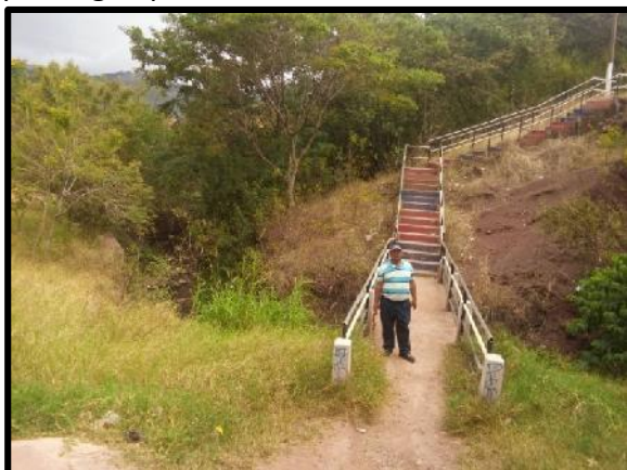
Panorama en donde se instalará la tubería de agua potable.