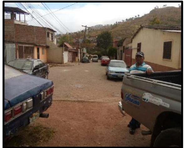
Panorama en donde se ejecutará la obra.