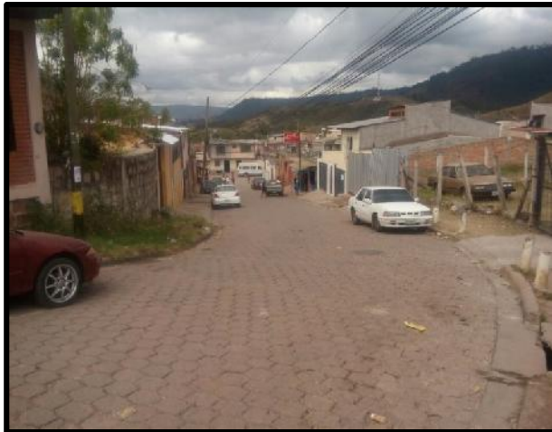
Inicio de proyecto en que se instalará la tubería para agua potable.