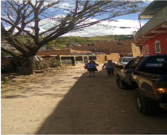
Inicio de calle a pavimentar con concreto hidráulico.