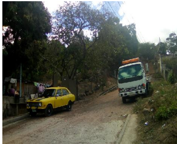
final de calle a pavimentar con concreto hidráulico