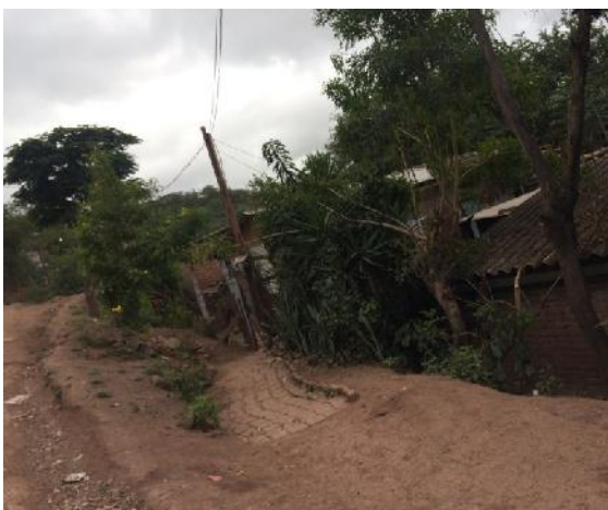
Vista de calle en que se construirá un muro.