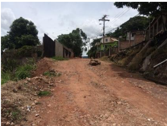
Se observa el estado actual de la calle y el ancho del derecho de vía.