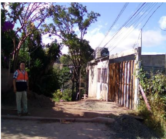
Vista de inicio de obra a ejecutar.