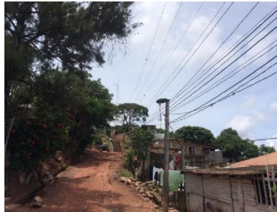
Se observa el estado actual y cunetas de drenaje de aguas lluvias en ambos lados de la calle.