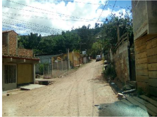
Panorama de calle col. plan de los pinos.