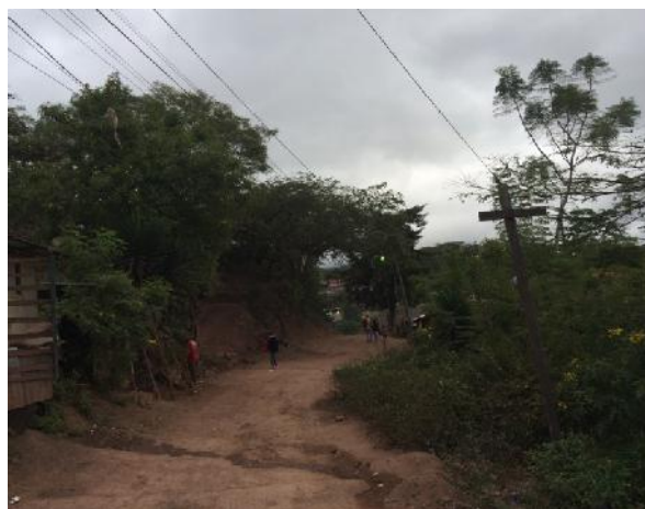
Calle en que se construirá un muro y se pavimentará.