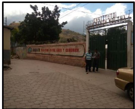
Final de proyecto a ejecutar.