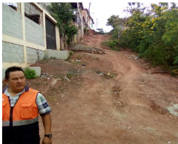
Panorama de calle en aldea suyapa, sector nazareth.