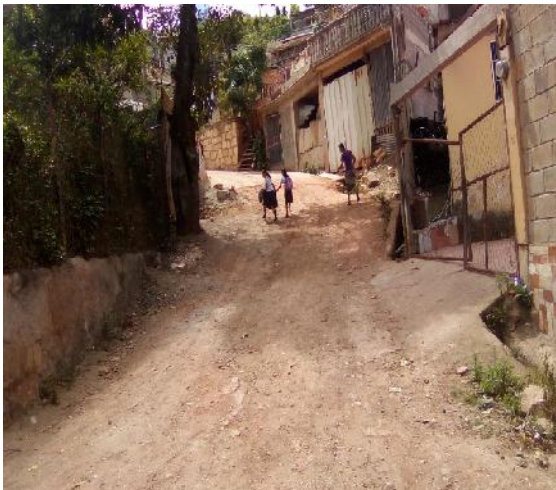
Vista de calle en que se ejecutara la obra.