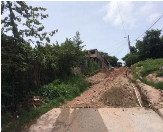
Se observa el estado actual de la calle, la pendiente del terreno natural y el ancho de la vía.