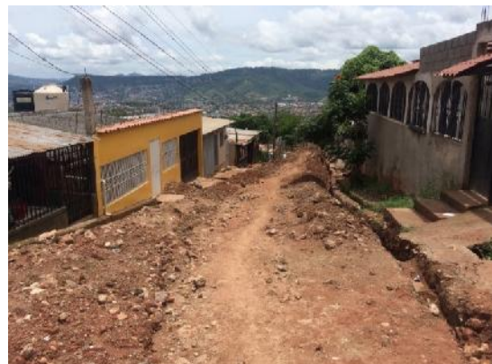
Se observa el estado actual de la calle, la pendiente del terreno natural y el ancho de la vía.