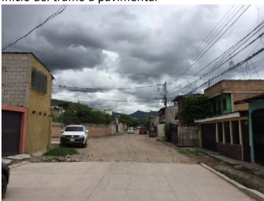
vista de calle a pavimentar con concreto hidráulico