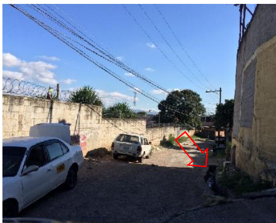
cuneta de mamposteria existente