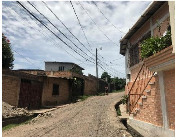
panorama de calle a pavimentar con concreto hidráulico