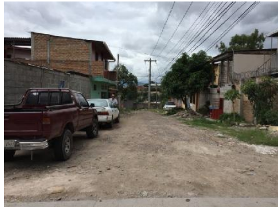
Panorama de la calle a pavimentar