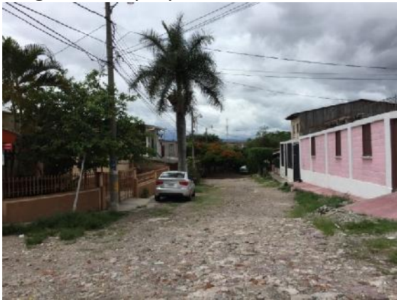
Inicio del tramo a pavimentar