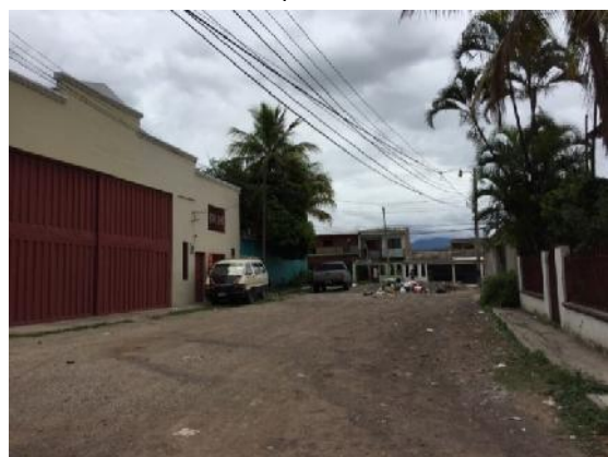
final de calle a pavimentar con concreto hidráulico