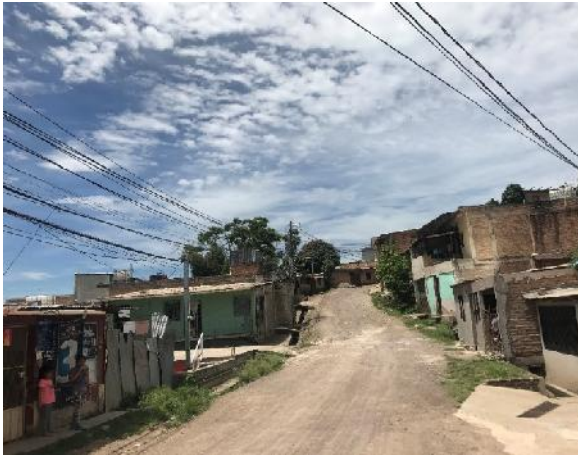
inicio de calle a pavimentar con concreto hidráulico