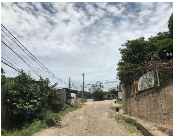
vista del estado actual de la calle