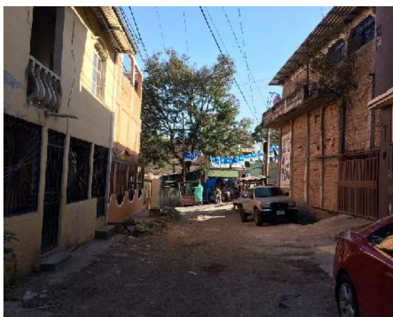
final de calle a pavimentar con concreto hidráulico