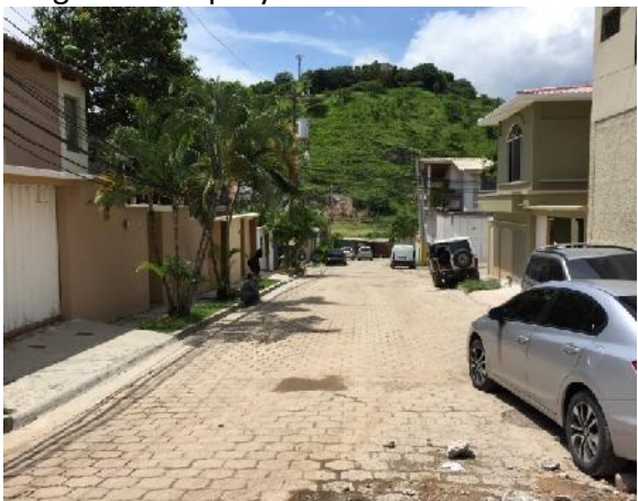
vista de calle 1 en que se desmontará el adoquín y se pavimentará con concreto hidráulico