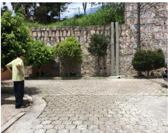
final de calle 2 en forma de "T"