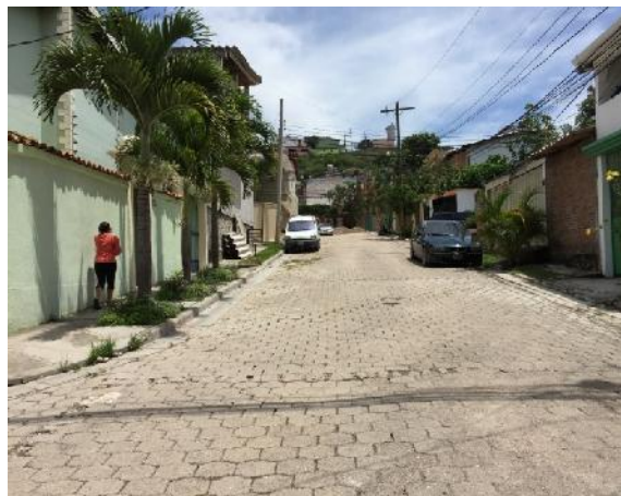
panorama de calle 2 en que se desmontará el adoquín