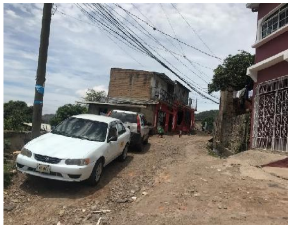
final de calle a pavimentar con concreto hidráulico