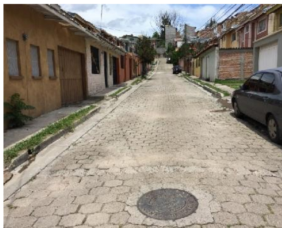
vista de calle 3, con forma de "T", en que se ejecutará la obra