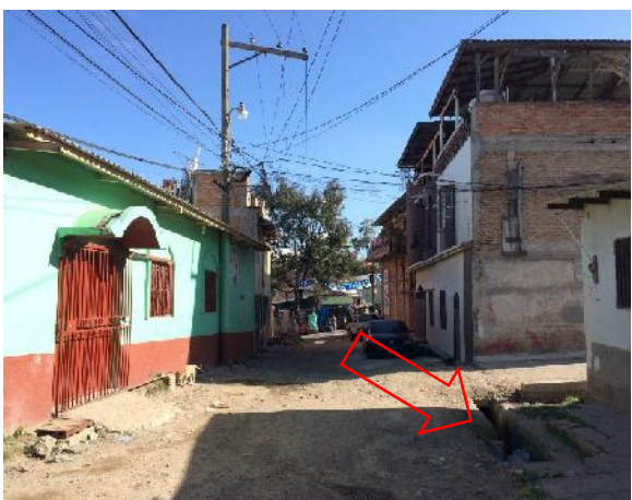
cuneta de concreto existente