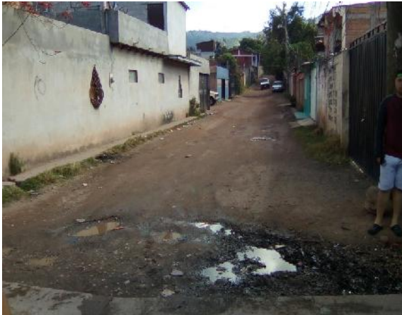
inicio de calle a pavimentar con concreto hidráulico