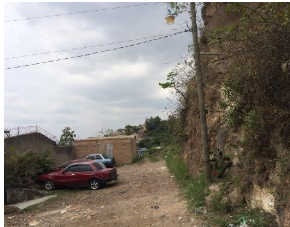
final de calle a pavimentar con concreto hidráulico