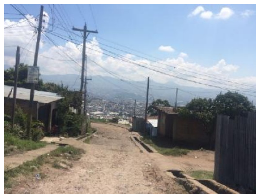
calle en que se construirán cunetas