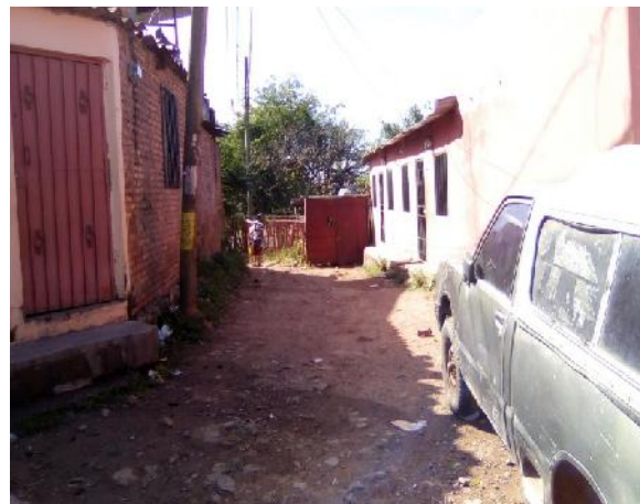
final de calle a pavimentar con concreto hidráulico