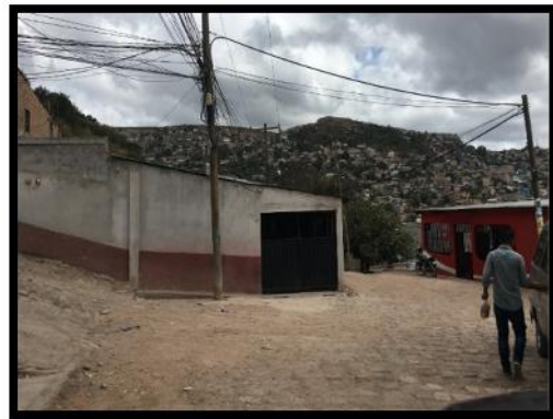
calle a pavimentar con concreto hidráulico