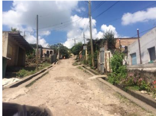
panorama de calle en que se ejecutará la obra