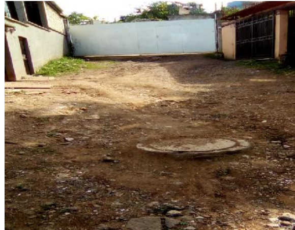
vista panoramica de calle a pavimentar con concreto hidráulico