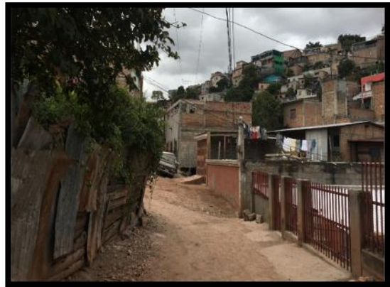
Panorama de la calle a pavimentar