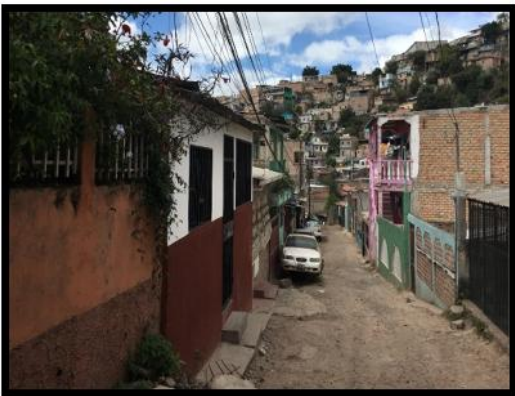
se observa el mal estado de las calles