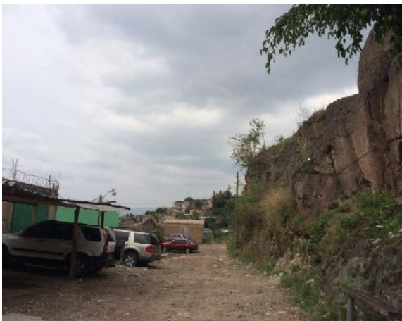
vista de calle a pavimentar con concreto hidráulico