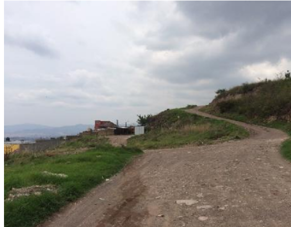
panorama de calle a pavimentar con concreto hidráulico