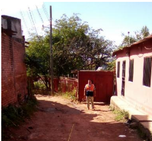
vista del estado actual de la calle