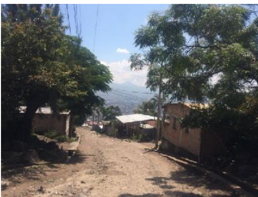
vista de calle en que se construirán huellas vehiculares