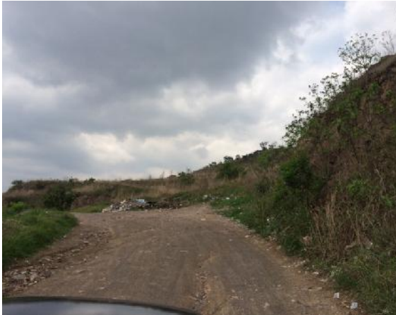
inicio de calle a pavimentar con concreto hidráulico