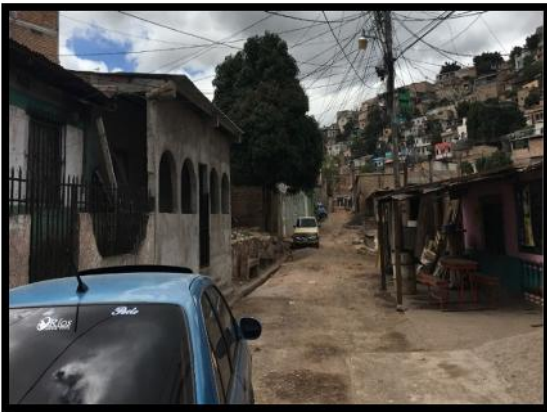
Inicio del tramo a pavimentar