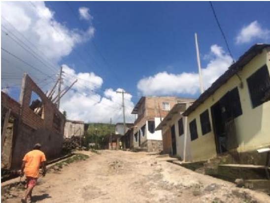
calle en donde se construirán huellas vehiculares