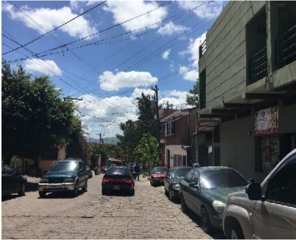
Inicio de calle a pavimentar con concreto hidráulico (calle a)