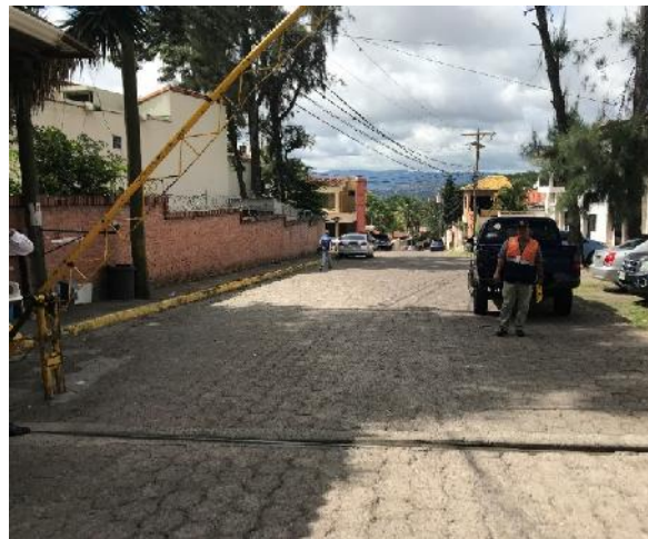
Estado actual del adoquín que se desmontará.