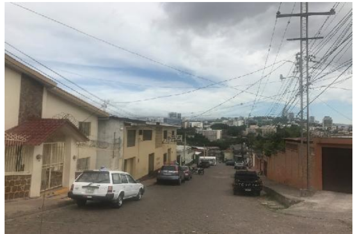
Panorama de calle a pavimentar con concreto.