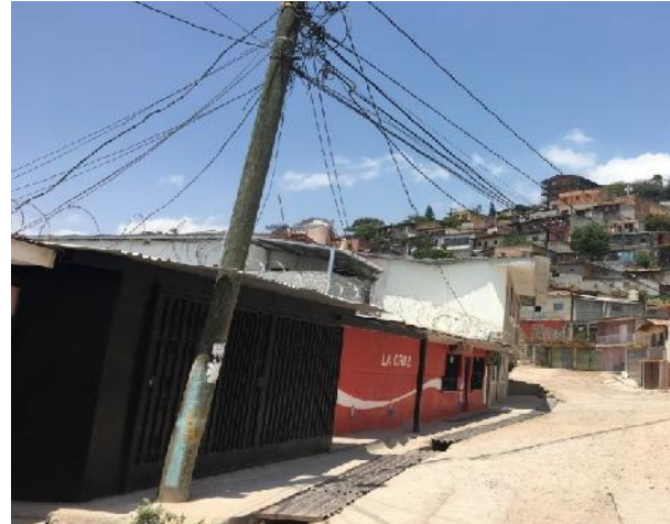
En la imagen se muestra el estado actual de la calle a pavimentar.