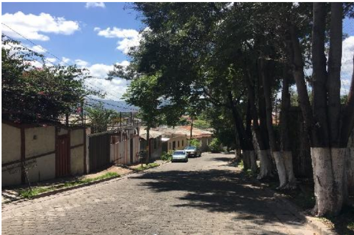
Vista de calle a pavimentar con concreto hidráulico (calle b)