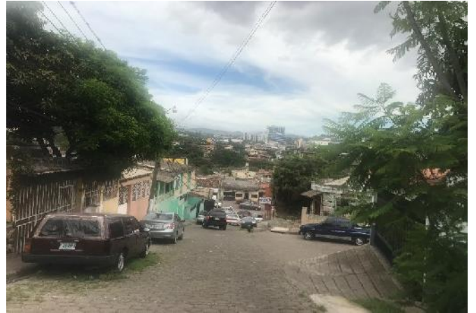
Panorama de calle donde se desmontará el adoquin existente.