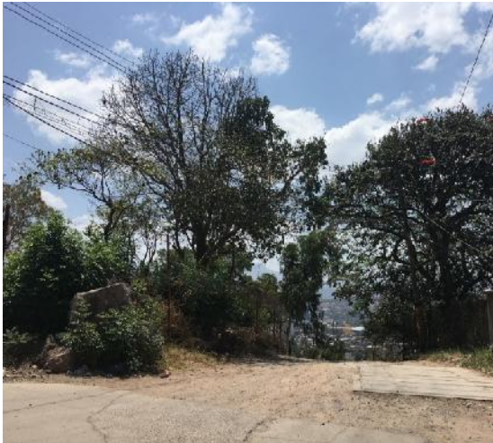
En la imagen se muestra el inicio de la calle a pavimentar.