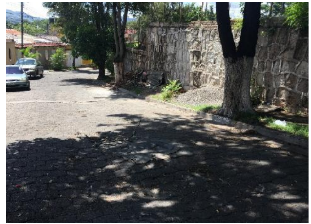
Vista de pozo de alcantarillado sanitario