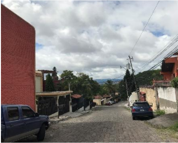
Vista de calle a pavimentar con concreto hidráulico.