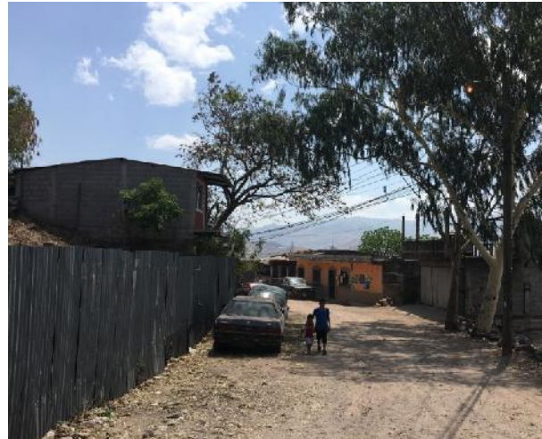
En la imagen se muestra un tramo intermedio de la calle a pavimentar.