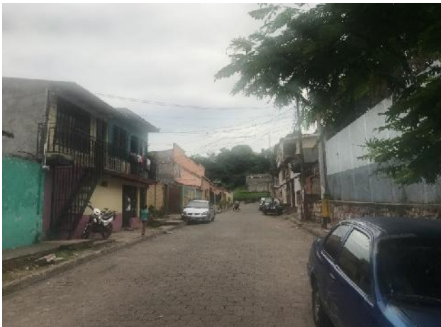
Calle a pavimentar con concreto hidráulico.