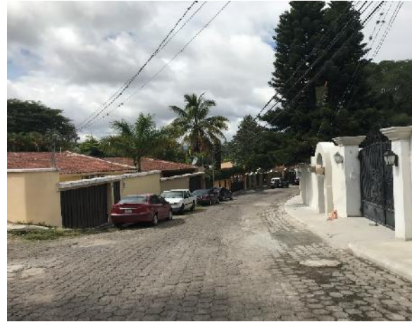
Vista de final de la calle a pavimentar.