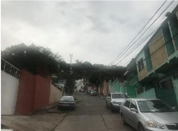
Se observa uno de los pozos a nivelar.