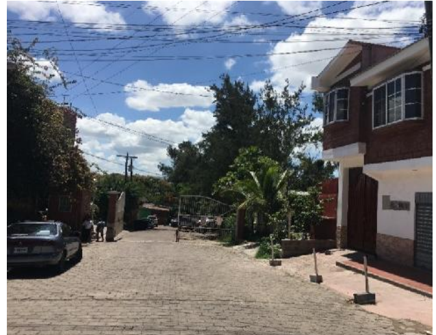
Panorama de calle a pavimentar con concreto hidráulico (calle a)