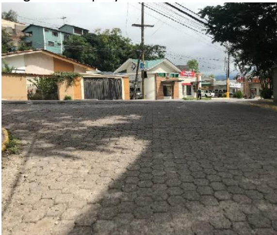
Inicio de calle a pavimentar con concreto hidráulico.