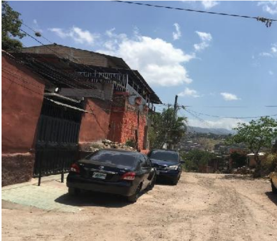
En la imagen se muestra el estado actual de la calle a pavimentar.